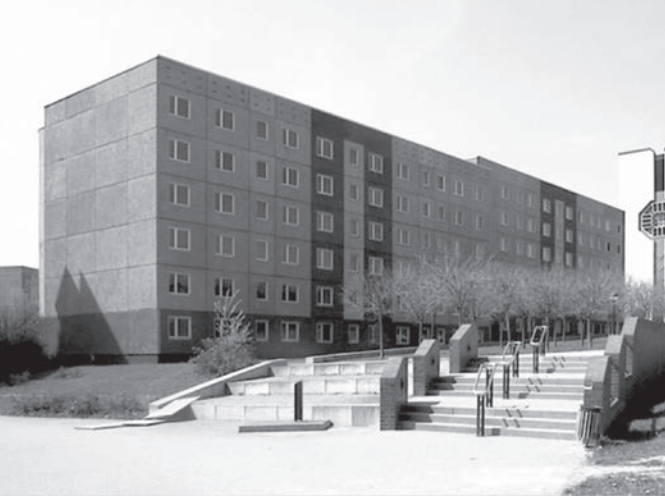
Il. 10. Haus 6 Leinefelde – stan przed przekształceniami