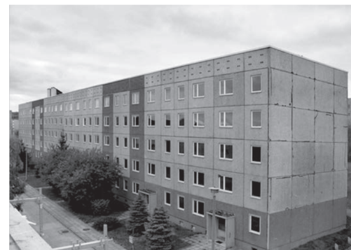
Il. 9. Haus 5 Leinefelde – stan przed rehabilitacją (źródło: https://www.sfa.de/stadtumbauost/haus-05 , dostęp: 9.10.2019) Ill. 9. Haus 5 Leinefelde – condition after the renovation (source: https://www.sfa.de/stadtumbauost/haus-05 , access: 9.10.2019)