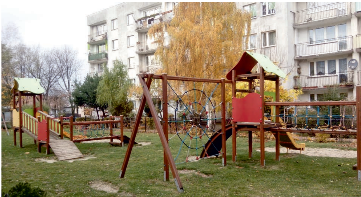
Il. 2. Plac zabaw – osiedle Barwinek, Kielce / Playground – Barwinek housing estate, Kielce

Outdoor activities include equipping playgrounds with extra equipment, construction of new playgrounds (Ill. 2), outdoor gyms (Ill. 3) and sports fields, renovation