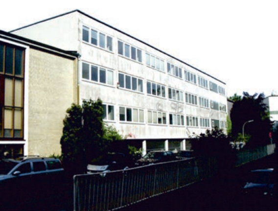
Il. 4. Budynek biurowy przy Bogenallee 12 przed rehabilitacją Ill. 4. Office building at Bogenallee 12 before the renovation