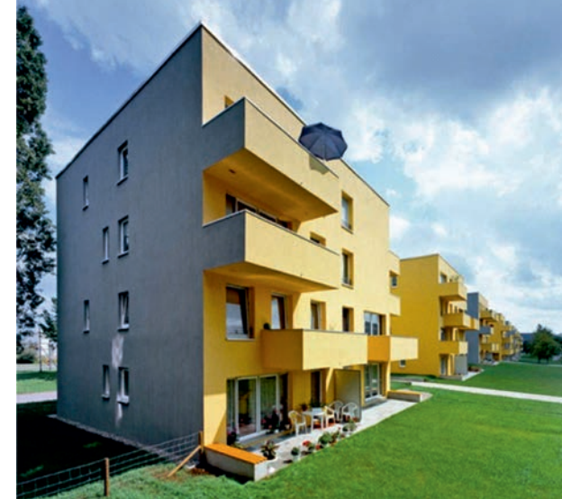
Il. 14. Haus 7 Leinefelde – stan po rehabilitacji (źródło: https://www.sfa.de/stadtumbau-ost/haus-07 dostęp: 9.10.2019)