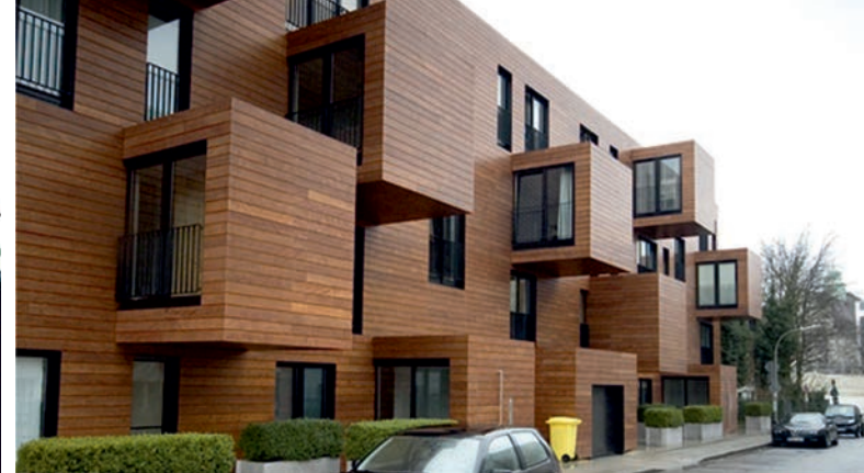
Il. 5 Budynek przy Bogenallee 12 po rehabilitacji Ill. 5. Building at Bogenallee 12 after the renovation

kie mieszkania uzyskały od strony dziedzińca obszerne balkony, natomiast od elewacji frontowej powiększona została powierzchnia mieszkania. Wspomniane Pudełka Flex nadają charakterystyczny nowoczesny charakter całej bryle, a dodatkowo stanowią w zależności od mieszkania salon, jadalnię bądź sypialnię. Mieszkania zlokalizowane na parterze od strony dziedzińca poprzedzone są patio.