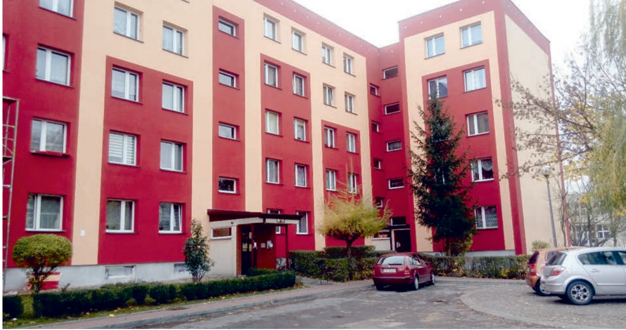
Il. 1. Termomodernizacja – budynek na osiedlu Barwinek w Kielcach Ill. 1. Thermal efficiency improvement – a building at the Barwinek housing estate in Kielce

do współczesnych wymogów. Do najbardziej zauważalnych problemów osiedli z wielkiej płyty zaliczyć można brak czytelności układów przestrzennych, słabą estetykę samych budynków jak i przestrzeni wokół, brak ciekawie ukształtowanych terenów zielonych oraz niskie standardy mieszkaniowe.