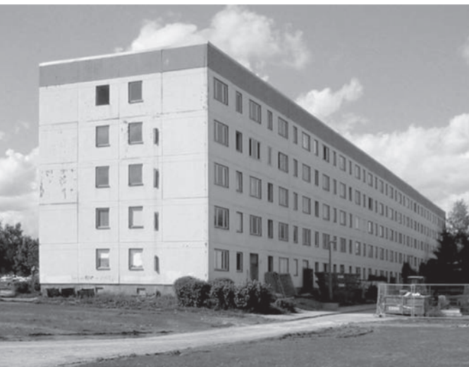
Ill. 13. Haus 7 Leinefelde – condition after the renovation