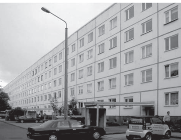
Il. 7. Haus 8 Leinefelde – stan przed rehabilitacją Ill. 7. Haus 8 Leinefelde – condition after the renovation