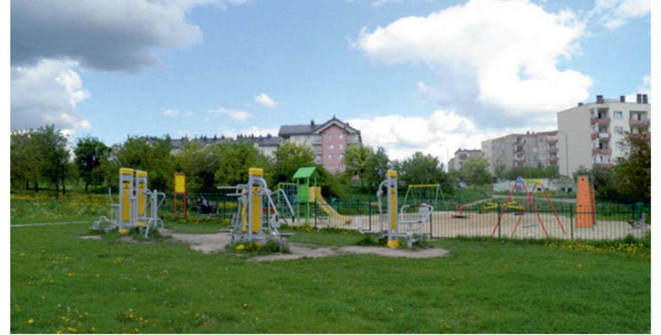
Il. 3. Siłownia zewnętrzna – osiedle Ślichowice, Kielce / Outdoor gym – Ślichowice housing estate, Kielce

czy też nasadzenia zieleni, która pozytywnie wpływa na odbiór estetyczny przestrzeni.