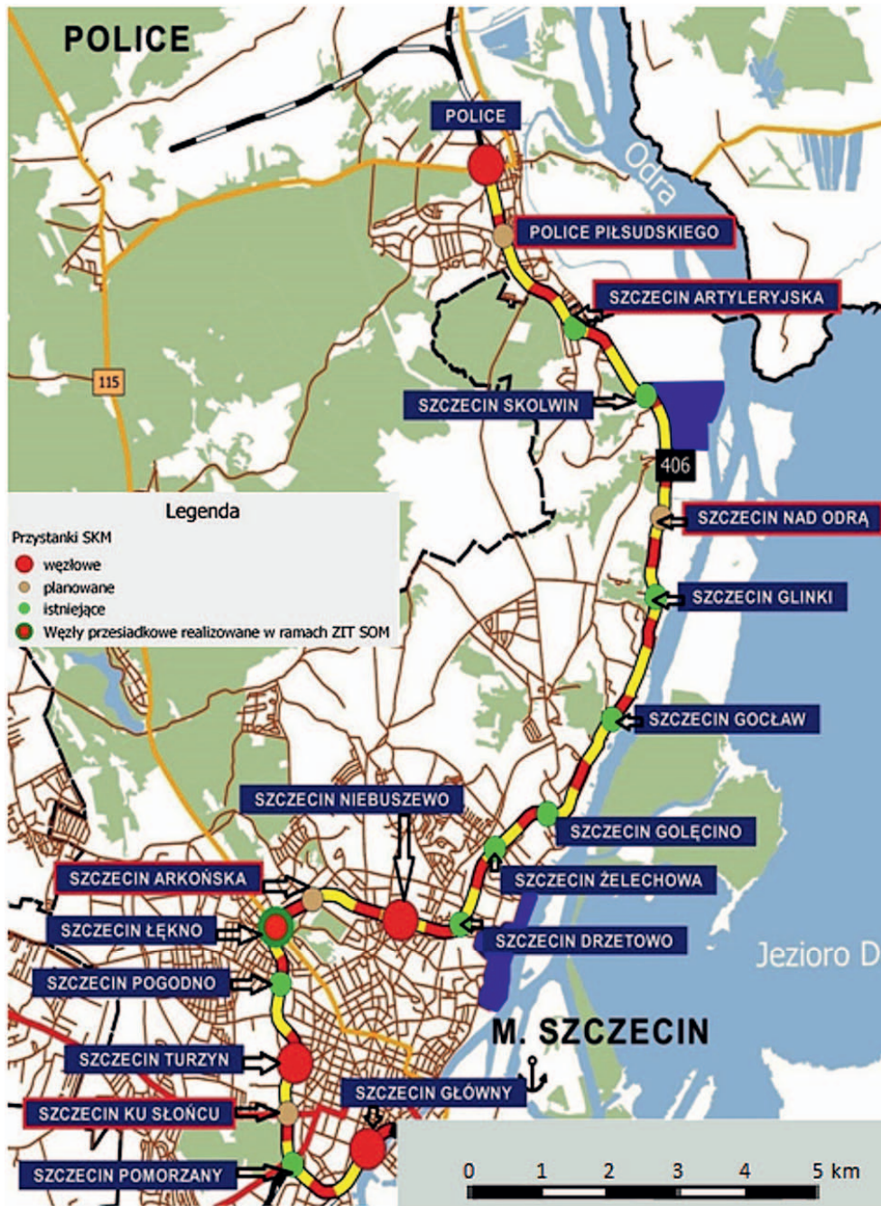
Ryc. 2. Rozmieszczenie przystanków na linii SKM do Polic.