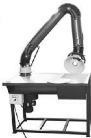
Rys. 10.3 Urządzenie odciągowe ze stołem spawalniczym (stanowisko spawalnicze typu S-1000) bez filtracji, wyposażone w wentylator 0,75kW, ramię Oskar (zasięg max 2m) [17]

Hermetyzacja urządzeń, stanowisk pracy, instalacji jako środek zabezpieczania pracowników przed zagrożeniami pyłowymi stosowana jest wszędzie tam, gdzie można zabudowaniem stosunkowo niewielkiej przestrzeni odizolować od całego pomieszczenia źródło emisji pyłów. Odprowadzane ze stref hermetyzowanych, pyły ze względu na większe stężenie są łatwiejsze do unieszkodliwiania w systemach oczyszczających niż występujące w instalacjach wentylacyjnych ogólnych, a przez to ekonomiczniejszy jest cały proces oczyszczania (metodą dopalania katalitycznego, adsorpcji, chemisorpcji) [6]. W pozostałych przypadkach, na podstawie analizy parametrów pobranego u źródła emisji pyłu, należy dobrać odpowiedni system odciągowy lub urządzenie filtracyjno-wentylacyjne, odpowiednie do rodzaju i stężenia pyłu. Na rys. 10.3 przedstawiono przykładowe urządzenie odciągowe ze stołem spawalniczym. Natomiast na rys. 10.4 zaprezentowano urządzenie filtrowentylacyjne do prac szlifierskich.