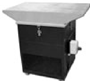
Rys. 10.4 Urządzenie filtrowentylacyjne do prac szlifierskich - stanowisko wyposażone w kompaktowy wkład filtracyjny i filtr wstępny metalowy [17]

Sprzęt taki stosuje się, gdy zawartość tlenu w powietrzu środowiska pracy zmniejsza się poniżej 17% objętości lub gdy stężenie zanieczyszczeń jest bardzo duże bądź skład zanieczyszczeń nie jest znany dokładnie. Użytkowanie środków ochrony osobistej powoduje dodatkowy wydatek energetyczny, w związku z koniecznością pokonania dodatkowych oporów. Ten dodatkowy wydatek energetyczny, częściowa dekoncentracja uwagi związana z niewątpliwym dyskomfortem, ograniczony kontakt ze środowiskiem powodują zwiększenie zmęczenia, obniżenie wydajności oraz wzrost liczby wypadków przy pracy. Z tych też powodów, sprzęt ochrony osobistej powinien być stosowany tylko doraźnie i przy tych stanowiskach, gdzie zastosowanie drogiej i skomplikowanych urządzeń wentylacyjnych jest niecelowe i nieekonomiczne (np. prowadzenie prac krótkotrwałych na otwartym powietrzu) [6].