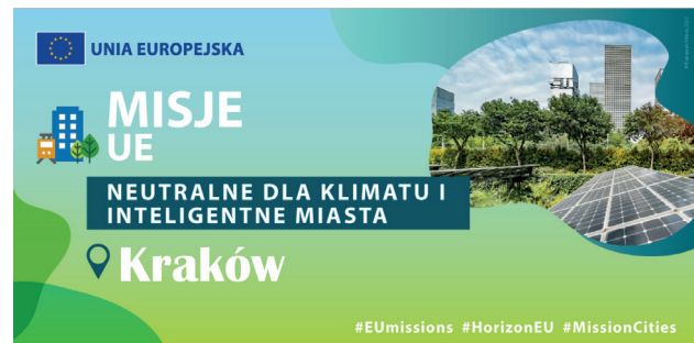
Misja 100 miast – materiał informacyjny

w osiągnięciu neutralności klimatycznej. Ośrodki uczestniczące w misji realizują działania z obszaru badań i innowacji, dotyczące m.in. elektromobilności, efektywności energetycznej i planowania urbanistycznego. Przy wsparciu mieszkańców, organizacji pozarządowych i przedstawicieli biznesu miasta uczestniczące opracowują kontrakty klimatyczne, czyli plany dojścia do neutralności klimatycznej w takich sektorach, jak: energia, budynki, gospodarka odpadami i transport wraz z powiązаныmi planami inwestycyjnymi.