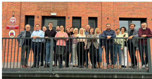
Uczestnicy projektu NEEST

alternatywnych oraz finalnie z utworzeniem scenariusza głównego, pozwalającego na przeprowadzenie skutecznej i sprawiedliwej transformacji energetycznej.