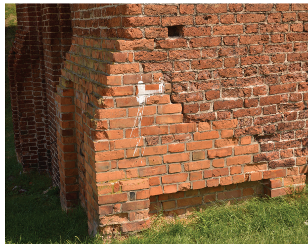
Il. 5. Fragment średniowiecznego gdaniska w Kwidzynie. Przykład czytelności i odróżnialności ingerencji (współczesnych uzupełnień)

Fig. 5. Fragment of medieval latrine tower in Kwidzyn. An example of clear and distinguishable intervention (contemporary inserts)