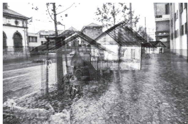
Il. 8. Zrzut ekranu widoku ulicy miasta z perspektywy zwiedzającego, wyposażonego w system rozszerzonej rzeczywistości (HMD – Head-mounted display – przenośny wyświetlacz LCD zakładany na głowę, obsługujący stereoskopowe obrazy 3D).

Wizualizacja zrekonstruowanych i wyświetlanych rekonstrukcji obiektów zabytkowych in situ