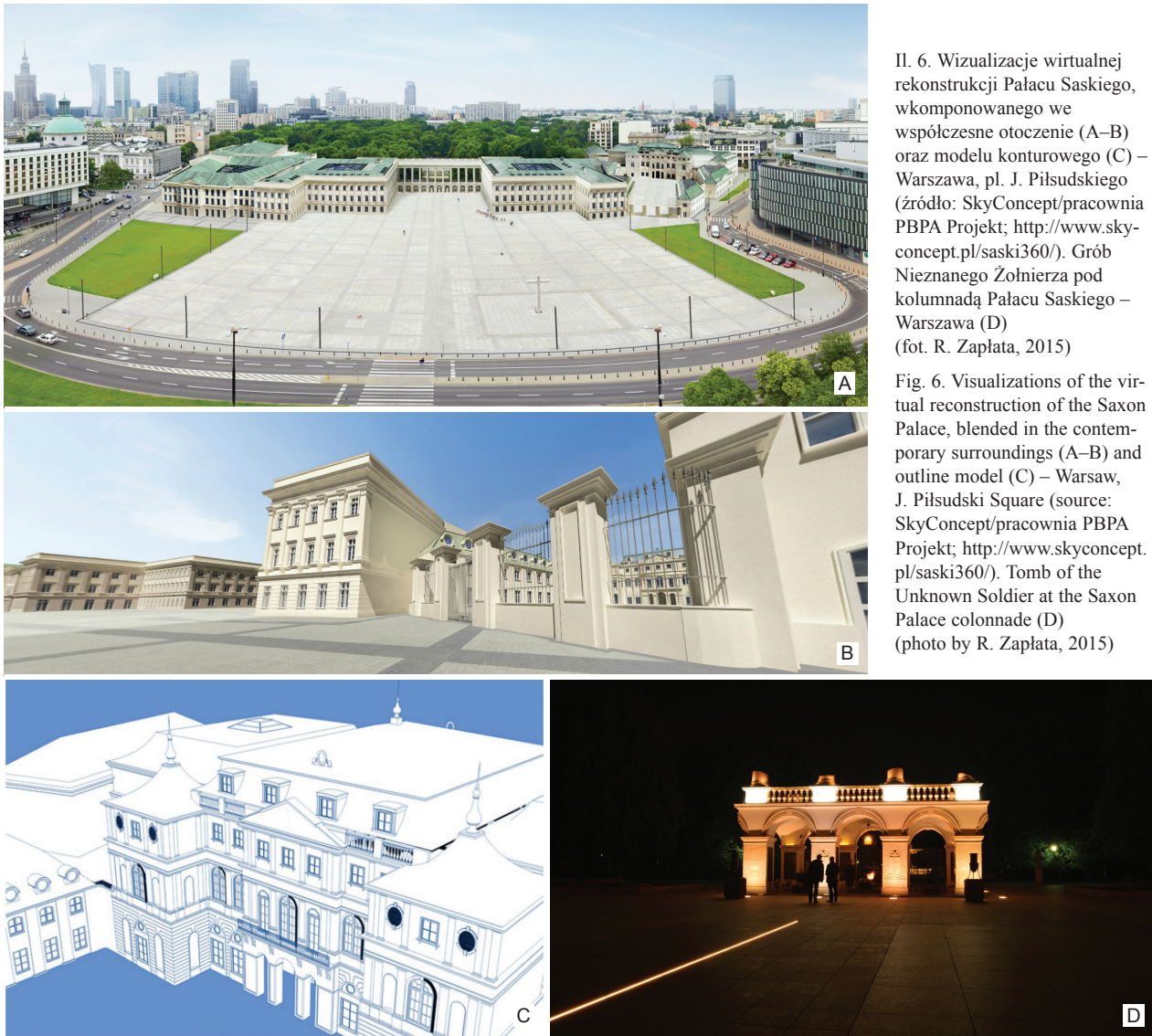
II. 6. Wizualizacje wirtualnej rekonstrukcji Pałacu Saskiego, wkomponowanego we współczesne otoczenie (A–B) oraz modelu konturowego (C) – Warszawa, pl. J. Piłsudskiego. Grób Nieznanego Żołnierza pod kolumnadą Pałacu Saskiego – Warszawa (D)