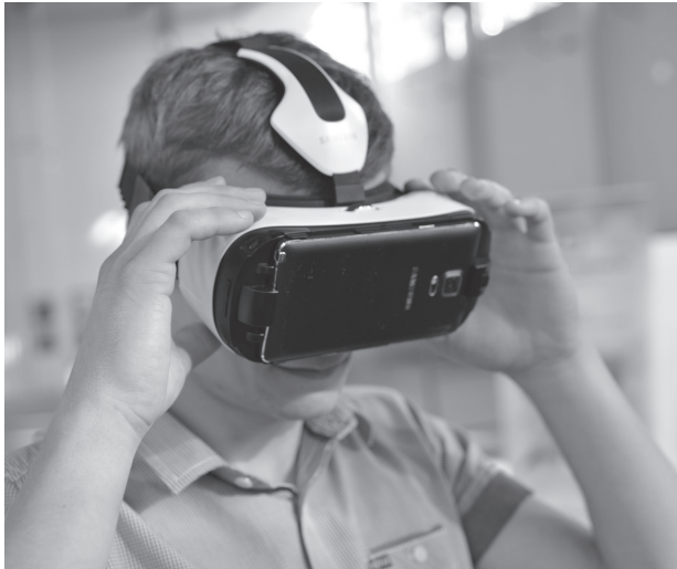
Il. 4. System wirtualnej rzeczywistości – prezentacja wirtualnych modeli architektonicznych w technologii umożliwiającej zmysłowe zanurzenie w VR. Zdjęcie wykonane podczas wystawy pt. „The New Dimension of Architecture” – Katowice 2015. Organizacja: Laka™, Archipictura™, 4Experience