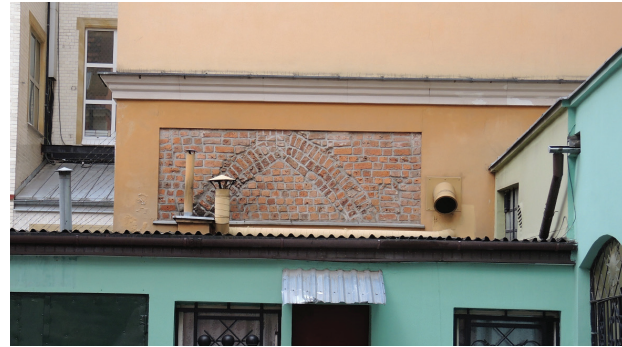
Il. 2. Przykład fragmentarycznego eksponowania średniowiecznych elementów budynku – Wrocław, ul. Więzienna

Fig. 1. Example of superimposed layers of different styles and fragmentary (partial) exposure of architectural style, House of Golden Mary, Wrocław. The 14 th -century townhouse remodeled in the middle of the 19 th century