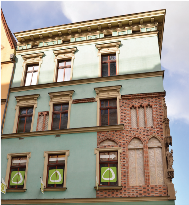
Il. 1. Przykład nawarstwień stylistycznych i fragmentarycznego (częściowego) eksponowania stylistyki architektonicznej – Dom pod Złotą Marią, Wrocław. XIV-wieczna kamienica przebudowana w połowie XIX w. (fot. R. Zapłata, 2015)

Fig. 1. Example of superimposed layers of different styles and fragmentary (partial) exposure of architectural style, House of Golden Mary, Wrocław. The 14 th -century townhouse remodeled in the middle of the 19 th century (photo by R. Zapłata, 2015)