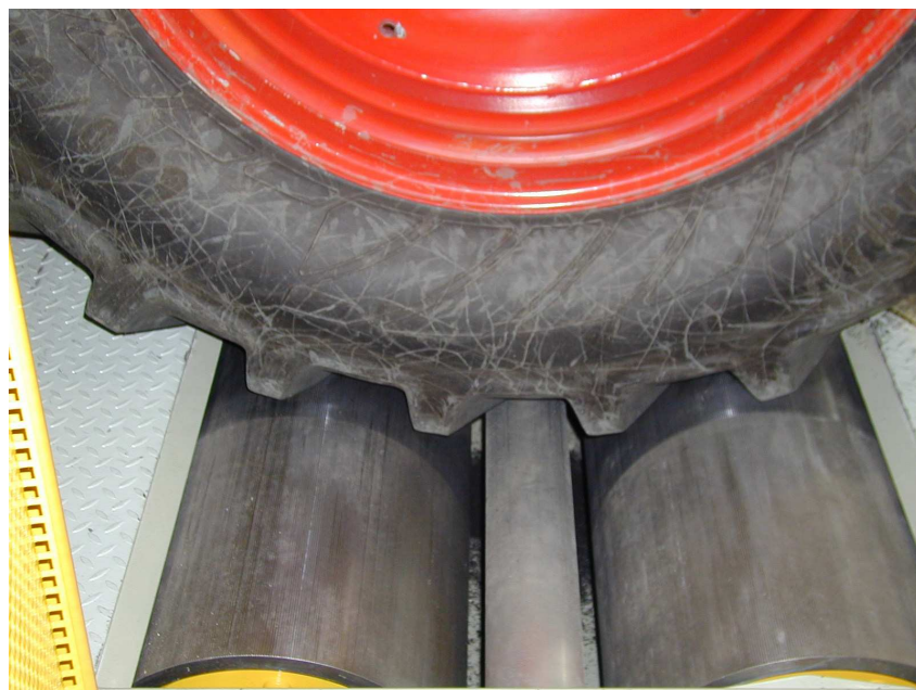
Rys. 2. Dynamometr walcowy obciążający Fig. 2. Load drums detail

Pracownia wyposażona jest w dynamometr elektryczny, który poprzez wał odbioru mocy mierzy charakterystyki silników do mocy maksymalnej 500 kW. Stanowisko do pomiarów ciągników wyposażone jest w 4 niezależne dynamometry walcowe, rys. 2. Na stanowisku można zmieniać rozstaw osi od 2 000 mm do 3 500 mm. Maksymalna siła uciągu wynosi 200 kN a moc na kołach napędowych 420 kW. Prędkość robocza do 16 km/godz.