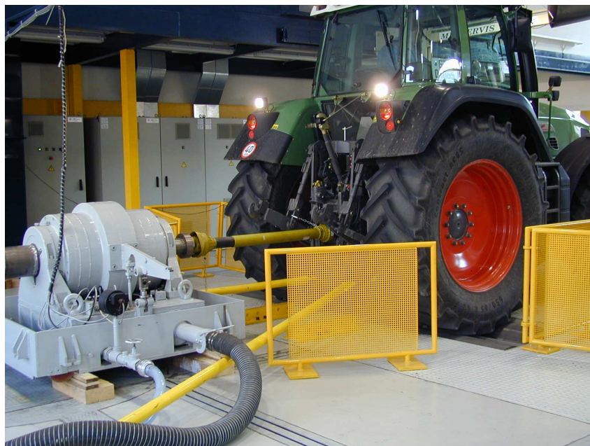
Rys. 1. Pomiar poprzez wał odbioru mocy Fig. 1. The PTO power testing

Pracownia wyposażona jest w dynamometr elektryczny, który poprzez wał odbioru mocy mierzy charakterystyki silników do mocy maksymalnej 500 kW. Stanowisko do pomiarów ciągników wyposażone jest w 4 niezależne dynamometry walcowe, rys. 2. Na stanowisku można zmieniać rozstaw osi od 2 000 mm do 3 500 mm. Maksymalna siła uciągu wynosi 200 kN a moc na kołach napędowych 420 kW. Prędkość robocza do 16 km/godz.