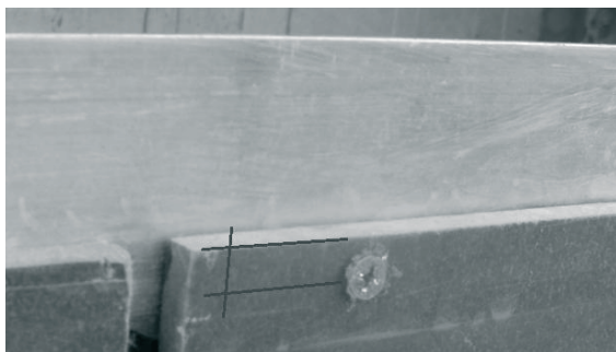
Fot. 4. Niewłaściwa odległość pomiędzy krawędzią okładziny włóknisto-cementową a otworem do łącznika mechanicznego (zamiast systemowych nitów zastosowano śrubę)

Częstym błędem wykonawczym jest rozmieszczenie łączników mechanicznych łączących okładzinę z rusztem bez odpowiedniego odstępu od krawędzi (fot. 4). Połączenie takie nie zapewnia odpowiedniej nośności i trwałości łączonego zestawu.