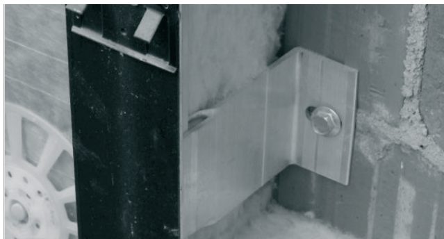
Fot. 1. Niepoprawne osadzenie kotew w spoinach podczas mocowania rusztu elewacyjnego do ścian

Podczas wykonania elewacji wentylowanej niedopuszczalnym jest zastosowanie elementów elewacji niewymienionych w dokumentacji aprobującej. Niebezpiecznym może być również wykorzystanie materiałów zamiennych nawet o podobnych parametrach wytrzymałościowych. Np. w przypadku aluminiowych elementów rusztu zamiana śrub samowiercących aluminiowych na stalowe (nie wymienionych w dokumentacji aprobującej) ocynkowane może doprowadzić do powstania ogniw korozyjnych.