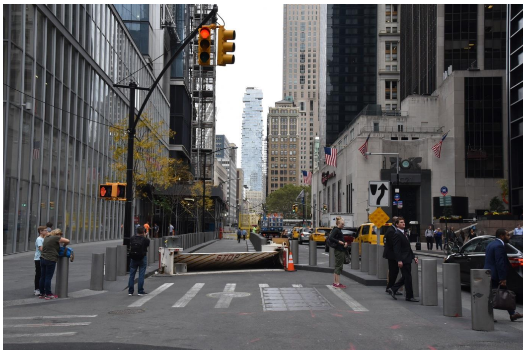
Fig. 9. Road barrier and rows of steel bollards along Church Street in Lower Manhattan. In the background: New York Tribeca Condos, 2016.

Ryc. 9. Bariera drogowa i rzędy stalowych pachołków wzdłuż Church Street na Dolnym Manhattanie, w głębi widoczny budynek New Tribeca Condos, 2016.