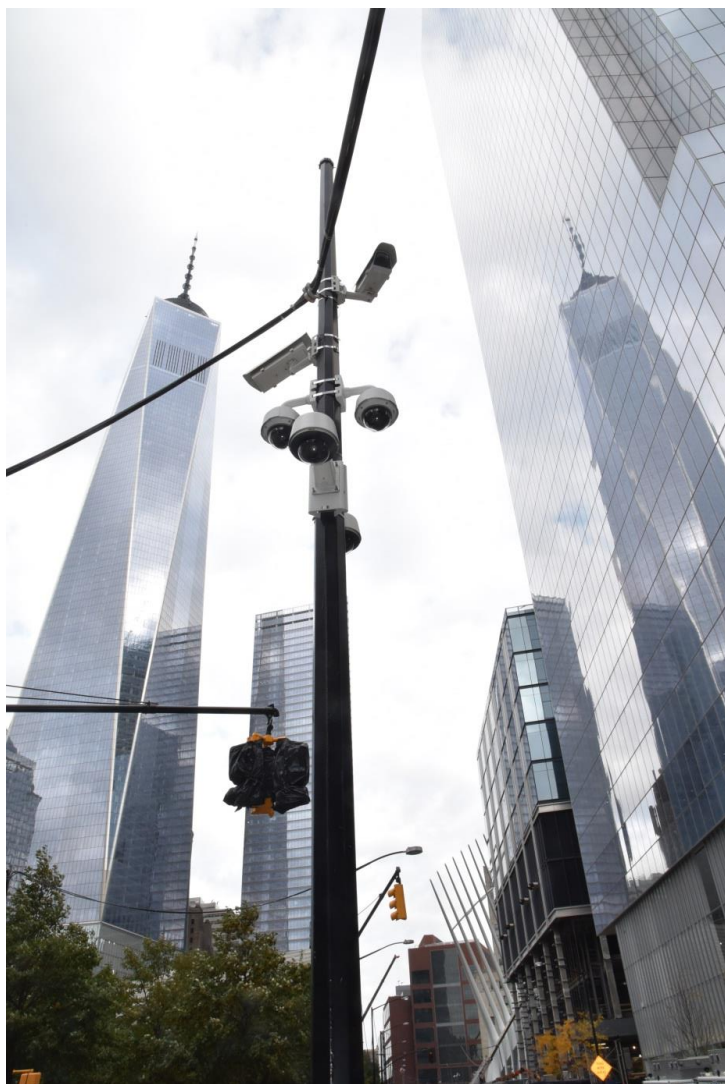
Fig. 13. Street monitoring police system cameras. In the background: One WTC, 2016.

Ryc. 13. Kamery policyjnego systemu monitoringu ulicznego, w głębi wieża WTC 1, 2016.