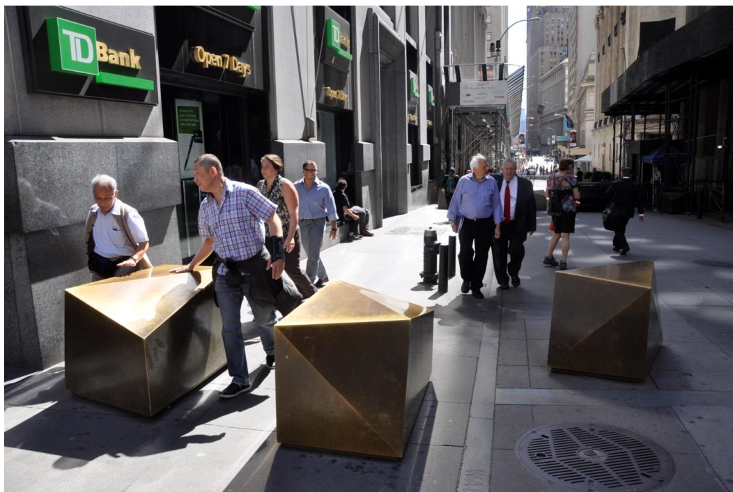
Fig. 11. Road barrier at the entry to Wall Street made of bronze NoGo elements, 2013.