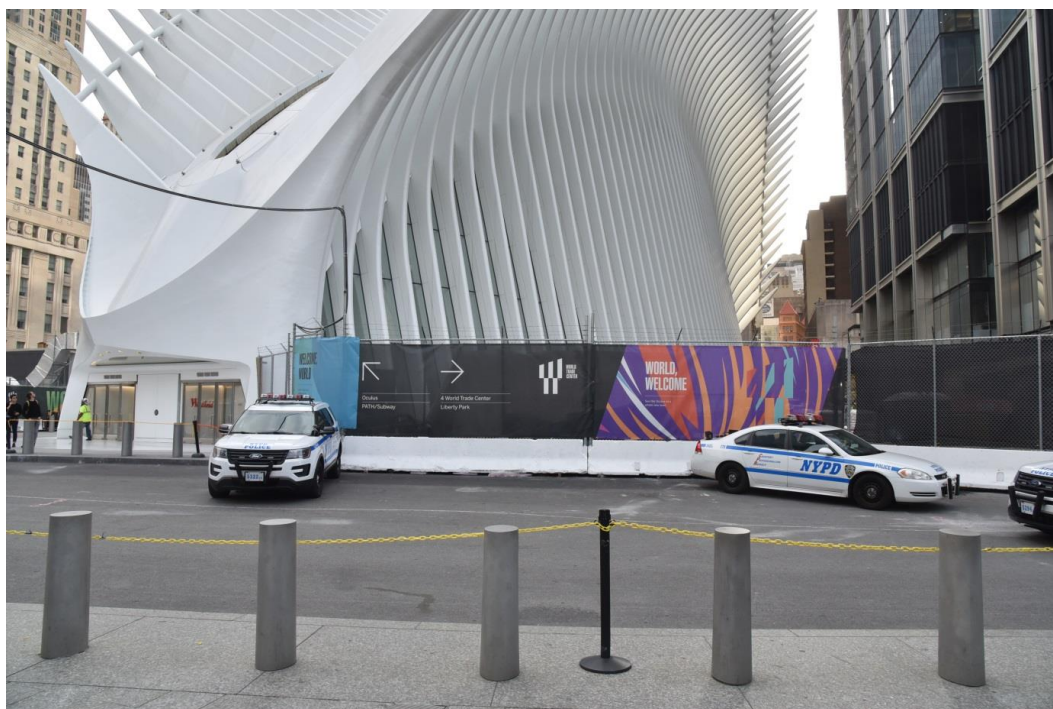
Fig. 5. Permanent and temporary road barriers (the so-called Jersey barriers ) and police cars in front of the PATH railway terminal building, 2016.

New Yorkers are indignant at the enormous cost of this investment, amounting to 4 billion dollars, which is unjustified by its functional needs. Contrary to its name, it is not even a transfer node: it is just the PATH suburban railway station which connects New Jersey with Manhattan. Approximately 50,000 travelers use it on a daily basis, which puts it in 18th place in the city underground stations in terms of the number of serviced travelers. The first floor of the facility is filled with a luxurious shops, including the Apple, Breitling and Kate Spade brands. An architectural critic from the New York Times defined this investment as a disaster for architecture and for the city [Kimmelman 2016]. What is worse, one can see numerous failures and sloppy details which are shocking in relation to that kind of iconic building.