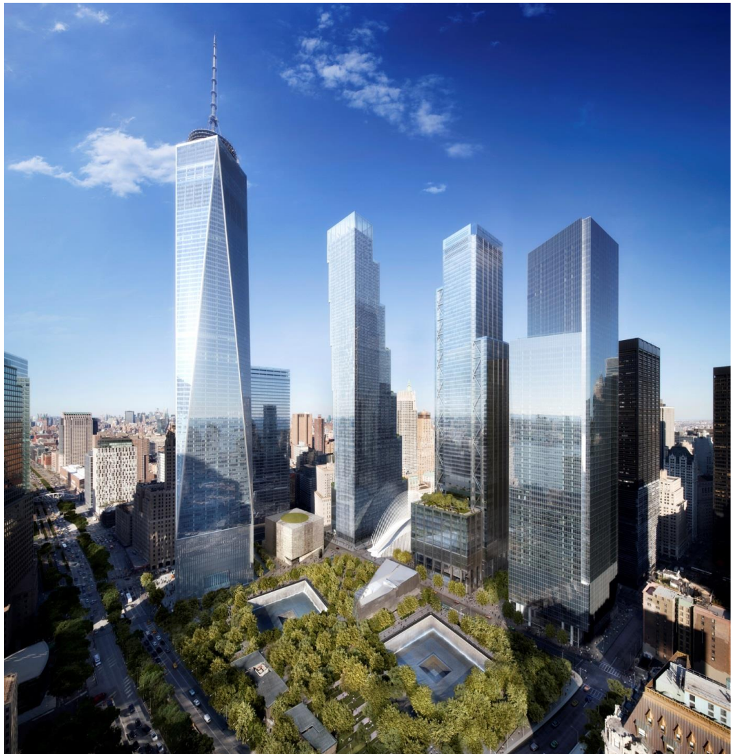
Fig. 2. Visualization of the WTC complex. From the left: WTC 1(David Childs, SOM), WTC 7(David Childs, SOM), WTC 2 (Bjarke Ingels, BIG), WTC 3 (Richard Rogers) and WTC 4 (Fumihiko Maki). At the bottom: 9/11 Memorial Museum, Performing Arts Center and Oculus.

The process of rebuilding the World Trade Center is reaching its end. The construction of streets and infrastructure has been completed, and the shape of the whole complex is already visible. An open memorial park and reflective pools were constructed in 2011, the 9/11 Memorial Museum was opened in 2014, and the construction of towers 1, 4 and 7 were completed. In 2016, a spectacular railway terminal building, the known as the Santiago Calatrava's Oculus, was opened. The completion of WTC 3, is planned for 2018. The completion of the last facilities, i.e. Performing Arts Center and WTC 2, the design of which has been entrusted to Bjarke Ingels from the Norwegian office BIG, is planned for 2020.