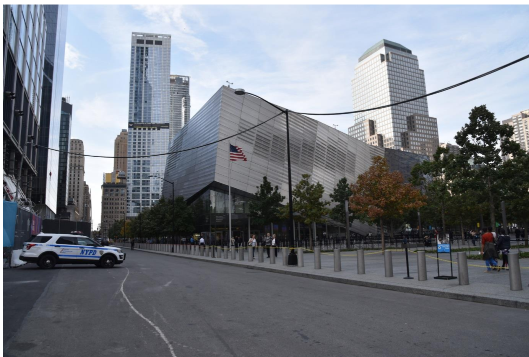
Fig. 4. Perimeter barrier along Greenwich Street in front of the National September 11 Memorial Museum, 2016.

May 2014 saw the opening of the entrance pavilion to the National September 11 Memorial Museum, located close to cascade pools reflecting the foundations of the destroyed towers. The facility has been designed by Craig Dykers and his office, Snøhetta. The building is totally different from the original competition vision. It is much lower, with a surface area amounting to 5,600 square meters. It has a dynamic architectural form and glass and metal facades with a shattered deconstructivist appearance. In 2006, James Kallstrom, a former FBI director and counter-terrorism advisor to Governor Pataki, sent a letter to the Governor in which he wrote: The museum complex is burdened with a particular risk as it constitutes a very attractive target. This arises from its particular world status and from the fact that crowds of people will gather in it [16, p. 215]. Therefore special measures were implemented in order to protect the museum against the results of a bomb attack. Its structure was reinforced and its facades were covered by glass panes resistant to an explosion. Furthermore, controls for visitors was introduced, by screening them like in airports.