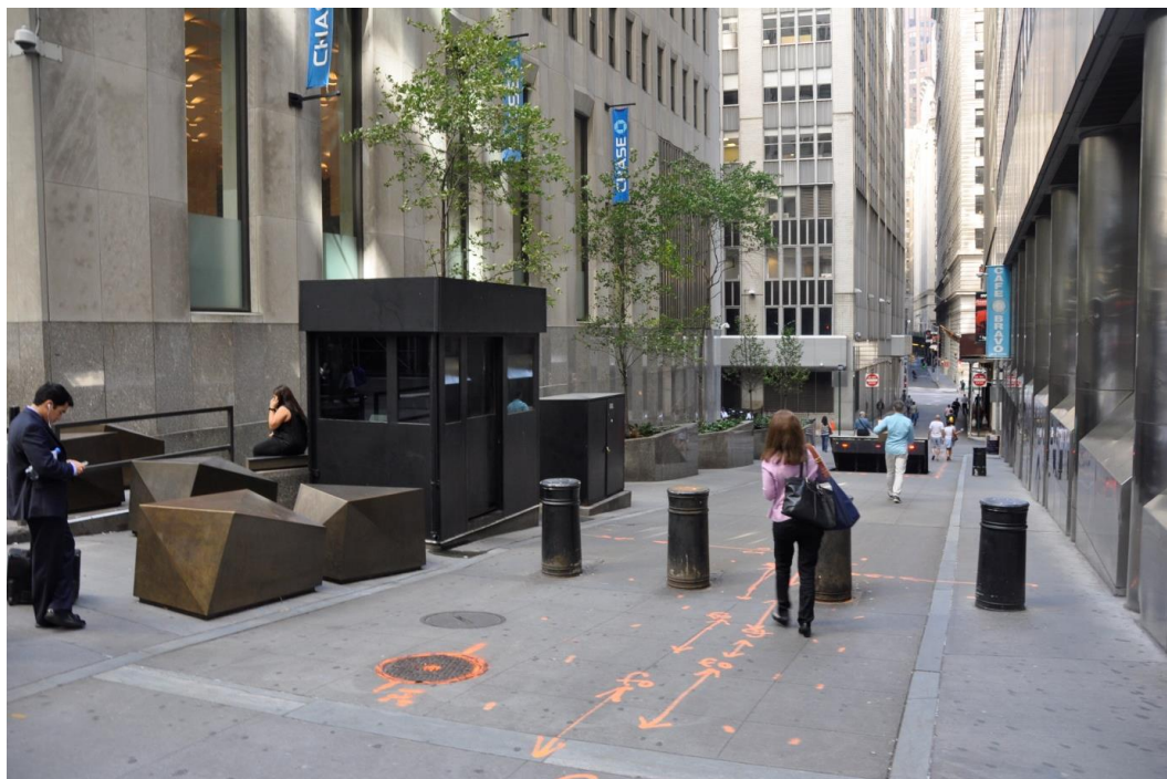
Fig. 10. Road barriers, bollards raised and lowered hydraulically and a police checkpoint on Wall Street, 2013.

Ryc. 10. Bariery drogowe, hydraulicznie opuszczane pacholki i posterunek policji przy Wall Street, 2013.