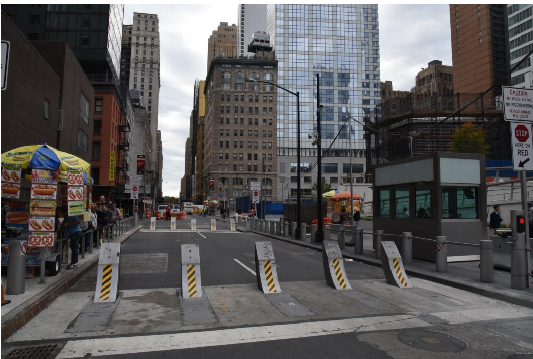
Fig. 7. Double road barrier raised and lowered hydraulically (known as the sally port ) with the bullet-proof police station controlling it, at the southern entry to the World Trade Center, 2016.

The whole area of the World Trade Center, which is enclosed by Church, Vesey and Liberty Streets, became a separate security zone, access to which is possible only in five points of entry, supervised by the police checkpoint. Several police stations and local police headquarters, in which 600 police officers work, are located on the WTC area. A special procedure is implemented regarding servicing of the tourist traffic. Parking bays to which touring buses transport visitors and then drive through a control station to underground garages, are located along Liberty and Greenwich Streets. In order to ensure increased car traffic flow, the establishment of the special Trusted Access Program has been introduced, supervised by the police and including the taxis, company cars and delivery trucks which regularly enter the area of the World Trade Center. The World Trade Center underground checkpoint ( Vehicular Security Center - VSC ) was erected at the southern part of the complex, in the form of an underground bunker for the monitoring of all vehicles, including delivery trucks and buses, entering the garages located under the World Trade Center complex. The construction of the checkpoint, located at a depth of 20 meters and enclosed by the reinforced concrete trough formed by the piles and cavity walls, cost 633 million dollars. Such a budget is almost equal to the costs of constructing the Museum. It also exceeds the cost of construction of the two original WTC towers [5].