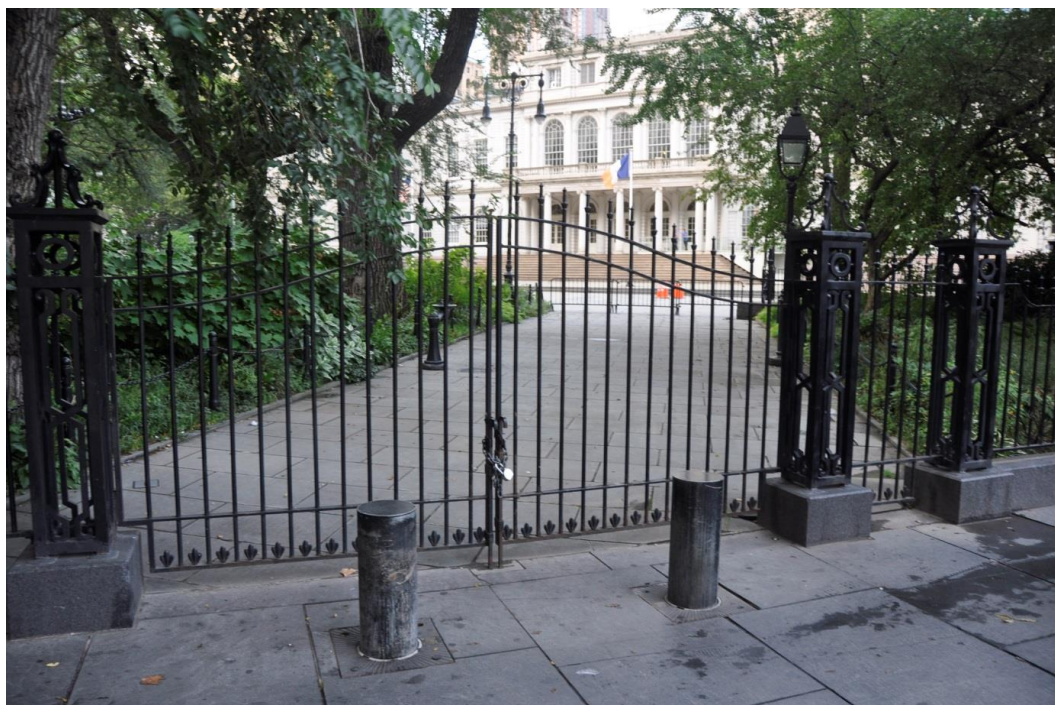
Fig. 12. City Hall Park entrance gate protected by hydraulic bollards. In the background: the New York town hall, 2013.

supervising commercial real estate have been incorporated into the scheme. The cameras trace and detect unnatural behavior and they immediately inform the mobile police stations about them (e.g. about a car which drives around a given quarter several times or about a package left on the street). Supervision over the system is conducted by a local command center located in Manhattan. The press were informed that the possibility of using biometric equipment identifying the facial features of particular people and sensors detecting biological contamination in the New York safety system is also considered.