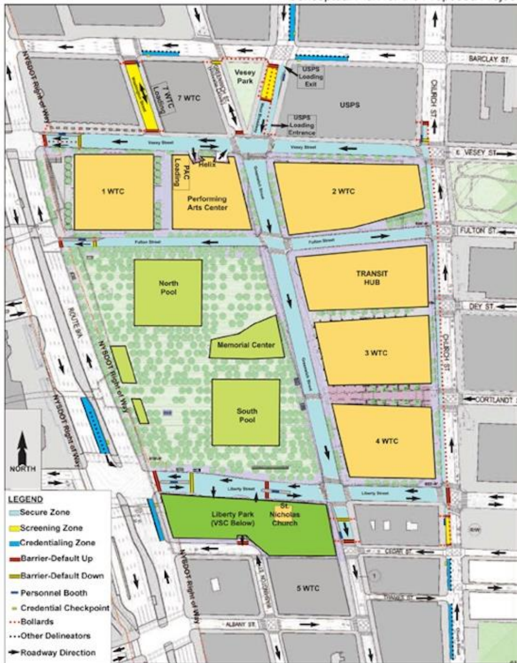
World Trade Center Campus Security Plan EIS Figure 1-2 Conceptual Plan for the Proposed Project

Note: Image is schematic and for conceptual purposes only.