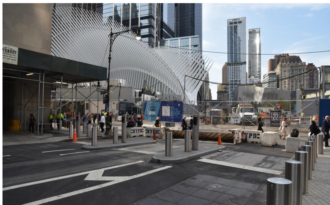
Fig. 6. Road barrier on Greenwich Street at the northern entry to the World Trade Center complex, 2016.

In 2009, an agreement was concluded between the World Trade Center investor, i.e. the management of the Port Authorities, and the New York Police Department, under which the police gained autonomy at ensuring safety on the territory of the World Trade Center. A detailed World Trade Center Security Plan was made public in 2013, as a part of the planning procedure required called Environmental Impact Statement [18].