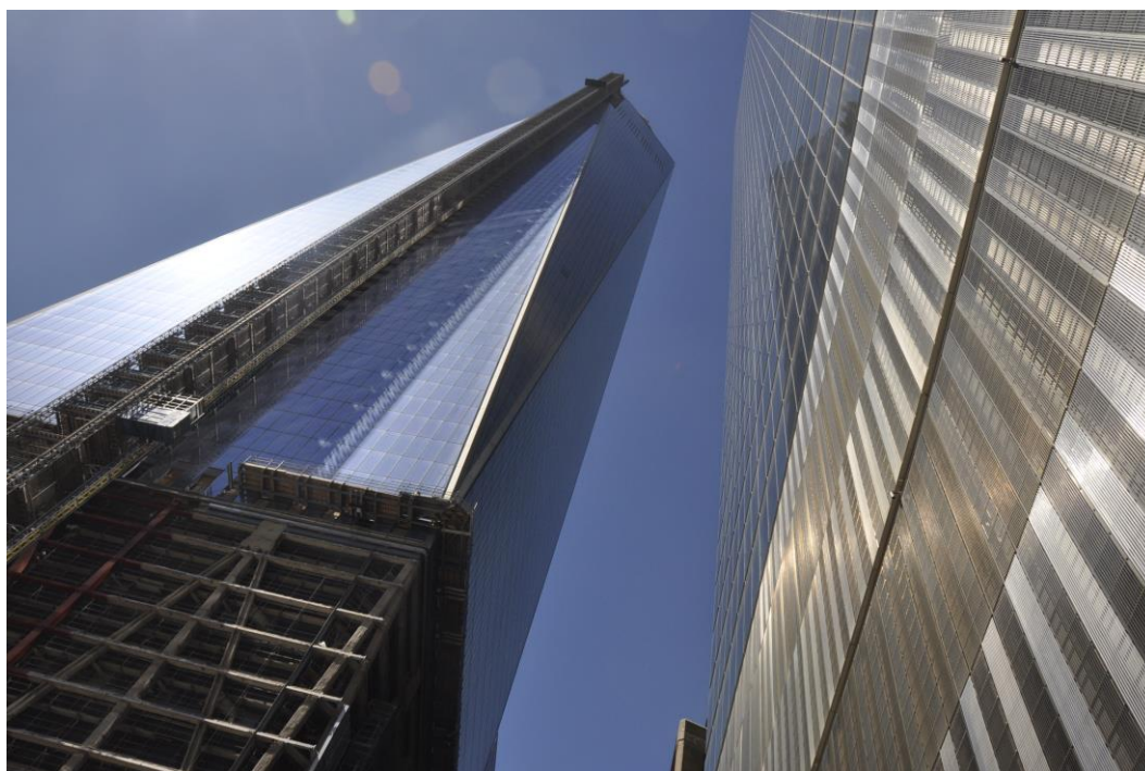
Fig. 3. WTC 1: an office tower on top of a bunker; building during the construction, 2013.

The New York police, which is responsible for the safety of the complex, exerts the great impact on the shape of its reconstruction. From the beginning of the design works, the New York police imposed numerous responsibilities and limitations on the architects [14, p. 174]. Moreover, in the spring 2005, all design works were completely postponed for a period lasting almost a whole year. The perspective of a bomb attack carried out by means of a vehicle borne improvised explosive device (VBIED) is one of the police's greatest concerns [12, pp. 202-210]. Therefore, the structures and facades of buildings have been reinforced and hardened, and standoff zones have been implemented around them. In the Ground Zero complex, ...the entire lower portions of building designs are being rendered as massive concrete bunkers designed to accommodate blast rather than people. For security reasons, the design [of the Freedom Tower] has been turned into nothing other than a bunker: its structure two hundred feet in height consisting of titanium and stainless steel [9, p. 105].