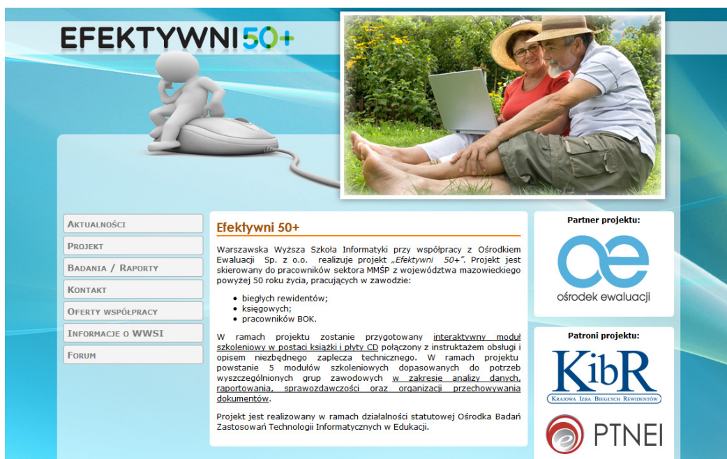
Rysunek 1. Strona WWW projektu „Efektywni 50+”

Portal edukacyjny EFEKTYWNI50+ powstanie na bazie strony WWW projektu dostępnej pod adresem http://www.efektywni50plus.wysi.edu.pl (rysunek 1). Zostaną tam umieszczone treści szkoleniowe w formie tekstu, obrazu oraz nagrań wideo do poszczególnych modułów. Portal edukacyjny stanie się również miejscem kontaktu (m.in. poprzez forum dyskusyjne) z prowadzącymi oraz z innymi uczestnikami szkolenia. Dostęp do portalu edukacyjnego będzie możliwy tylko po zalogowaniu.