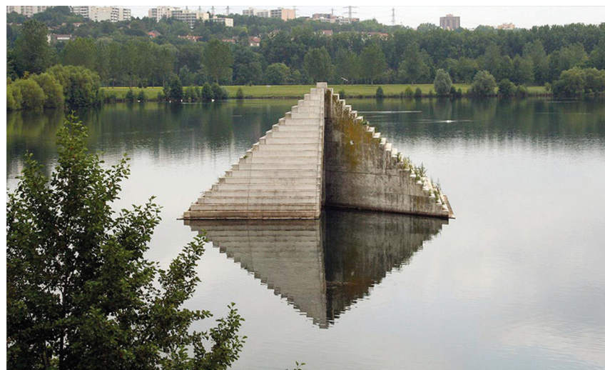
Il. 1. Dani Karavan, Kikar Lewana, Tel Awiw (1988). Źródło: https://www.tygodnikpowszechny.pl/files/import/1526-mck-str5.jpg , dostęp 2018.03.30 Il. 2. Dani Karavan, Axe Majeur, Cergy-Pontoise (w trakcie), widok na stację: Passerelle, Ogród Praw Człowieka, Terasse, Wieża Belwederu. Źródło: Dani Karavan. Esencja miejsca. The Essence of Place, kat. wyst., Międzynarodowe Centrum Kultury w Krakowie, czerwiec-wrzesień 2015, Kraków 2015

zajęte – gdzie człowiek może przebywać lub usiąść (to siedzisko dla jednej osoby). Makom ma także szersze znaczenie, jako społeczność, obszar zamieszany przez ludzi oraz sytuacja lub status. Jest również imieniem Boga 7 . Tym określeniem zatytułował Karavan kilka swoich wystaw. Odzwierciedla ono także poszukiwania formy, które towarzyszą rzeźbiarzowi przy każdej z prac – poszukiwanie esencji miejsca i działanie, które tę esencję uwypukla.