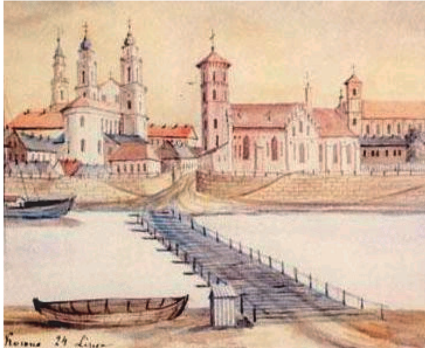
Rys. 3. Napoleon Orda, widok na stare miasto w Kownie ze wzgórza Aleksoty, 1875 rok – fragment [23]