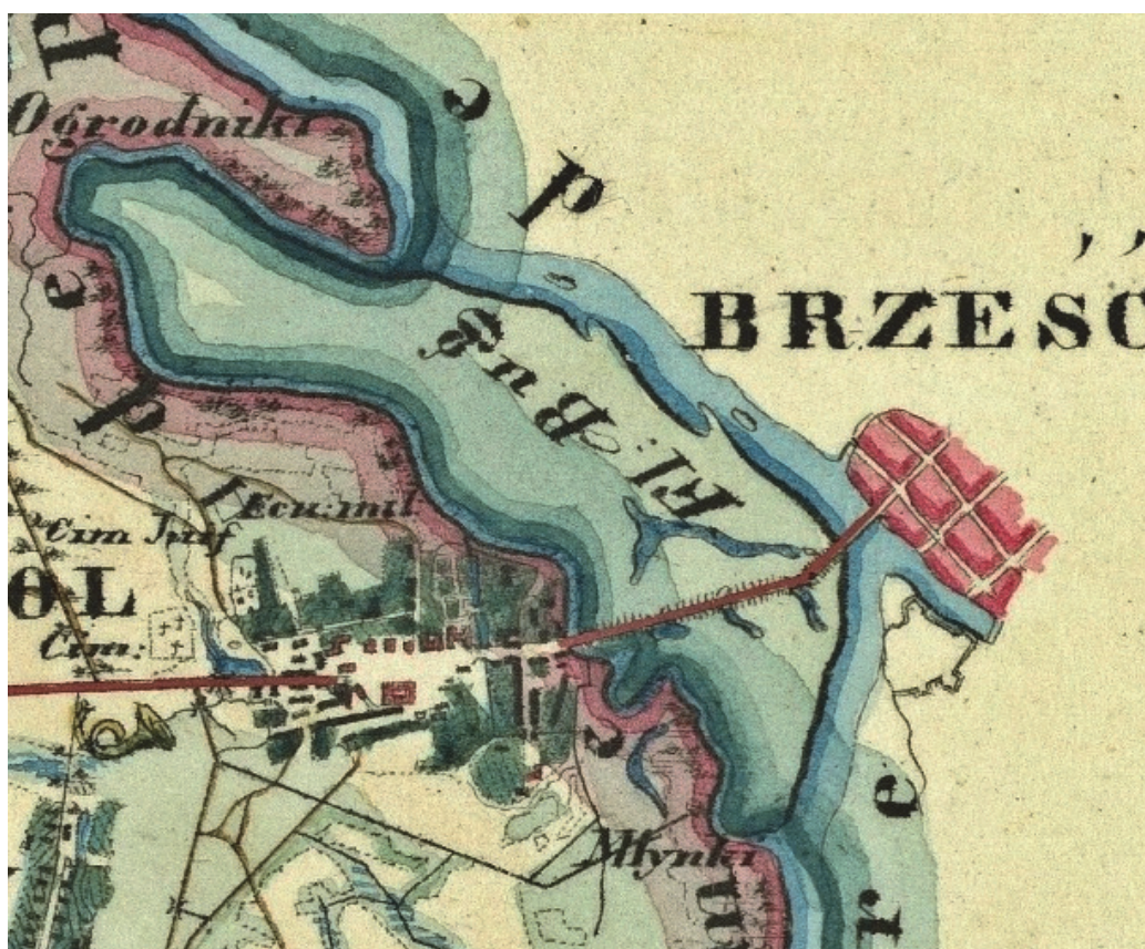
Rys. 4. Obszar pomiędzy Brześciem i Terespołem, okres przed budową twierdzy brzeskiej – fragment [24] Fig. 4. The area between Brest and Terespol, in the times before the construction of the Brest Fortress – a fragment [24]

Warszawska Komisja Rządowa Spraw Wewnętrznych, Duchownych i Oświecenia Publicznego wystąpiła w 1839 roku do Rady Administracyjnej o „wcielenie” mostu na starym Bugu w Terespolu do ogólnego systemu komunikacji drogowej Królestwa Polskiego. Tymczasem utrzymanie tego mostu aż do 1839 roku znajdowało się w ogólnej gestii skarbu państwa. Jednak, jak stwierdzała to Rada Administracyjna 19/31 grudnia 1839 roku, „most pod miastem Terespołem, na odnodze starego Bugu będący, [...] dla starości swojej potrzebuje zupełnego zrestaurowania”. Sprawa była o tyle istotna, iż most terespolski stanowił przedłużenie brzesko-litewskiego traktu bitego i jako taki był niezwykle ważnym punktem w komunikacji krajowej Królestwa Polskiego i Cesarstwa Rosyjskiego [17-18].