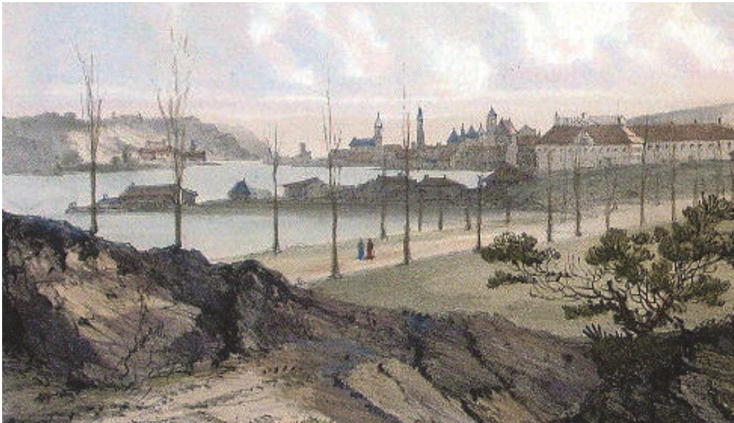
Rys. 1. Barthelemy Lauvergne, Vue de Kovno – fragment, 1840 rok (widoczny brak mostu pomiędzy Aleksotą a starym miastem w Kownie) [22]

Rzeczywiście, z całą pewnością prace nad budową stałego mostu kowieńskiego nie zakończyły się jeszcze przed upływem 1840 roku. Stan na ten rok pokazuje zresztą litografia francuskiego malarza Barthelemy’ego Lauvergne’a, który właśnie w tym czasie podróżował po Cesarstwie Rosyjskim, uwieczniając swoje doznania zarówno w formie obrazów, jak i litografii.