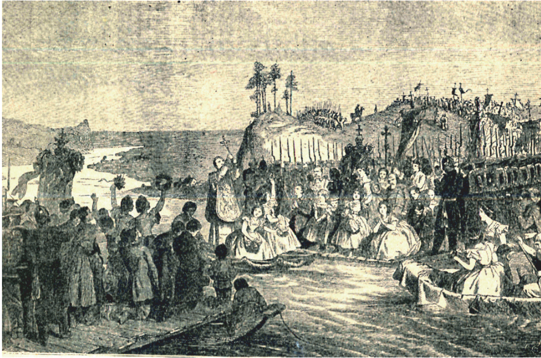
Rys. 2. Manifestacja jedności ludności Korony Królestwa Polskiego i Wielkiego Księstwa Litewskiego na moście Aleksota-Kowno z 12 sierpnia 1861 roku [25]