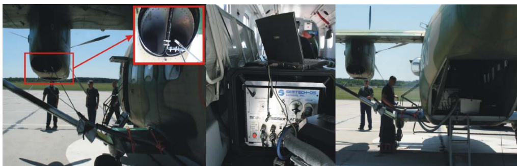
Fot. 3. Miejsce zamocowania sondy poboru spalin i umieszczenia analizatora