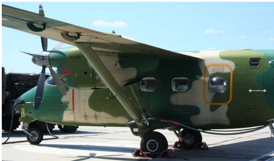
Fot. 1. Silnik TWD-10 B/PZL-10S na samolocie PZL M28 „Bryza”