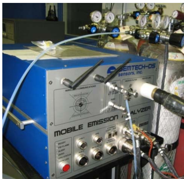
Fot. 2. Widok analizatora spalin

Do pomiarów stężenia związków szkodliwych wykorzystano mobilny analizator do badań toksyczności SEMTECH DS firmy SENSOR (fot. 2.). Analizator ten umożliwiał pomiar stężenia tlenku węgla, dwutlenku węgla, węglowodorów, tlenków azotu oraz tlenu. Gazy spalinowe wprowadzane są do analizatora za pomocą sondy pomiarowej utrzymującej temperaturę 191°C, następnie są filtrowane z cząstek stałych (w przypadku silników ZS) i następuje pomiar stężenia węglowodorów w analizatorze płomieniowo-jonizacyjnym. Następnie spaliny są schładzane do temperatury 4°C i następuje kolejno pomiar stężenia tlenków azotu, tlenku węgla, dwutlenku węgla oraz tlenu [1].