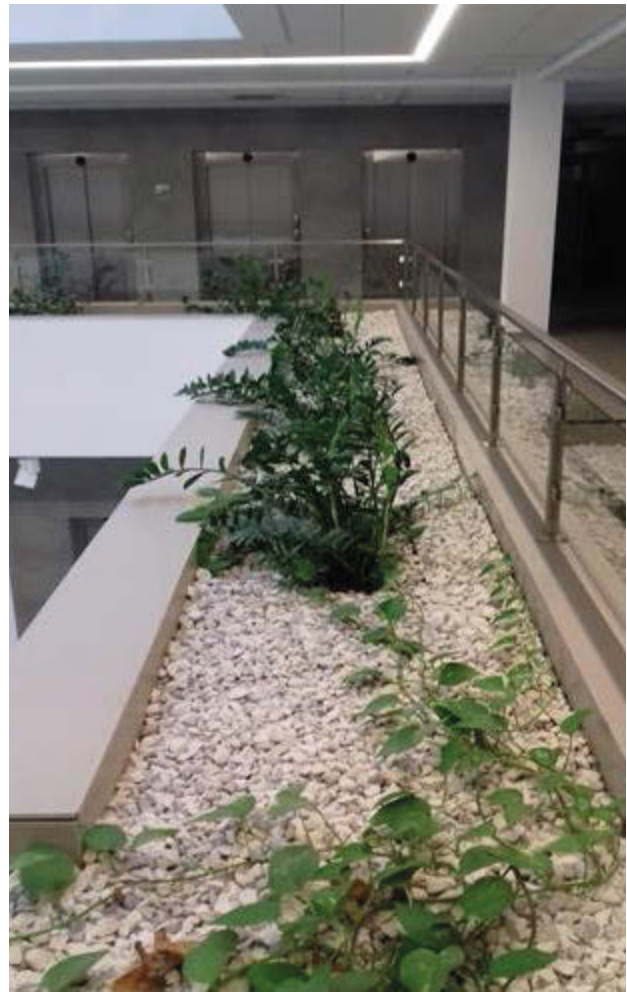
Il. 2. „Żywe rośliny” w atrium budynku Wschodniego Innowacyjnego Centrum Architektury (B4) stanowią skrawek natury w krystalicznie modernistycznym wnętrzu (fot. K. Lenartowicz, 2017).