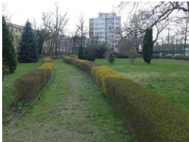
Il. 3. Ogród przy budynku Wydziału Psychologii UW (B5) — spojrzenie w głąb ogrodu. Widok wiosną i jesienią (fot. A. Lasiewicz-Sych, 2013/2015).