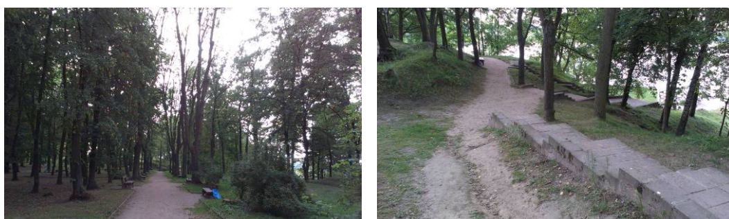
Ryc. 3. Najstarsza część parku, silnie zdegradowana. Fig. 3. The oldest part of the park, heavily degraded.