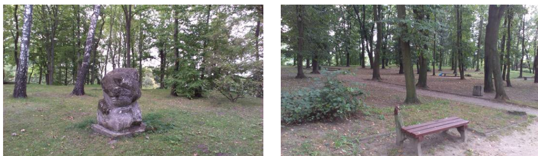
Ryc. 4. Elementy zdewastowane małej architektury. Fig. 4. Elements devastated landscape architecture.