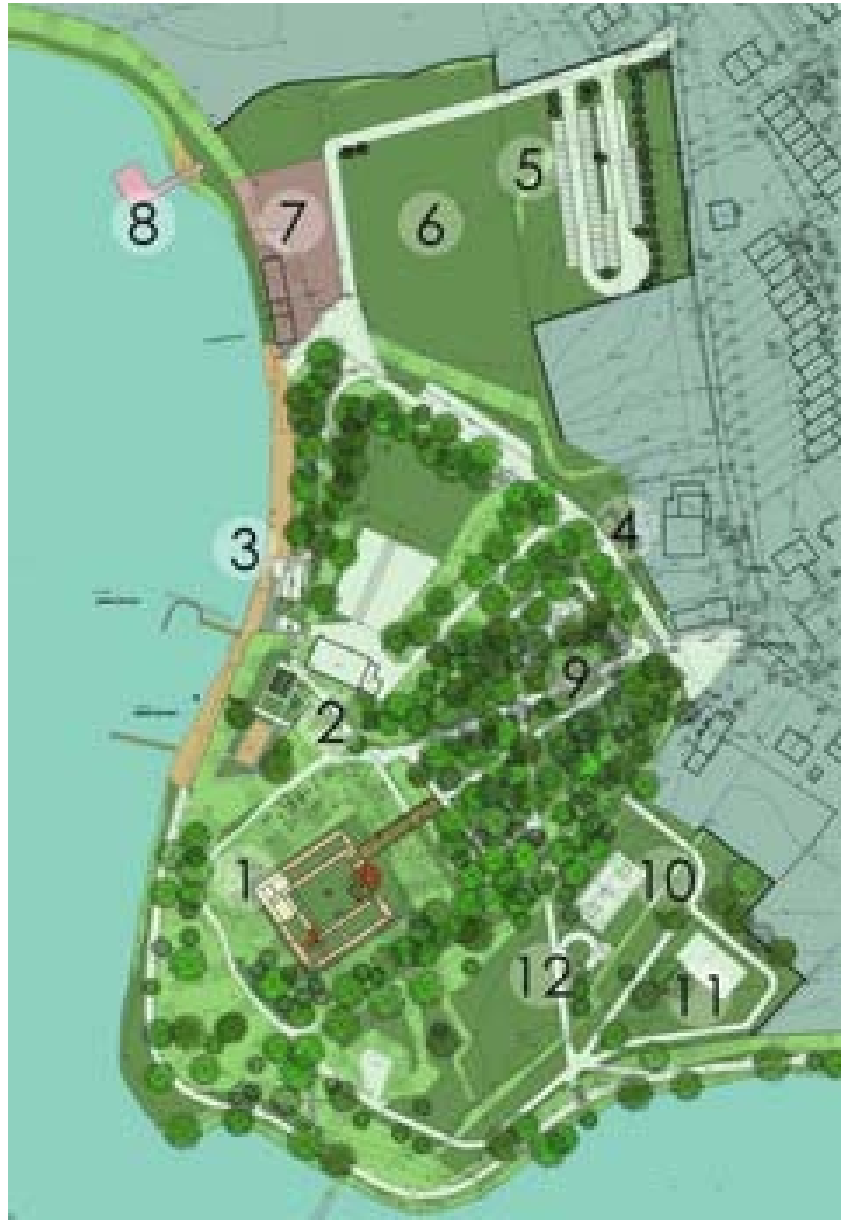
Ryc. 5. Projekt zagospodarowania Góry Zamkowej opracowany na zlecenie władz lokalnych miasta Wąbrzeźno.

Fig. 5. Developed at the request of local authorities Wąbrzeźno Castle Mountain development project.