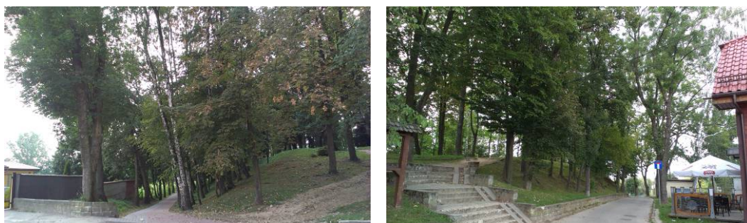
Ryc. 2. Brak wypracowanej głównej strefy wejściowej do parku miejskiego. Fig. 2. None developed the main entrance area to the city park.

mona i Judy Tadeusza, dawny kościół ewangelicki, obecnie kościół rzymskokatolicki pw. Matki Boskiej Królowej Polski, budynek sądu grodzkiego wraz z willą sądową i ogrodem oraz liczne kamienice [7, s. 8–10].