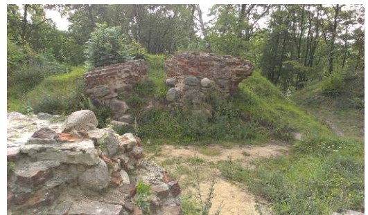
Ryc. 6. Niewyeksponowane ruiny zamku biskupiego, położone na szczycie Góry Zamkowej, stanowiące najciekawszy zabytek miasta.

Fig. 6. Underexposed Episcopal castle ruins, situated on the top of the Castle Hill, which are the most interesting monument of the city.