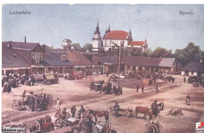
Ryc. 7. Rynek w Lubartowie, w tle kościół św. Anny.

Lubartów położony jest 26 km na północ od Lublina, na Wysoczyźnie Lubartowskiej. Założony został 29 maja 1543 r. przez Piotra Firleja jako Lewartów, nazwany tak od herbu Firlejów – Lewartu. Liczy obecnie około 22 000 mieszkańców i jest nieco w cieniu pobliskiej Kozłówki.