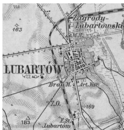
Ryc. 8. Mapa Lubartowa z 1915 r.

Fig. 7. Market square in Lubartów, in the background – the Church of St. Anne.