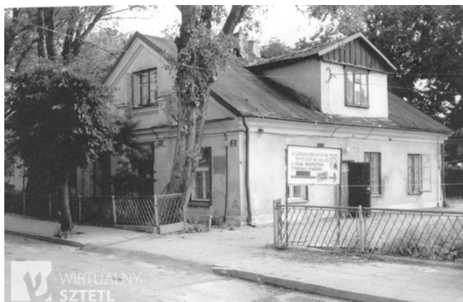
Ryc. 9. Lubartów, dom modlitwy przy ul. Legionów. Fig. 9. Lubartów, house of prayer at Legionów Street.