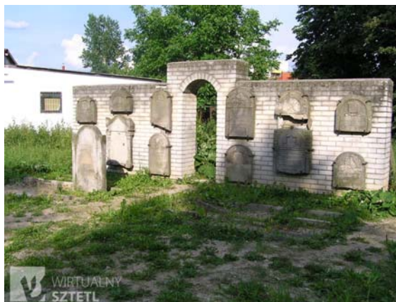
Ryc. 12. Cmentarz żydowski w Lubartowie.

Fig. 11. Exhibition „Conversation – monologue – silence” in Zamość synagogue, August 2013.