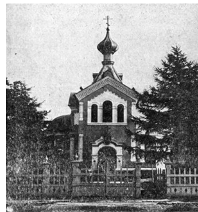
Ryc. 10. Lubartów, cerkiew. Fig. 10. Lubartów, Orthodox church.

W XVI w. działało w Lubartowie gimnazjum ariańskie, znane w całej Rzeczpospolitej; w 1580 r. odbył się w mieście synod braci polskich.