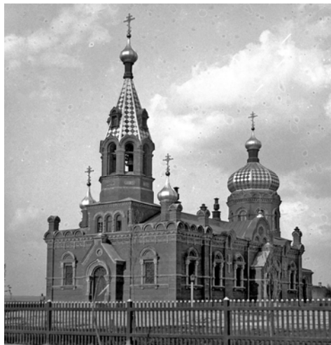
Ryc. 3. Cerkiew prawosławna pw. Przemienienia Pańskiego, zamieniona na kościół garnizonowy pw. św. Michała.

tworząc barwny tygiel. W odróżnieniu od wielu miast Rzeczypospolitej w Zamościu nie zyskał poparcia ruch chasydzki, popularny m.in. w Lublinie.