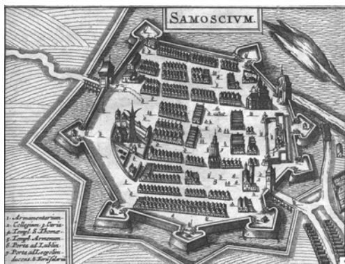
Ryc. 1. Plan Zamościa.

Zamość, spełnione marzenie Jana Zamoyskiego i zrealizowane miasto idealne, położony jest w południowej części województwa lubelskiego. Początki miasta sięgają 1579 r., kiedy to rozpoczęła się budowa miasta; rok później Zamość otrzymał prawa miejskie. Założenie urbanistyczne, czerpiące z renesansowych miast idealnych, zaprojektował Włoch Bernardo Morando.