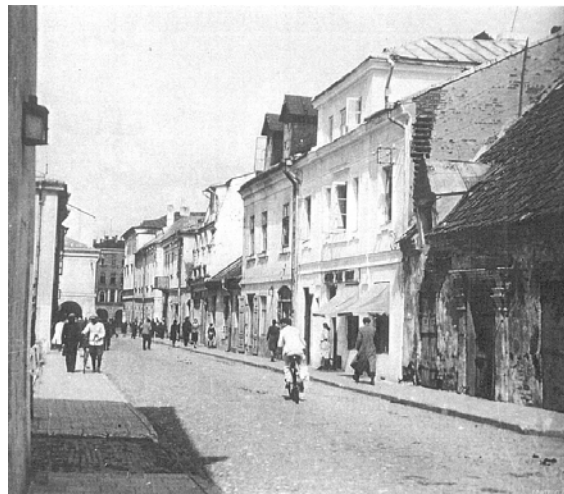
Ryc. 4. Zamość. Ulica Staszica, z prawej strony widoczna karczma Dychtera.

Fig. 3. Orthodox Church of the Transfiguration of the Lord, converted into the garrison church of St. Michael.