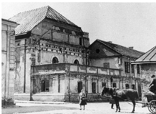
Ryc. 5. Synagoga w Zamościu.

Fig. 4. Zamość. Staszica Street, Dychter inn can be seen on the right.