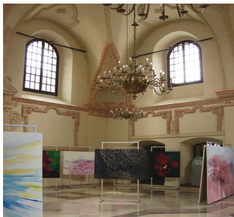
Ryc. 11. Wystawa „Rozmowa – monolog – milczenie” w zamojskiej synagodze, sierpień 2013.

potrzeby przedszkola oraz zboru jednego z wyznań protestanckich – w efekcie zatraciła zupełnie swój charakter. W dawnej mykwie przy ulicy Zamenhofa mieści się obecnie klub muzyczny. W staromiejskiej synagodze funkcjonowała przez wiele lat biblioteka publiczna. Od 2005 r. należy ona do Fundacji Ochrony Dziedzictwa Żydowskiego [5, s.17].