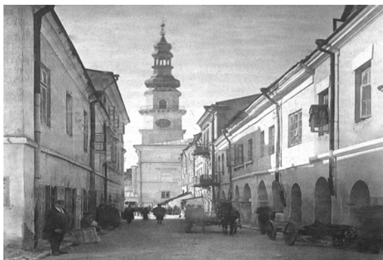
Ryc. 2. Widok na ratusz z ul. Ormiańskiej, lata 20. XX wieku.

Fig. 1. Map of Zamosc.