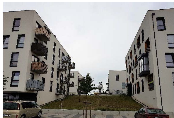
II. 9,10,11,12,13,14. Nowe Żerniki, Wrocław. - fot. J.Gyurkovich – 2018