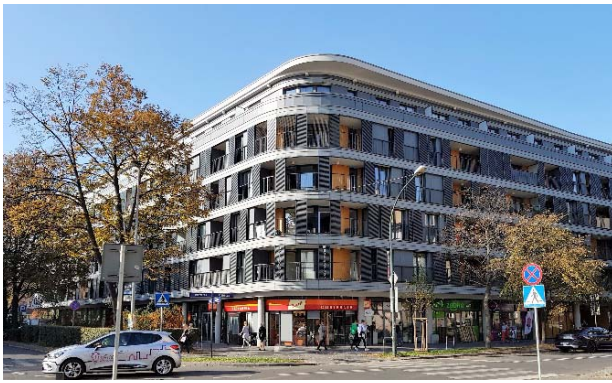
II.7. Masarska 8 Apartamenty – Kraków. - fot. J.Gyurkovich – 2018