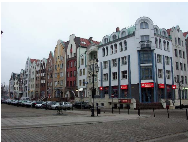
Ill. 1,2 Murowana Goślina. – 2014