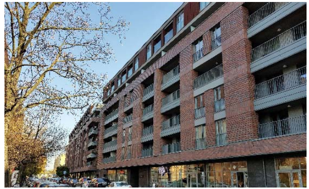
II.8. ATAL Residence, Kraków ul. Nadwiślańska 11. – 2018