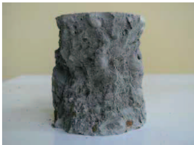
Rys. 12. Próbką betonu po wykonaniu badania wytrzymałości na ściskanie