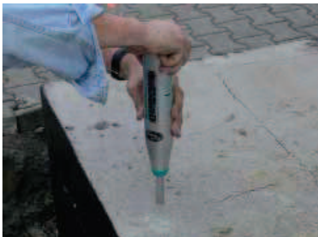
Rys. 13. Badanie nieniszczące młotkiem Schmidta – pomiar liczby odbicia na powierzchni fundamentu betonowego

na powierzchniach poziomych fundamentów mają swoją przyczynę w warunkach dojrzewania betonu – wysoka temperatura otoczenia, niedostateczna pielęgnacja, a także, na co wskazują obniżenia poziomu – charakterystyczne wklęsnięcia powierzchni, prawdopodobnie wynikające ze zbyt dużej ilości wody w mieszance betonowej.