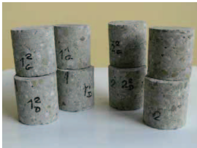
Rys. 11. Sformatowane próbki betonu pobrane z fundamentów, przygotowane do badań wytrzymałości na ściskanie

Jeśli powyższy warunek nie jest spełniony, można posłużyć się innym kryterium, wówczas równocześnie muszą zostać spełnione dwa warunki: