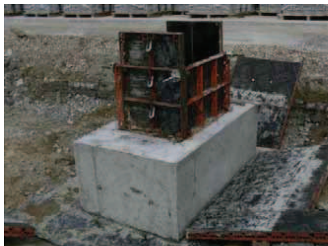
Rys. 8. Częściowo rozszalowany fundament betonowy, pozostawiony bez dalszej pielęgnacji

Na części fundamentów nałożono już izolację bitumiczną, również na powierzchniach poziomych – odsadzki, gdzie występują spękania (rys. 6).