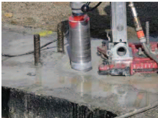
Rys. 9. Wykonywanie odwiertu w fundamencie betonowym w celu pobrania próbek do badań wytrzymałości na ściskanie