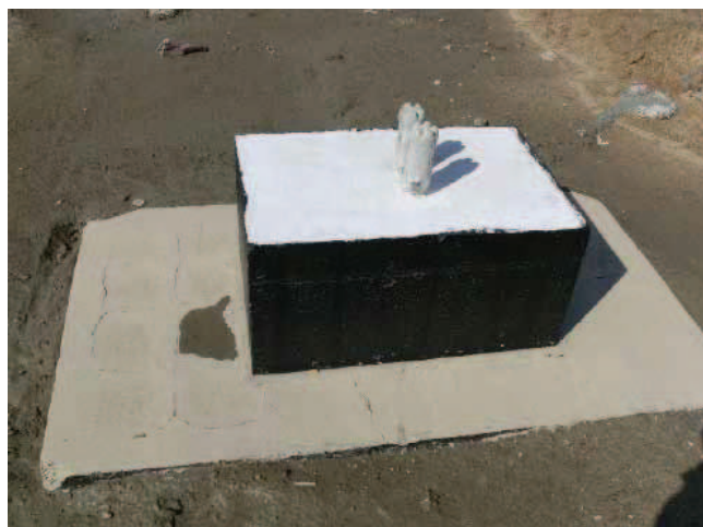
Rys. 4. Rysy widoczne poprzez warstwę mineralnego zabezpieczenia powierzchniowego na odsadce fundamentu betonowego

powierzchni betonu na powierzchniach poziomych fundamentów żelbetowych – powierzchnie górne fundamentów (rys. 1 i 2), a także odsadzki (rys. 3 i 4). Na uwagę zasługują również pęknięcia występujące w bliskim sąsiedztwie kotew stalowych osadzonych w fundamentach (rys. 5).