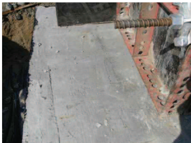
Rys. 3. Widoczne rysy na powierzchni odsadzki fundamentu betonowego

W omawianym przypadku wykonywano żelbetowe stopy fundamentowe pod słupy hali produkcyjno-magazynowej. Betonowanie odbywało się podczas letnich upałów, gdzie temperatura powietrza w ciągu dnia przekraczała 30°C. Podczas wizji lokalnych zaobserwowano liczne spękania