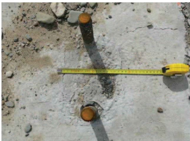
Rys. 5. Widoczne rysy na powierzchni fundamentu betonowego w okolicy kotew stalowych