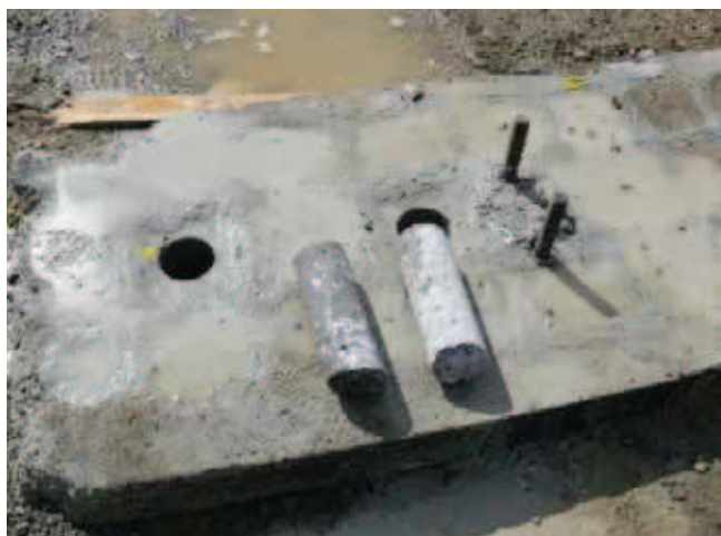
Rys. 10. Widok rdzeni betonowych pobranych z fundamentu

betonu na budowie można przyjąć, że określona w próbie bezpośredniego ściskania wytrzymałość jest na poziomie 0,85 wytrzymałości 28-dniowej, miarodajnej do oszacowania klasy wytrzymałości betonu [1, 2].