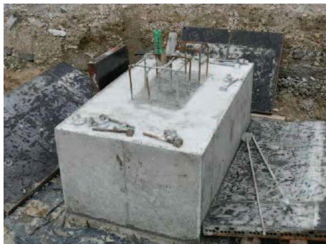
Rys. 7. Fundament betonowy po rozszalowaniu pozostawiony bez dalszej pielęgnacji