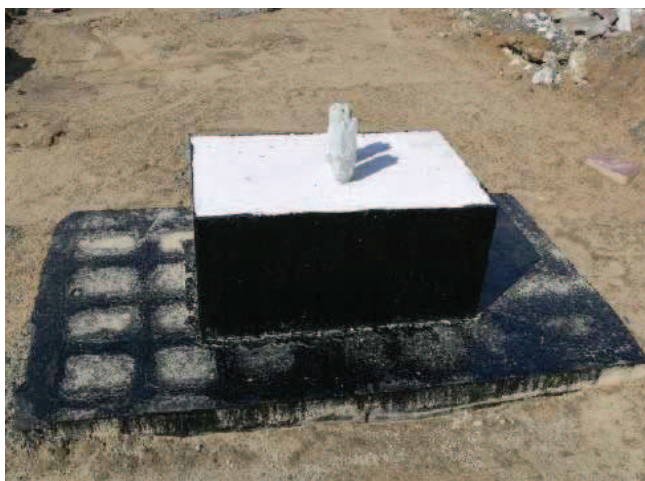
Rys. 6. Rysunek spękań fundamentu betonowego przykryty warstwą bitumicznego zabezpieczenia powierzchniowego