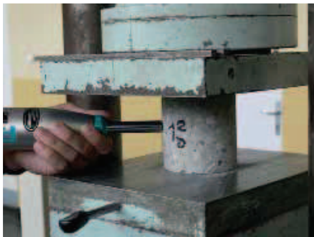
Rys. 14. Pomiar liczby odbicia podczas badania wytrzymałości na ściskanie

Występujące pęknięcia betonu, odzwierciedlające rysunek zbrojenia, wskazują nie tylko na osłabienie struktury samego betonu, ale również na zmniejszenie przyczepności prętów zbrojeniowych do betonu, dotyczy to również stalowych kotew. Jest to wynikiem wysokiej temperatury otoczenia podczas betonowania i pierwszej fazy dojrzewania betonu, co w połączeniu z niewystarczającą pielęgnacją oraz