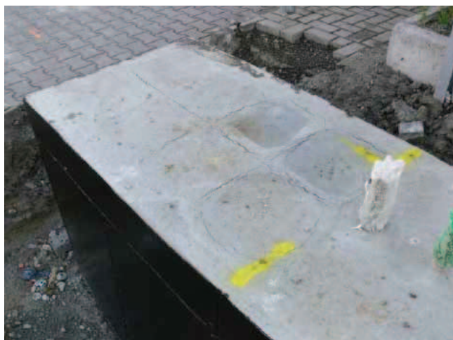
Rys. 1. Widok fundamentu z wyraźnymi rysami na powierzchni górnej

Minimalny, zalecany czas pielęgnacji świeżego betonu, w zależności od rodzaju cementu i warunków atmosferycznych, podany został w tabeli 1.