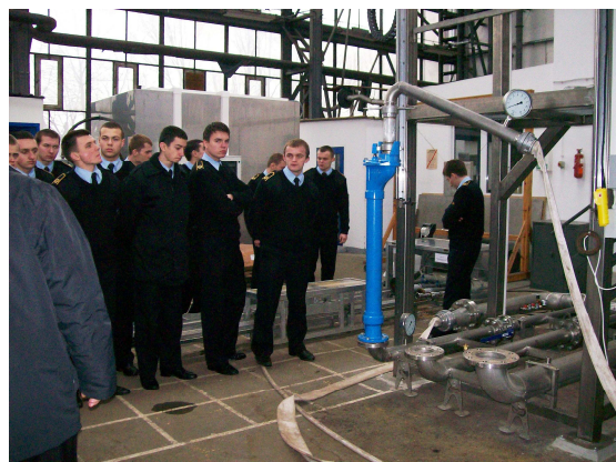
Fot. 19 i 20 Warsztaty dla kadetów szkół pożarniczych PSP.