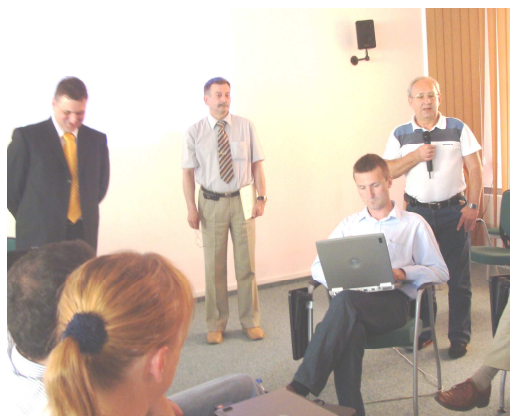
Fot. 7 i 8 Uczestnicy szkolenia "Obronność i bezpieczeństwo państwa".