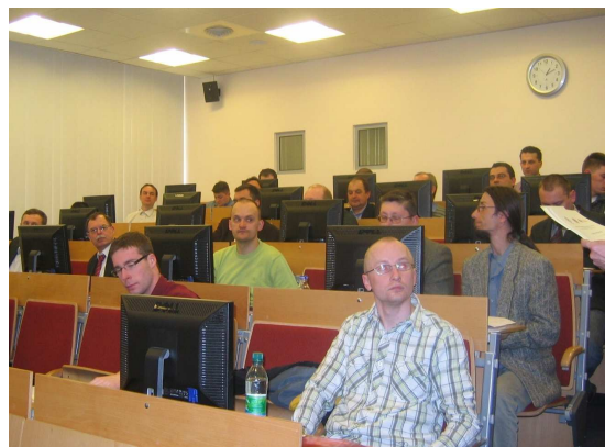
Fot. 3 i 4 Szkolenie dla pracowników merytorycznych Gminnych Centrów Zarządzania Kryzysowego pn. „System zarządzania informacją GCZK”.