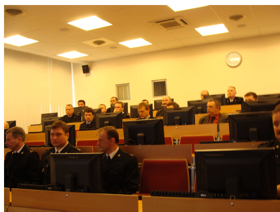
Fot. 11 i 12 Posiedzenia Komisji i Zespołów powołanych przez Komendanta Głównego Państwowej Straży Pożarnej.