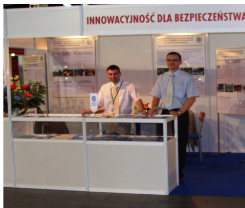
Fot. 21i 22 Stoisko wystawiennicze CNBOP „EDURA 2008”.