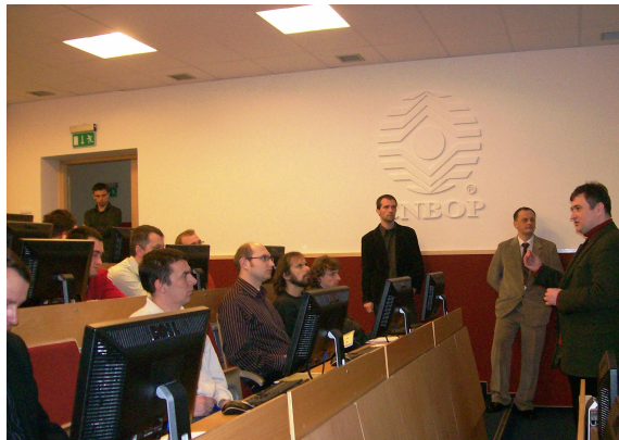
Fot. 5 i 6 Szkolenie dla pracowników technicznych /informatyków/ Gminnych Centrów Zarządzania Kryzysowego nt.: „Kreator Planu Reagowania Kryzysowego”.