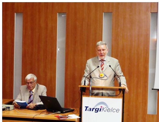
Fot. 1 i 2 Konferencję Naukowo - Techniczną nt.: „Wybrane instrumenty finansowe w zarządzaniu bezpieczeństwem na poziomie lokalnym i regionalnym”.