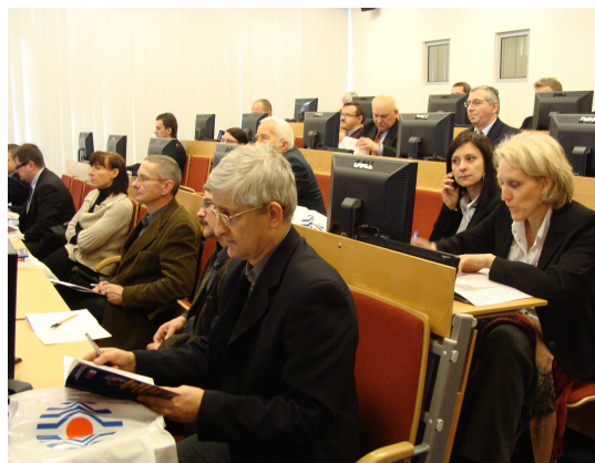
Fot. 9 i 10 Narada szkoleniowa dla osób zatrudnionych na stanowiskach do spraw obronnych w Wydziałach Bezpieczeństwa i Zarządzania Kryzysowego z zakresu obrony cywilnej, ochrony ludności i zarządzania kryzysowego.