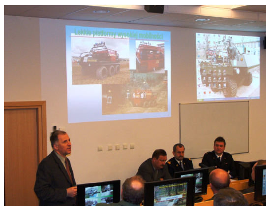
Fot. 13 i 14 Warsztat : „Możliwości zastosowania nowoczesnej, polskiej konstrukcji bezzałogowego pojazdu w obszarze ratownictwa, ochrony przeciwpożarowej i ochrony ludności”.

Ponadto w ramach szkoleń w zakresie zarządzania kryzysowego i ochrony ludności CNBOP zorganizowało: