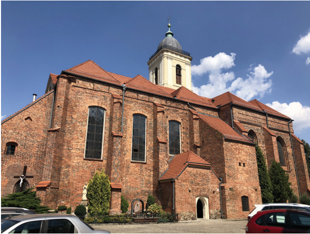
Il. 1. Zielona Góra, konkatedra pw. św. Jadwigi Śląskiej, widok ogólny od południowego zachodu