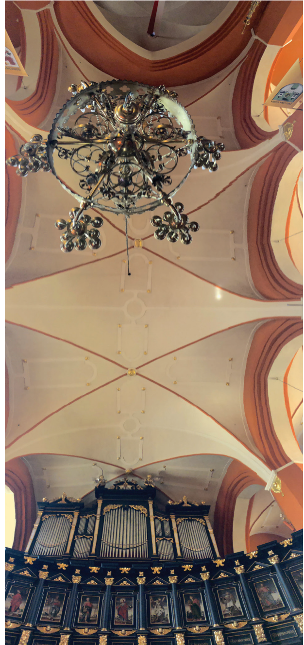
Il. 4. Zielona Góra, konkatedra pw. św. Jadwigi Śląskiej, sklepienie nawy głównej

Podział poziomów wieży wyznaczają drewniane stropy. Na pierwszym, nad zakrystią znajduje się pomieszczenie