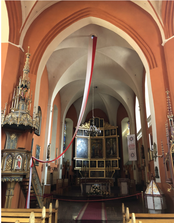
Il. 3. Zielona Góra, konkatedra pw. św. Jadwigi Śląskiej, widok wnętrza prezbiterium