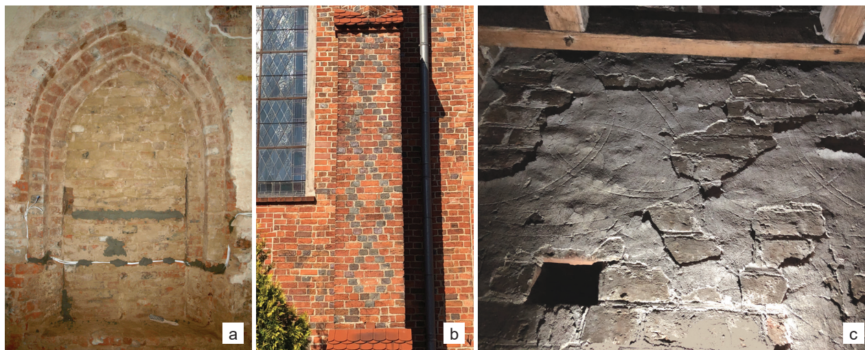
Il. 9. Zielona Góra, konkatedra pw. św. Jadwigi Śląskiej: a) portal w kaplicy Ogrójcowej (fot. P. Celecka); b) przypora z dekoracją rombowa z ciemniej wypalonych główek (fot. A. Legendziewicz); c) fragment dekoracji blendy elewacji zachodniej ze śladami dekoracji rytowanej (fot. A. Legendziewicz)