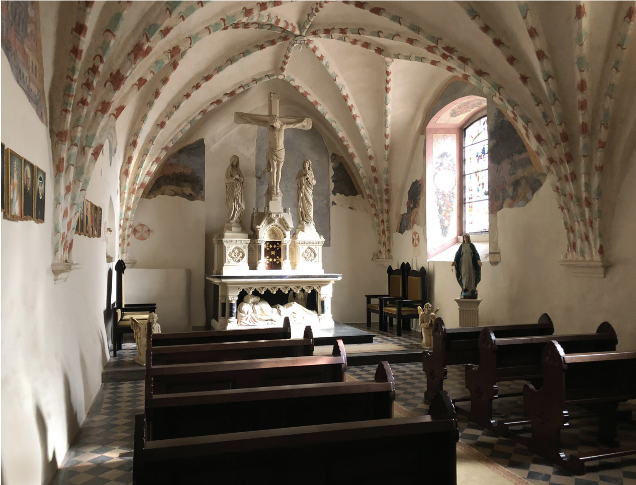
Il. 10. Zielona Góra, konkatedra pw. św. Jadwigi Śląskiej, kaplica Ogrójcowa, wnętrze