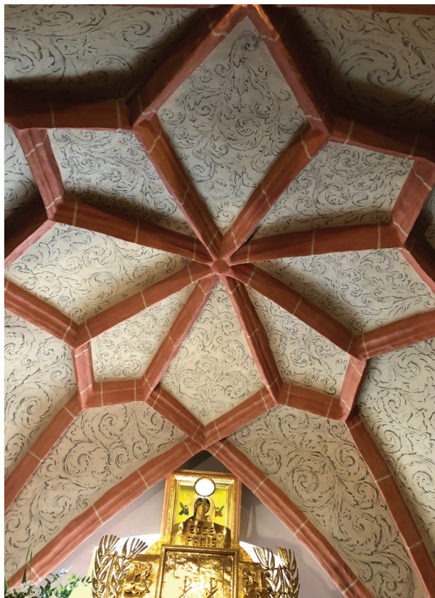
Il. 6. Zielona Góra, konkatedra pw. św. Jadwigi Śląskiej, kaplica Chrzcielna, sklepienie