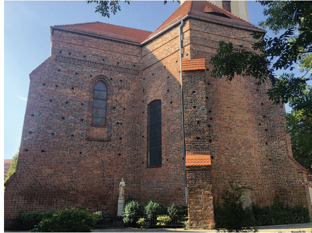
Il. 2. Zielona Góra, konkatedra pw. św. Jadwigi Śląskiej, widok ogólny od wschodu