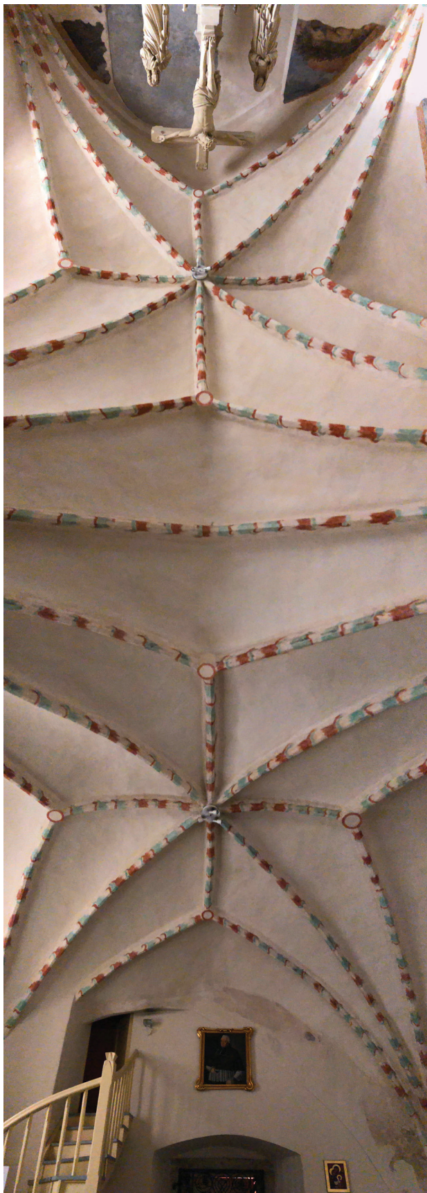
Il. 5. Zielona Góra, konkatedra pw. św. Jadwigi Śląskiej, kaplica Ogrójcowa, sklepienie