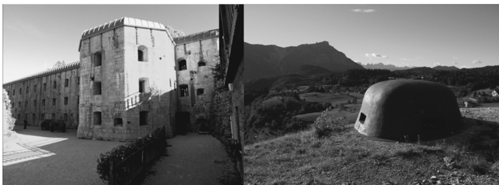
Fot. 1. Z lewej – fort Belvedere- Gschwendt z prawej widok z fortu na Becco di Filadonna i Dolomiti di Brenta

że ilość współczesnych elementów powinna zostać ograniczona do niezbędnego minimum, a największa wartość obiektu jako budowli tkwi w możliwości odczytania jego historii ze struktury – zachowano, więc większość śladów zniszczeń i modyfikacji, unikając dosłownej rekonstrukcji. Ekspozycja charakteryzuje się surowością, oszczędnym i starannym doborem przedmiotów oraz brakiem zbędnych dekoracji i patosu. W założeniu ma więcej dawać do myślenia niż mówić. Muzeum jest dostępne dla niepełnosprawnych, a fundacja współpracuje z lokalnymi szkołami w prowadzeniu lekcji historii dla uczniów. Fort nie jest izolowaną wyspą w morzu innych atrakcji – znajduje się na przebiegu trzech różnorodnych szlaków: Sentiero della Pace (międzynarodowy szlak pokoju biegnący przez całe Dolomity), Skitour dei Forti (szlak dla narciarzy biegowych i turystycznych) oraz Fortezze Bike Tour (rowerowa pętla o długości 100 km). Podążanie tymi szlakami daje możliwość podziwiania piękna krajobrazu i poruszania się po śladach Wielkiej Wojny od fortu do fortu. Muzeum promuje się w biurach turystycznych w całym Trentino oraz współpracuje ze słynnym Museo della Guerra w Rovereto i izbą pamięci w Lusernie.