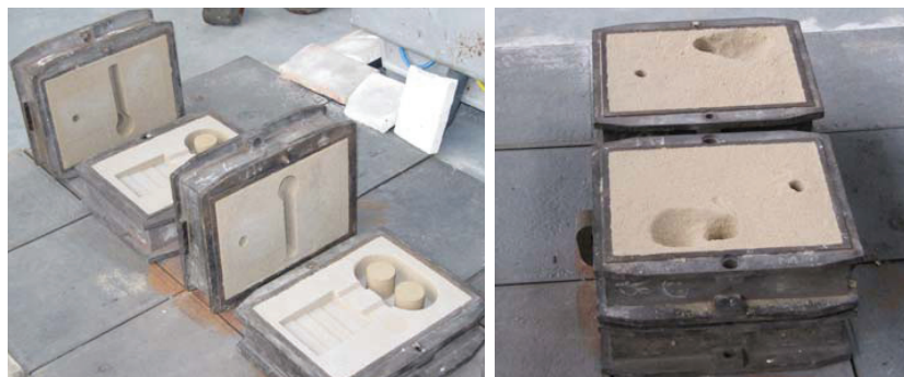
Rys. 1. Formy testowe

Test moulds (Fig. 1) had the following dimensions 320 x 250 x 100/100 mm.