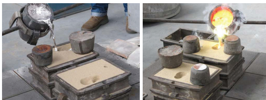
Rys. 2. Zalewanie form testowych