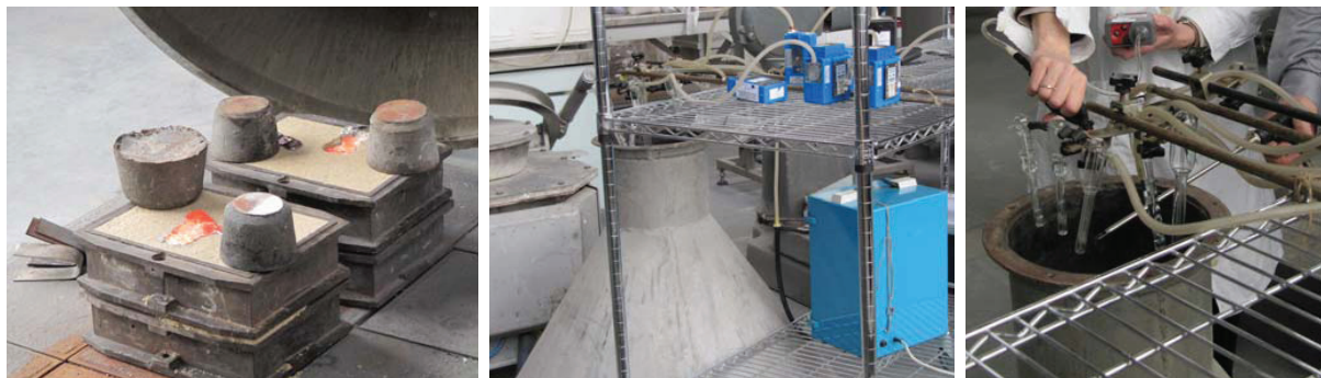
Rys. 3. Stanowisko badawcze do badań ekologicznych

The method for collecting gaseous pollution at the research stand is presented in photos below (Fig. 3). A prepared mould was poured with liquid metal, and immediately after this procedure was finished the mould was covered with a prepared protective cone (hood).