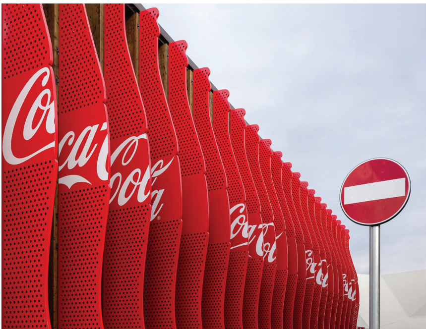
Fot. 3. Pawilon koncernu Coca-Cola na EXPO 2015 w Mediolanie; źródło: [17]