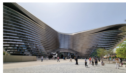
Fot. 8. Alif. The Mobility Pavilion; źródło: fot. autora