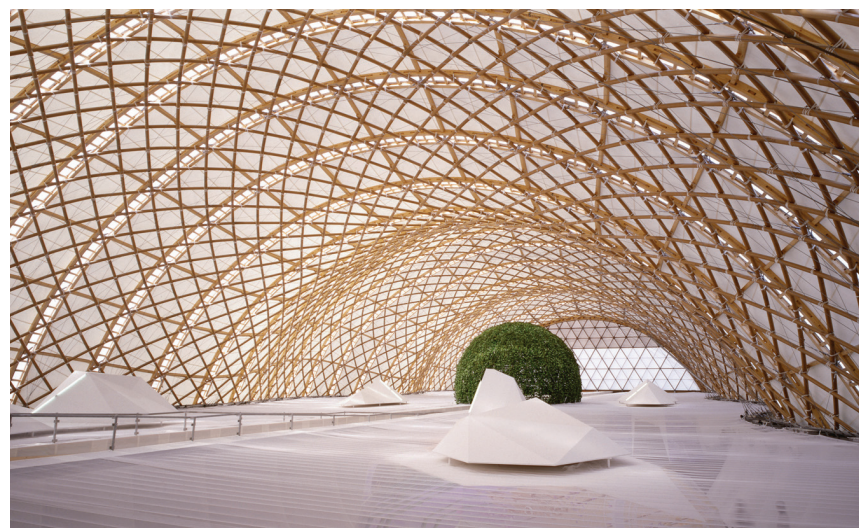
Fot. 2. Pawilon Japonii na EXPO 2000 w Hanowerze; źródło: [16]