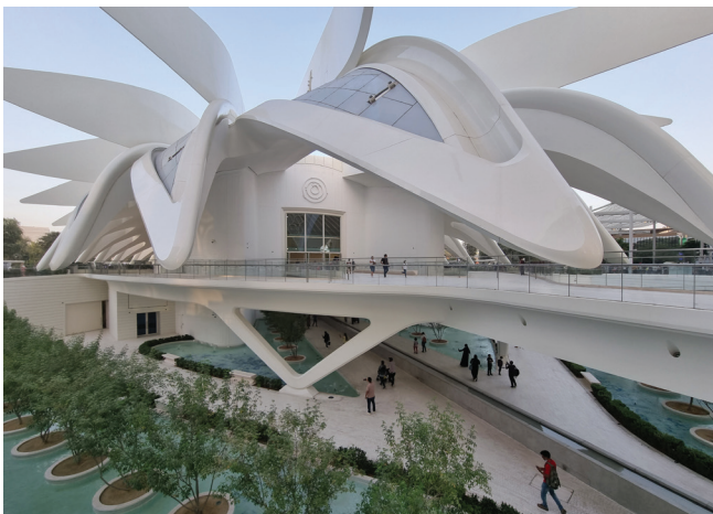
Fot. 6–7. Pawilon UAE, EXPO w Dubaju

względu na zbyt małą kwotę przewidzianą w budżecie Węgier i niepowodzenie akcji marketingowej. Wydatki organizatora miały wynieść blisko miliard dolarów, tymczasem budżet państwa przewidywał kwotę nieco ponad 300 milionów [14]. W 2004 roku EXPO miało się odbyć w Saint-Denis. Podobnie jak w przypadku Węgier rząd francuski został zmuszony do odwołania wystawy. Aby uniknąć podobnych problemów, Międzynarodowe Biuro Wystaw Światowych coraz częściej decyduje się na przyznawanie prawa organizacji EXPO krajom niedemokratycznym. Wystawa w roku 2016 odbyła się w tureckiej Antalyi, w 2017 w Astanie (przemianowanej wkrótce potem ku czci prezydenta Kazachstanu Nursułtana Nazarbajewa na Nur-Sułtan), a w 2020 w Dubaju w Zjednoczonych Emiratach Arabskich (UAE).