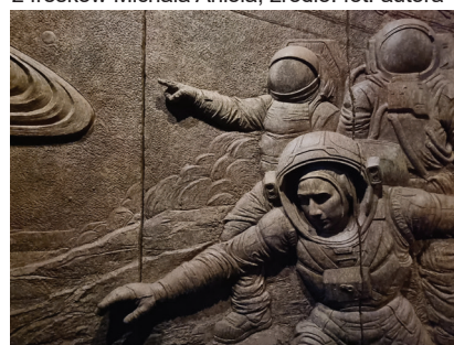
Fot. 11. Alif. Kosmonauta w drodze na Saturna. Historia ludzkiej mobilności