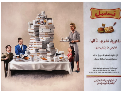
Fot. 13. Terra. Krytyka konsumpcjonizmu, postacie wystylizowane na amerykańską reklamę ubiegłego wieku; źródło: fot. autora