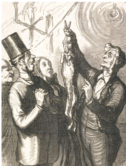
Rys. 2. Wspomnienia z Wystawy Powszechnej, autor ryciny Maurand Charles, data powstania 1851/1879 [9]