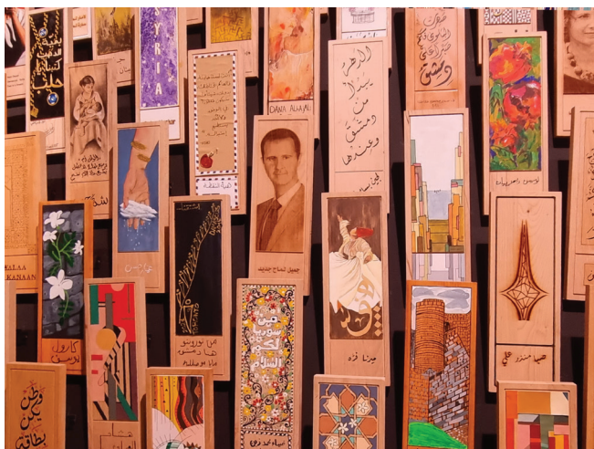
Fot. 4. Prezydent Baszszar al-Asad w jednej z części ekspozycji pawilonu syryjskiego