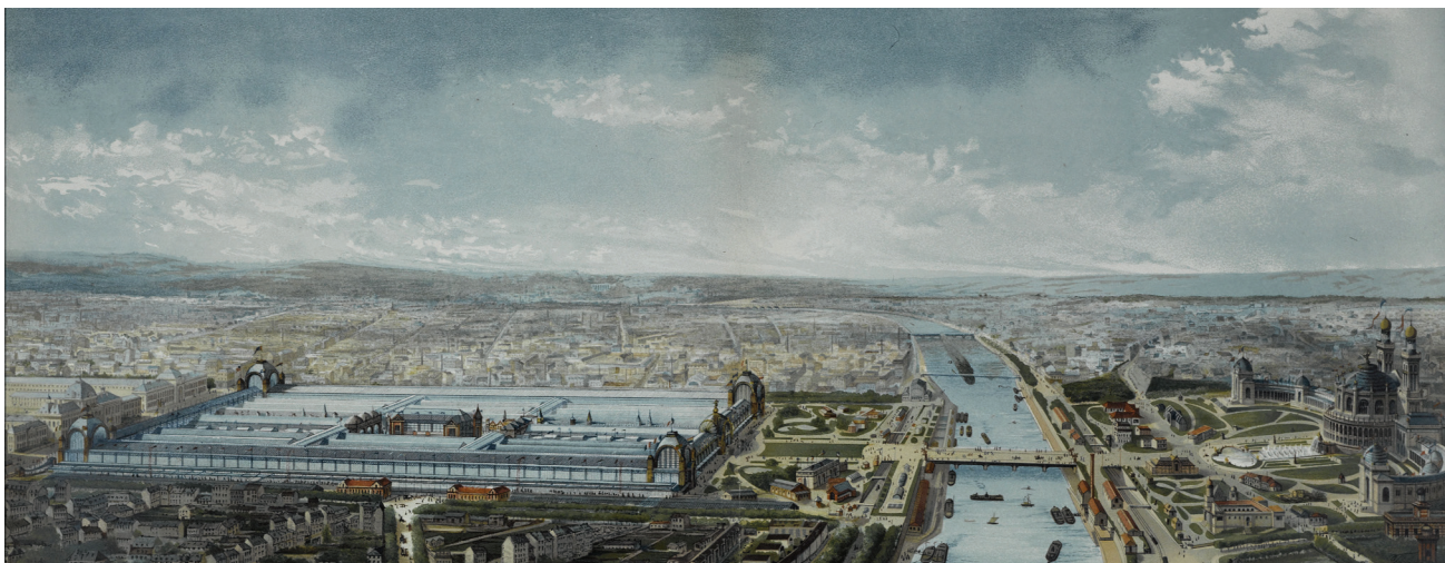
Rys. 1. Panorama Wystawy Powszechnej z 1873 r., pierwszej wystawy, na której miała miejsce budowa „pałaców” narodowych; źródło: [8]