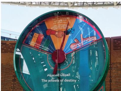
Fot. 15. Terra. Zabawa edukacyjna „koło przeznaczenia”; źródło: fot. autora

tości narodu, jego odporności i bezkresnej przyszłości” [23]. Sokół – godło i symbol narodowy – był jednocześnie szlachetną rozrywką elit arabskich będącą ważnym „narzędziem politycznym”. Wykorzystał ją Zayed bin Sultan Al Nahyana do nawiązania dialogu między rządzącymi grupami plemiennymi i utworzenia obecnej federacji UAE. Pawilon zainspirowany sokolem był pełen treści stanowiących „miękką” propagandę systemu społeczno-politycznego Emiratów. Nie sposób nie przyznać, że zaprojektowany przez Santiago Calatravę mobilny obiekt stanowił