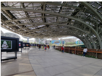
Fot. 14. Terra. Pasaż nad częścią podziemną