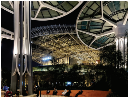
Fot. 12. Terra – pawilon ziemi