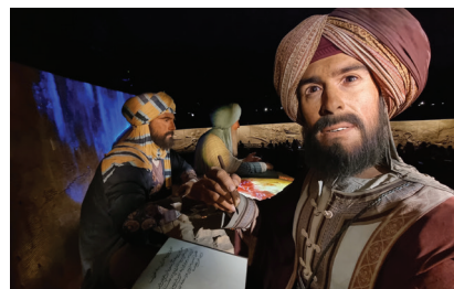
Fot. 9. Alif. Fragment ekspozycji z arabskimi pionierami mobilności, w tle 52-metrowej długości płaskorzeźba przedstawiająca historię ludzkiej mobilności