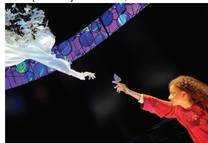
Fot. 10. Alif. W tradycji islamu białe motyle symbolizują wielkie zmiany, tu: w konfiguracji nawiązującej do „Stworzenia Adama” z fresków Michała Anioła