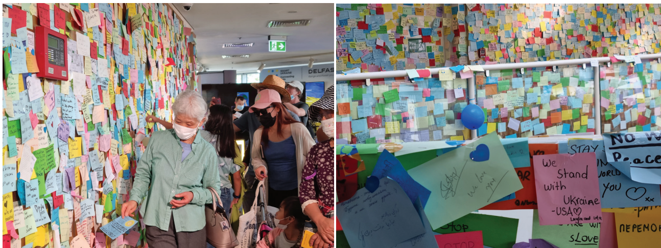
Fot. 16–17. Wnętrze pawilonu Ukrainy, gesty solidarności pokrywające wnętrze ekspozycji

trwania EXPO wizytujący nakleili na ścianach wewnętrznych pawilonu Ukrainy dziesiątki tysięcy fiszek z odręcznymi wyrazami wsparcia, współczucia dla ofiar i oburzenia rosyjską agresją. Ten samoistny akt „sztuki społecznej” [30] potępiający wojnę, autorytaryzm i śmierć ofiar establishmentu pokrył całe wnętrze pawilonu, świadcząc o tym, że światowe wystawy mają jeszcze jakikolwiek sens poza merkantylnym i politycznym.