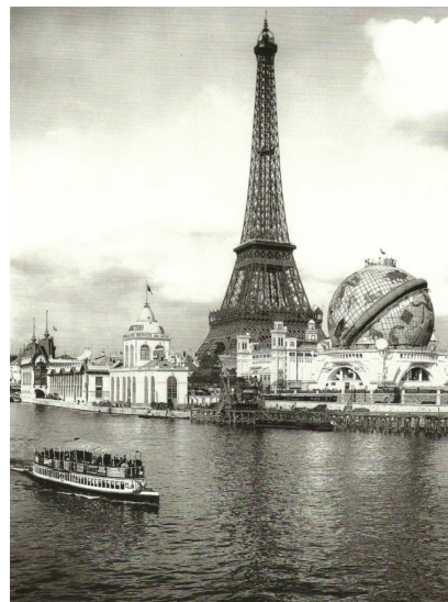
Fot. 1. Sześćdziesięciometrowy model kosmosu na tle wieży Eiffla. Wystawa światowa w Paryżu w 1900 roku