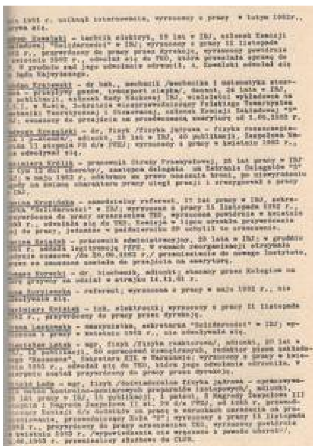
Rys. 3. Fragment (str. nr 4) listy represjonowanych pracowników IBJ Fig. 3. Fragment (page nr 4) of the list of the names of repressed workers of INR

Lista pracowników IBJ pozbawionych wolności na dłużej niż 48 godzin, ukaranych grzywnami, jak również pracowników wyrzuconych z pracy z przyczyn politycznych obejmuje 88 nazwisk. W spisie podanym w cytowanym raporcie „Rewolucja Kulturalna w IBJ” nie uwzględniono 12 docentów, którzy nie dostali wprawdzie wy mówień, jednakże z przyczyn politycznych do listopada 1983 r. nie otrzymali angaży do nowych instytutów. Lista nie obejmuje także osób, których mieszkania były rewidowane, osób przesłuchiwanym, osób którym uniemożliwiono wyjazdy zagraniczne, których szantażowano, pozbawiono stanowiska kierowniczego, udzielono nagany.