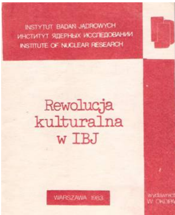
Rys. 1. Okładka raportu pod tytułem „Rewolucja kulturalna w IBJ” Fig. 1. The cover of the historical report “Cultural revolution in INR”

Pierwsze źródło to raport pod tytułem „Rewolucja kulturalna w IBJ”, wydanie II. Na okładce i stronie tytułowej tej publikacji (zob. rysunek poniżej) podano datę 1983 r. Poniżej przedmowy do II wydania napisano: Warszawa, marzec 1984 r. Wydawcą jest Wydawnictwo „W okopach”.