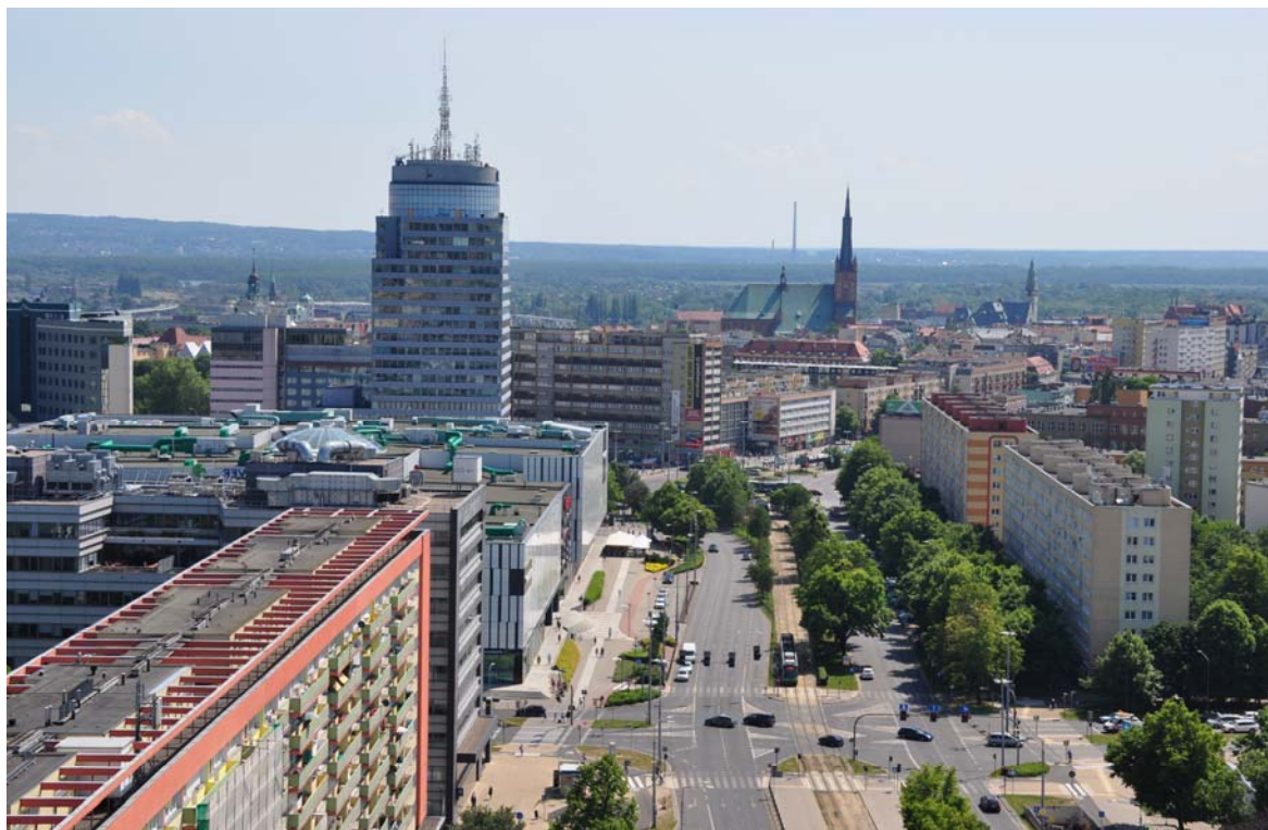
Ryc. 4. Widok ul. Wyzwolenia w Szczecinie, CH Galaxy, budynku biurowego PAZIM, Katedry św. Jakuba, z perspektywy realizowanego budynku wysokościowego Hanza Tower w Szczecinie. 2019.

It means, that however the responsibility in decision-making seems to belong to different institutions and person, the crucial person, which can give the most important incentives and undertake the strategic decisions for the development of the city, remains the city mayor or the president.