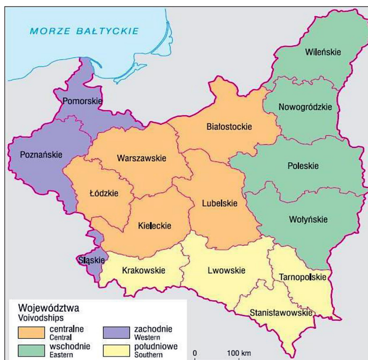
Rys. 1. Polska 1919–1939 – podział na grupy województw

W roku 1925 wydano rozporządzenie Ministra Reform Rolnych z dnia 13 lutego 1925 r. o stosowaniu instrukcji technicznej do wykonywania prac pomiarowych, związanych z przebudową ustroju rolnego (Dz.U. Nr 29, poz. 205). W latach 1919–1939 scalono 5 422 329 ha gruntów (tab. 1). Najwięcej gruntów scalono w województwach: (rys. 1) białostockim 1 144 482 ha, wołyńskim 809 151 ha, nowogródzkim 703 548 ha, wileńskim 615 506 ha, poleskim 609 800 ha, lubel-