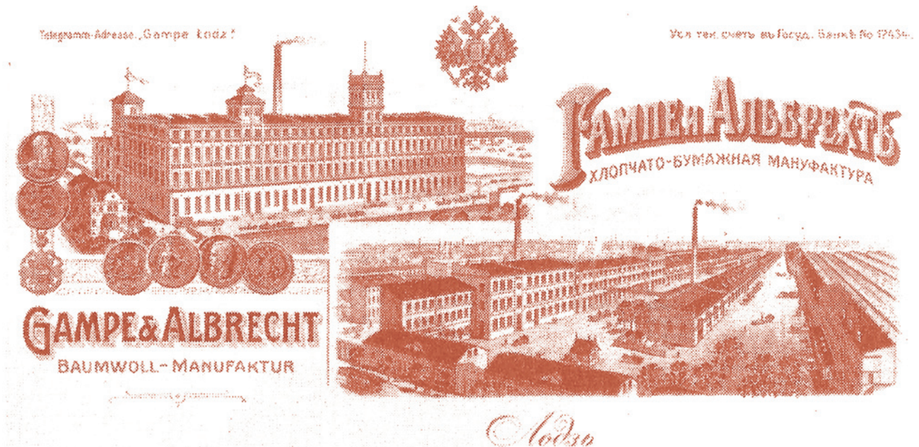
Ryc. 5. Winieta Zakładów Gampe&Albrecht; źródło: nagłówek papeterii zakładów z przełomu XIX i XX wieku Fig. 5. The Gampe&Albrecht factory; source: The company's letterhead from the turn of XIX and XX wieku.