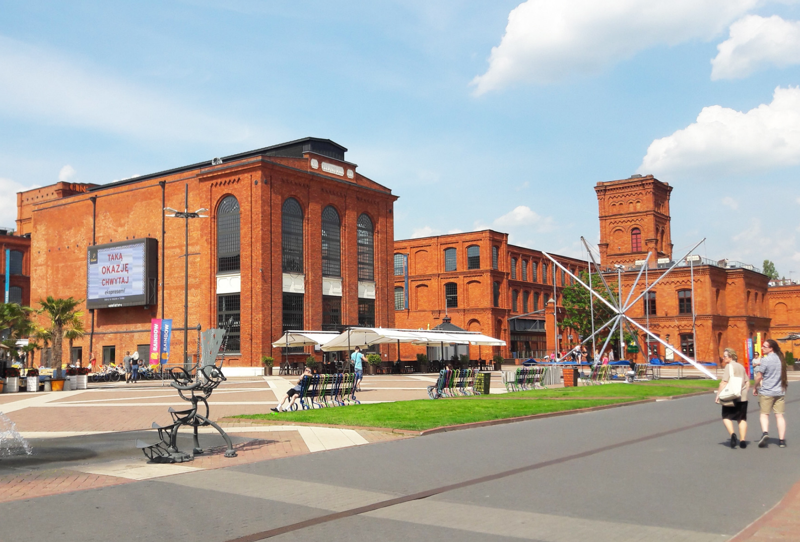
Ryc. 2. Działanie wewnętrzne – rynek Manufaktury; fot.: autorka Fig. 2. Manufaktura's main courtyard; photo: by the author