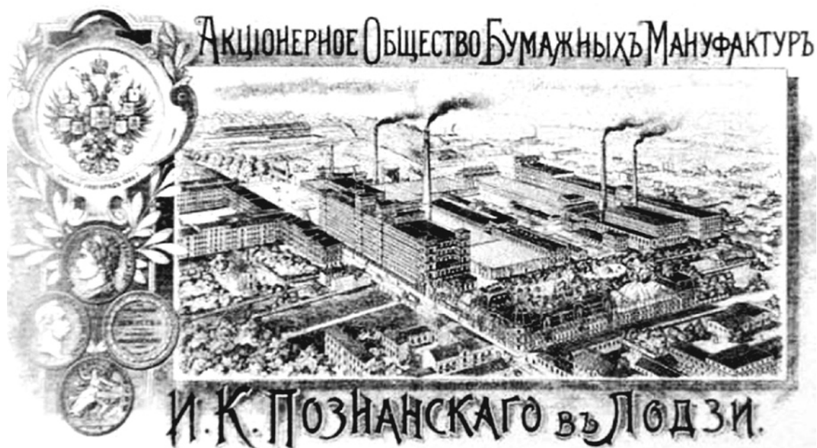
Ryc. 1. Fabryka Poznańskiego na litografii z 1899 roku