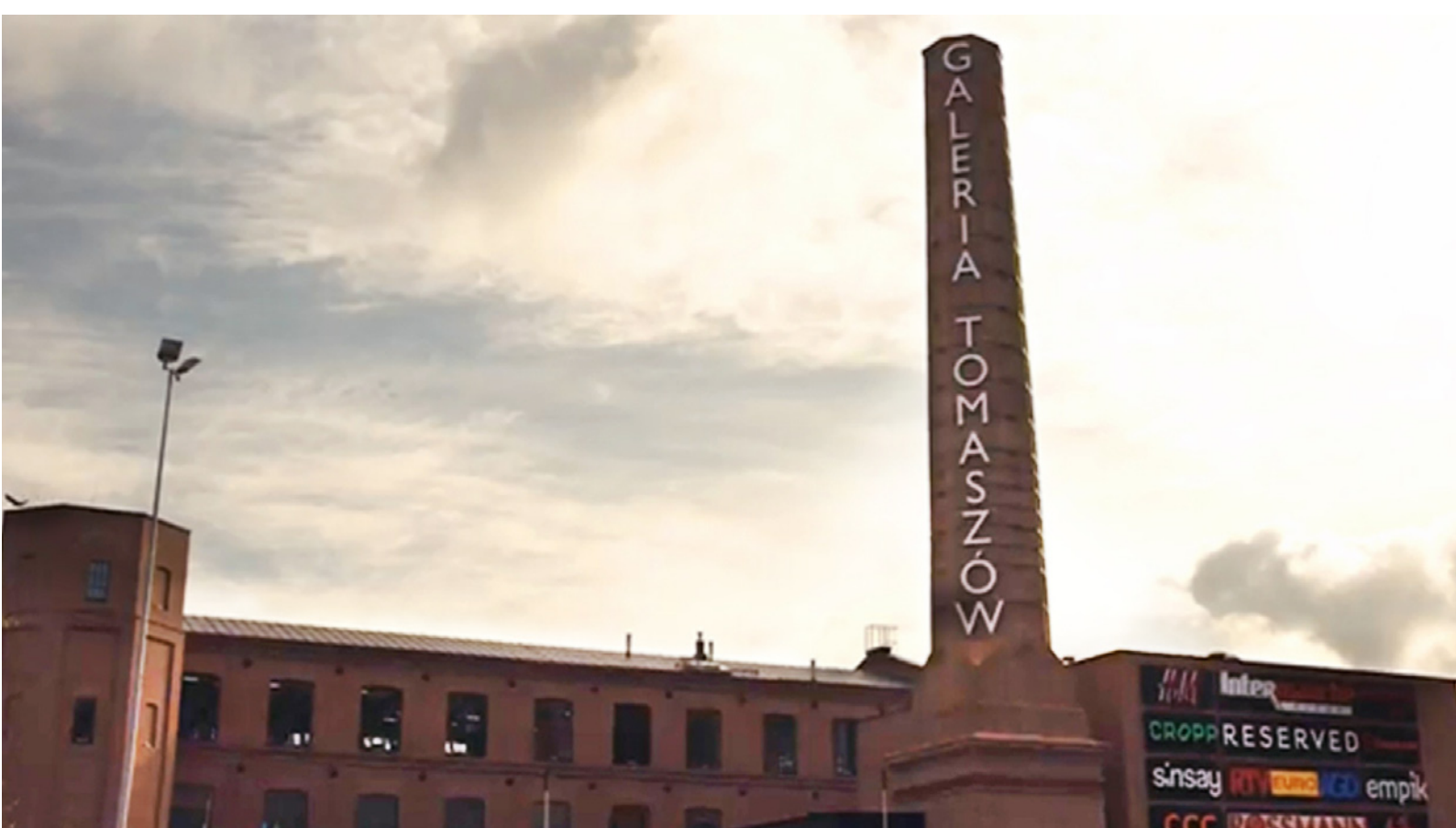
Ryc. 14. Galeria Tomaszów w 2017 roku Fig. 14. Galeria Tomaszów mall in 2017