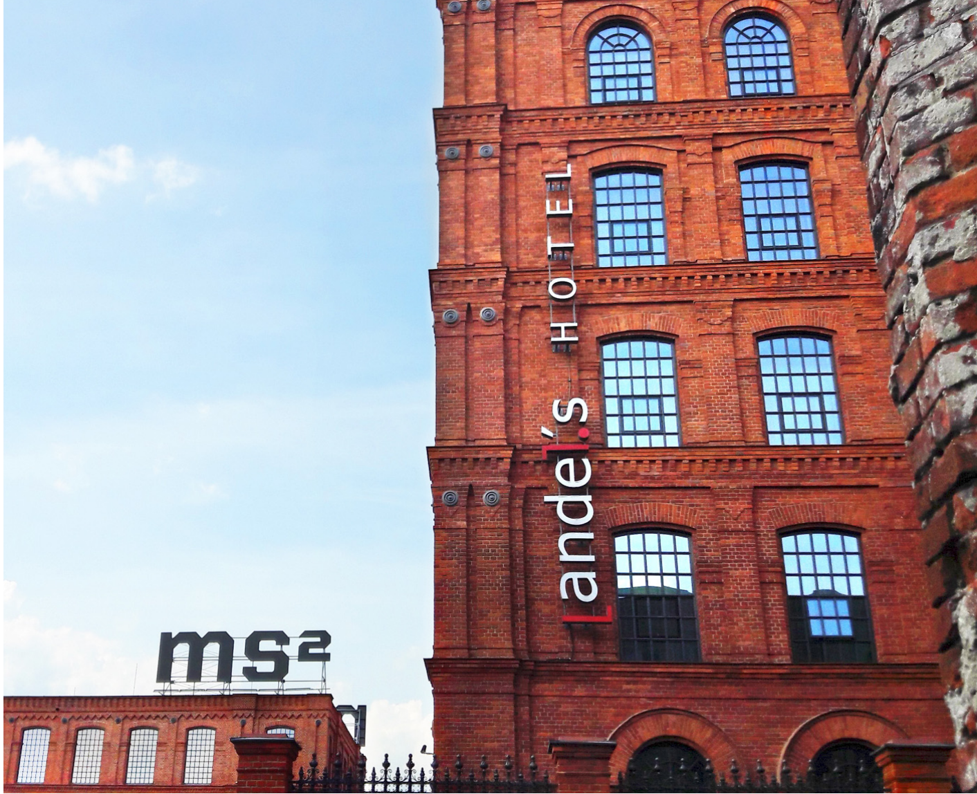
Ryc. 4. Muzeum Sztuki ms2 w Tkalni Wysokiej i Anel's Hotel w przędzalni przy ul. Ogrodowej; fot. autorka