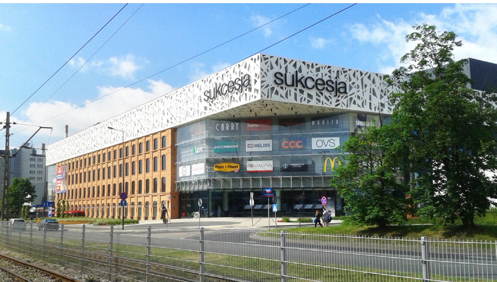
Ryc. 9. Galeria handlowa „Sukcesja” – widok od strony północno-wschodniej; fot.: autorka Fig. 9. Shopping centre „Sukcesja” – view from the north-east side; photo: by the author