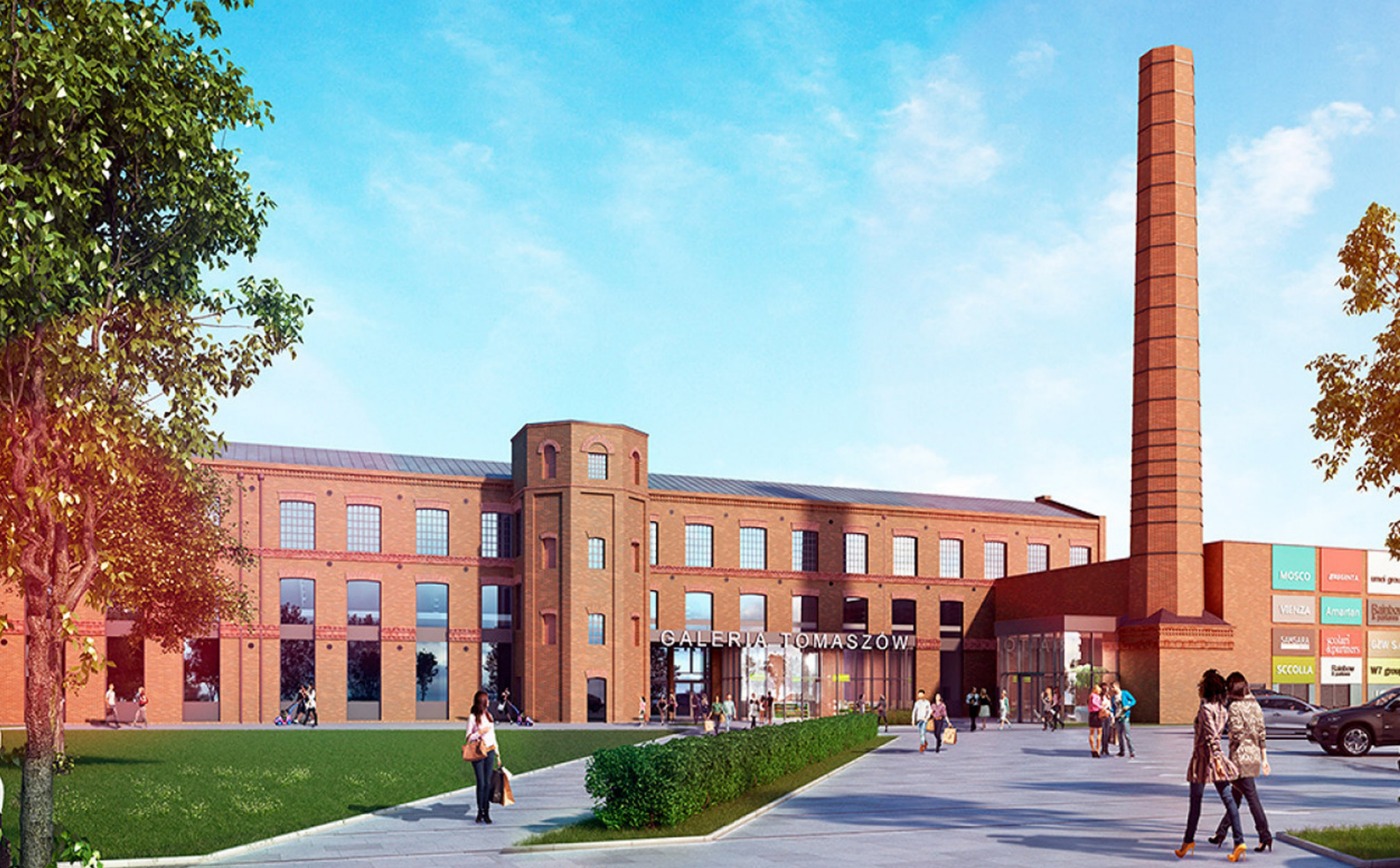
Ryc. 13. Projekt nowej galerii handlowej przy ul. Barlickiego; źródło: http://tomaszowmazowiecki.naszemiasto.pl/artukul/budowa-galerii-tomaszowruszy-la-ma-byc-gotowa-nakoniec,3565186,artgal,t,id,tm.html (dostęp: 01.08.2017)