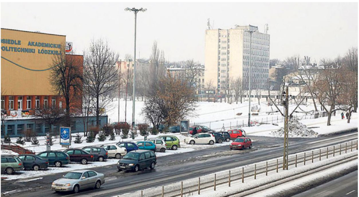
Ryc. 7. Stan z 2009 roku, po wyburzeniu obiektów „Malteku” – widok od strony południowo-wschodniej