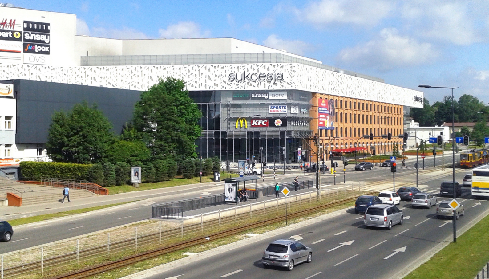
Ryc. 8. Galeria handlowa „Sukcesja” – widok od strony południowo-wschodniej Fig. 8. Shopping centre „Sukcesja” – view from the south-east side