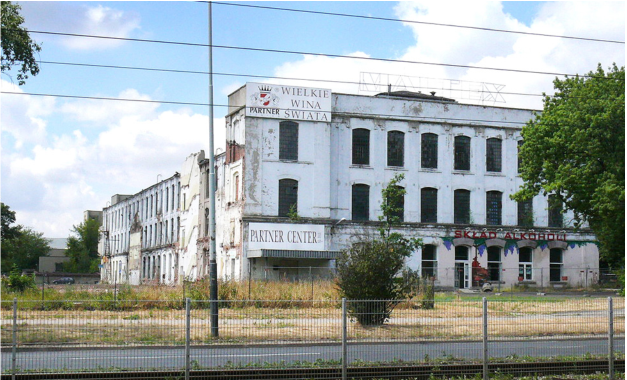
Ryc. 6. Zakłady „Maltek” na początku XXI wieku – widok od wschodu, z al. Politechniki