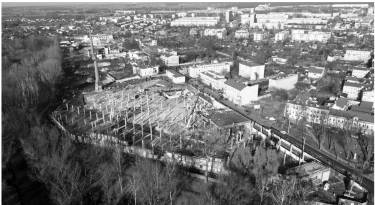
Ryc. 11. Budowa nowej galerii handlowej przy ul. Barlickiego, rok 2016; źródło: http://tomaszowmazowiecki.naszemiasto.pl/artykul/zdjecia/budowa-galerii-tomaszow-uroczystosc-wmurowana-ka-mienia,3645744,artgal,18975596,t,id,tm,zid.html (dostęp: 01.08.2017)