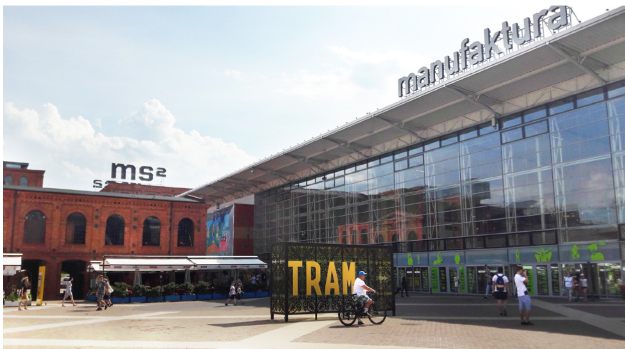
Ryc. 3. Manufaktura – dziedziniec wewnętrzny między galerią handlową a Muzeum Sztuki ms2; fot.: autorka Fig. 3. Manufaktura – inner courtyard between the new shopping centre building and The ms2 Art Museum; photo: by the author