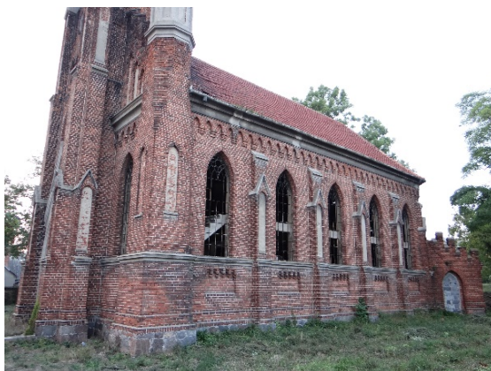
Rys. 4. Widok na boczną elewację

zaostrzonym, ponad którym wypuszczony został daszek ostrołukowy. Otwory okienne prostokątne, ostrołukowe, glifowane. W nich znajdują się ramy okienne krosnowe, w podłuczcu z maswerkiem, poniżej umieszczono profilowany fryz wtopiony w parapet obiegający kościół, pod nim w osi okien znajdują się prostokątne wnęki górą zamknięte opracowaniem ząbkowym. Ściany zwieńczono gzymsem podokapowym jednuskokowym, poniżej tynkowana opaska, pod nią fryz arkadowy trójuskokowy, ceglany oddzielony wałkiem (zob. rys. 4).