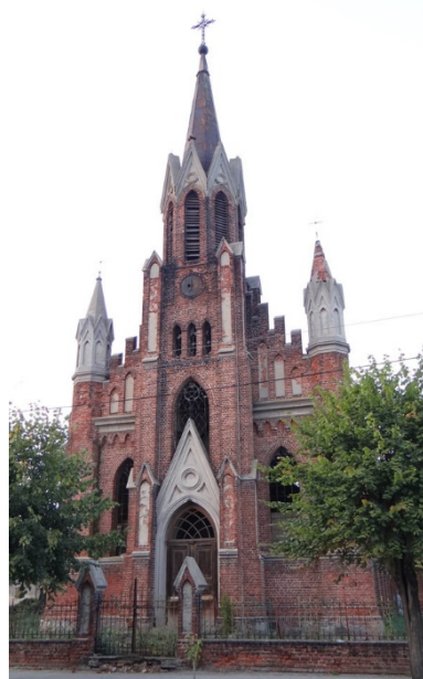
Rys. 3. Widok elewacji frontowej

Elewacja frontowa budynku jest nieco szersza od korpusu nawowego, z wyraźnym podziałem na trzy osie. Na głównej osi elewacji frontowej znajduje się wysunięty z lica portal z przedsionkiem wejściowym. Bezpośrednio z przedsionka, bocznym rozejściem komunikacyjnym w formie żelbetowych schodów można przejść na piętro, gdzie znajdują się empory – charakterystyczne dla tego typu architektury. Część środkowa jest zryzalitowana, przechodząca w wysoką trójkondygnacyjną wieżę, z portalem wejściowym z portykiem zwieńczonym wysoką ostrołukową wimpergą, wypełnioną ślepym tynkowanym maswerkkiem. Powyżej znajduje się trójdzielne okno (tzw. tryforium), nad nim zegar. Portal wejściowy opinający dwuoskokowe przypory wyposażony jest w proste dwuskrzydłowe osadzone na węgarkach, drewniane drzwi ramowo-płycinowe. Ten szczegółowy opis elewacji frontowej kościoła zawarty jest na załączonym zdjęciu (zob. rys. 3).