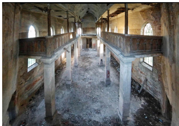
Rys. 5. Widok wnętrza kościoła wraz z widokiem na empory

Opisy obrazujące walory architektoniczne kościoła wykazują bezsprzecznie, iż jest on obiektem o wysokiej klasie artystycznej. Licznie występujący, okazały, różnorodny detal architektoniczny świadczy o randze kościoła.