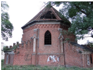
Rys. 2. Dwie przybudówki w tylnej części kościoła

Do boków ścian od północnej strony przylegają dwie przybudówki przykryte dachem pulpitowym. Ściany kościoła są murowane z cegły pełnej na zaprawie wapiennej, ceglane o wątku muru gotyckiego. Opis ten odzwierciedla załączona fotografia (zob. rys. 2).