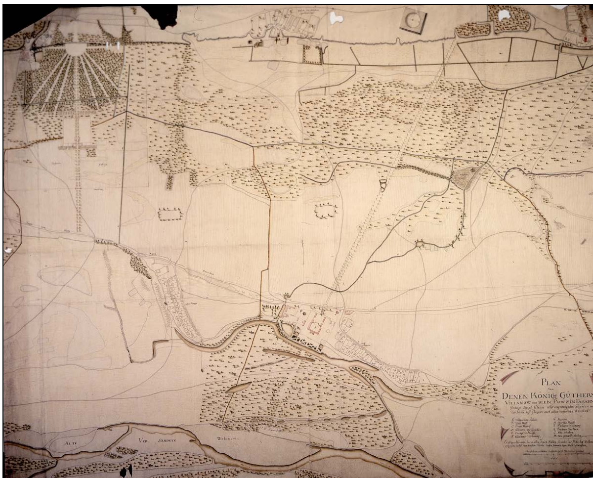
Ryc. 3. Plan Wilanowa, około 1730 r. Fig. 3. The map of Wilanów, ca. 1730.