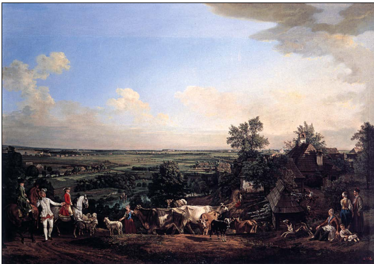
Ryc. 2. Bernardo Bellotto Canaletto, Widok łąk wilanowskich, 1775, oryginał w Zamku Królewskim w Warszawie.