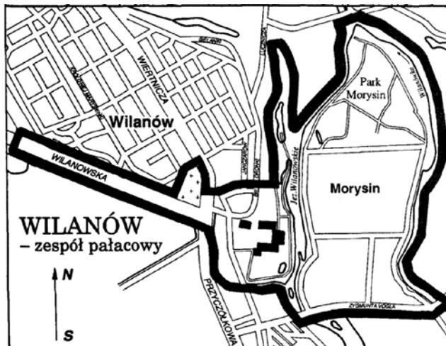
Fig. 4. Monument of history – Warsaw – historic city complex with the Royal Route and Wilanów (fragment).

Ryc. 5. Granice Wilanowskiego Parku Kulturowego.