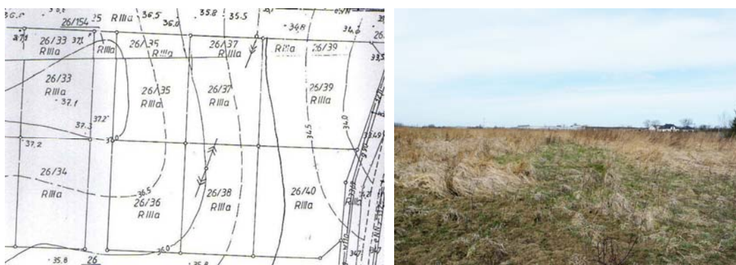
Ryc. 2. Przykład podziału dużej nieruchomości rolnej na mniejsze działki, których wielkość nie przekracza 0,5 ha.

podstawie decyzji o warunkach zabudowy. Ochrona gruntów wysokiej klasy miała na celu zapobieganie dzieleniu zwartej powierzchni rolnego na mniejsze niż 0,5 ha działki. W ten sposób unikano procedur zmiany przeznaczenia gruntów i budowano na mniejszych obszarach na podstawie decyzji. Ilustracja nr 2 przedstawia podział dużego arealu zwartej powierzchni rolniczej na mniejsze działki. Taki podział umożliwił zagospodarowanie terenu na podstawie decyzji o warunkach zabudowy.