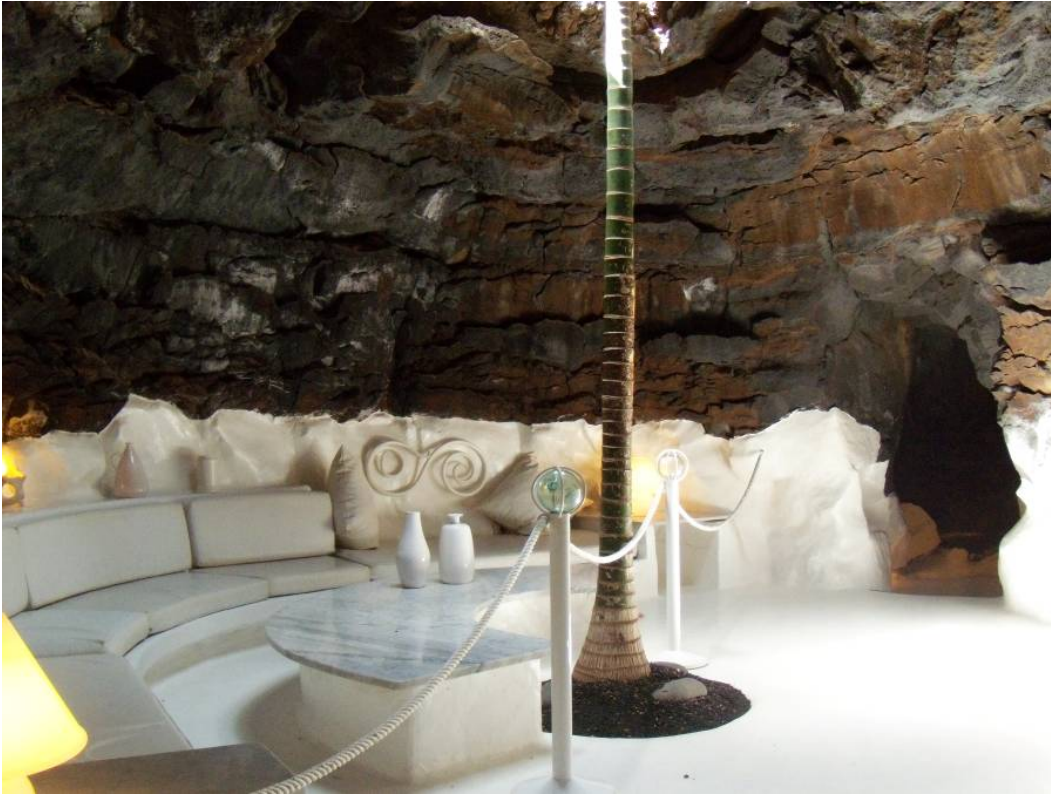
Ryc. 11 „Bańka biała” dom własny Cesara Manrique.

Fig. 11. „White bubble” Cesar Manrique's residence.