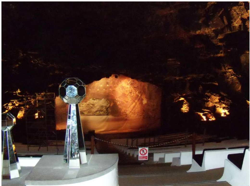
Ryc. 7 Jameos del Agua - audytorium w Jameo Grande. Fig. 7. Jameos del Agua – auditorium in Jameo Grande.