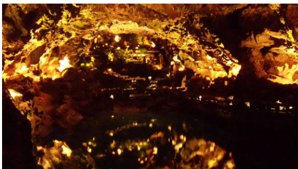
Ryc. 5 Naturalne jezioro w Jameos del Agua.