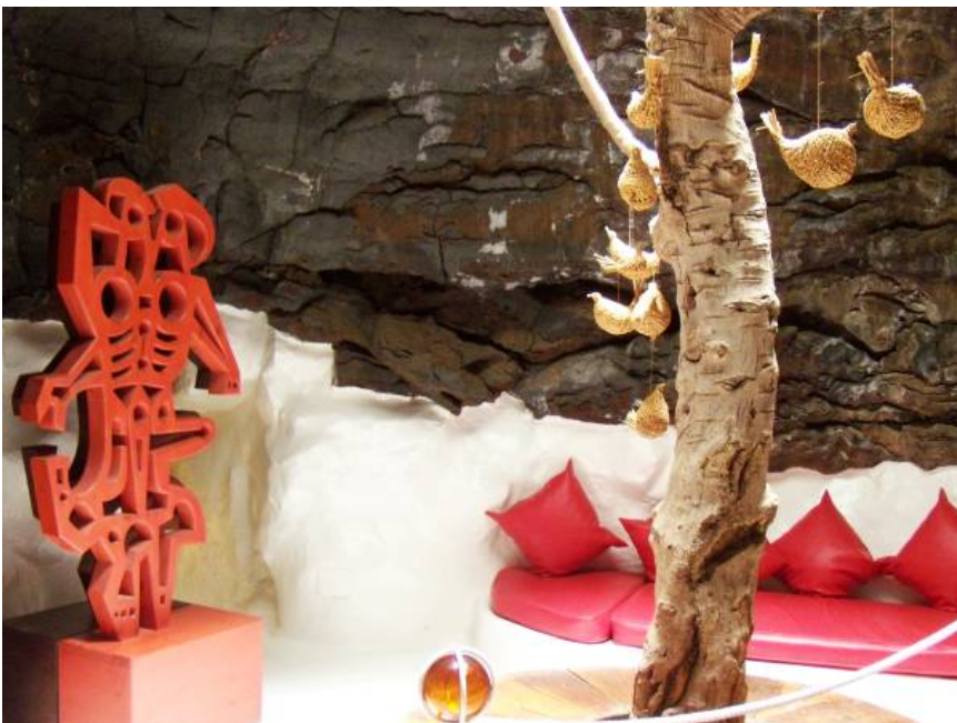
Ryc. 12 „Bańka czerwona” dom własny Cesara Manrique.

Upper floor is modern, spacious and inspired by traditional architecture of the Island (Fig. 2). The floor includes following rooms: living room, kitchen, sitting room, guest room, bedroom and bathroom.