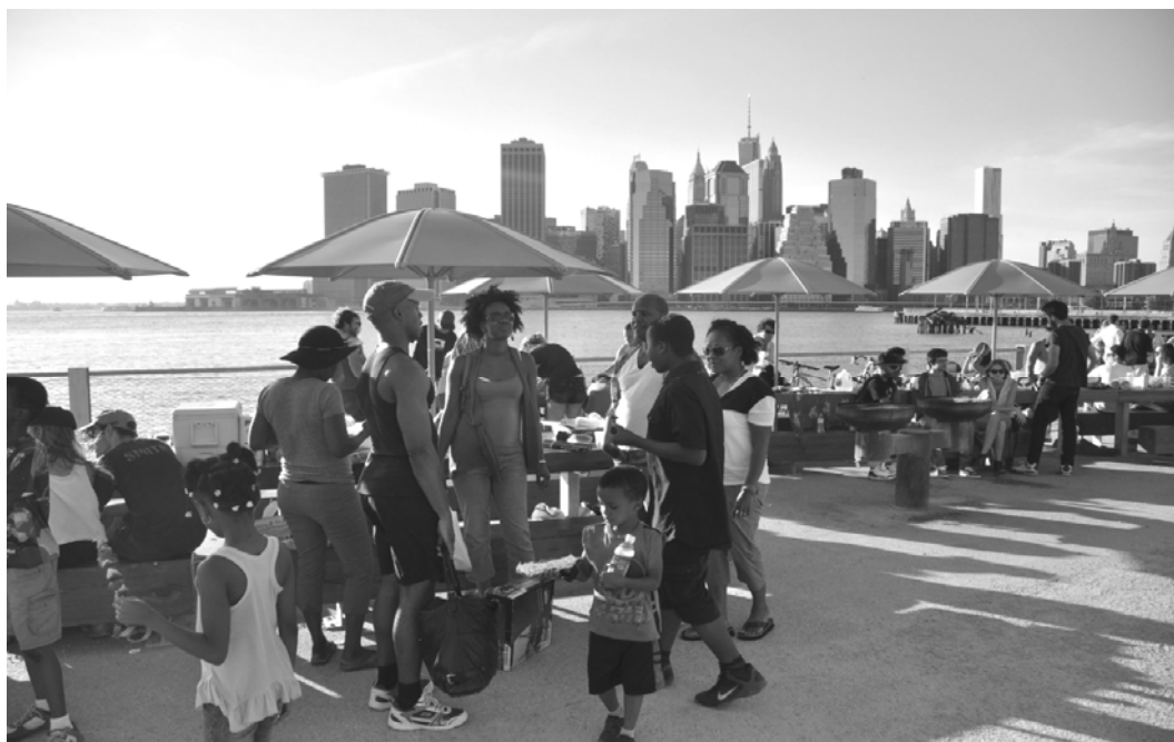
Ryc. 5. Niedzielnny piknik w Brooklyn Bridge Park, w tle sylweta Manhattanu.

Jednak – zdaniem autora – najbardziej dobitnym symbolem upamiętniającym wydarzenia z 11 września 2001 roku jest coroczna instalacja świetlna, uruchomiona po raz pierwszy w 2002 roku, utworzona przez kilkadziesiąt reflektorów przeciwlotniczych, tworzących dwa słupy światła wznoszące się ku niebu, w pobliżu miejsca, gdzie stały wieże WTC. Projekt ten nazywany początkowo „wieżami światła” ( Towers of Light ), a potem pod naciskiem rodzin ofiar przemianowany na „świetlny hołd” ( Tribute of Light ), zyskał uznanie mieszkańców i odtąd, w każdą noc przypadającą w rocznicę zamachu, w niebo nad Nowym Jorkiem wznoszą się widoczne z oddali dwa świetliste promienie, upamiętniające zamach i jego ofiary.