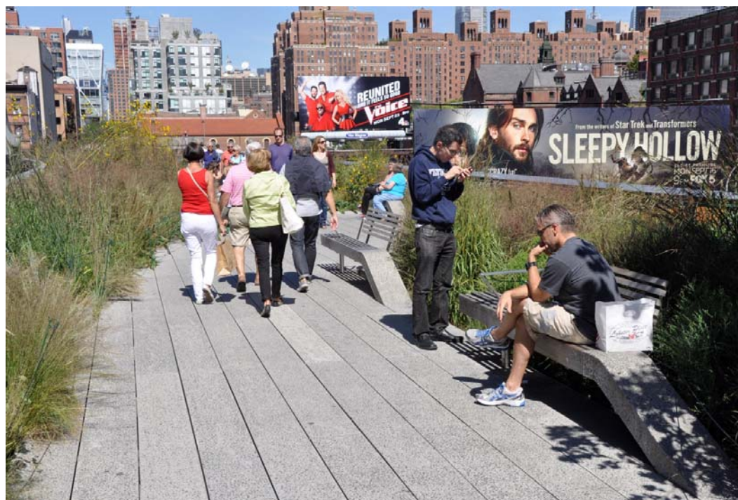
Ryc. 6. Park HighLine, Meatpacking, Chelsea, fot. autor.