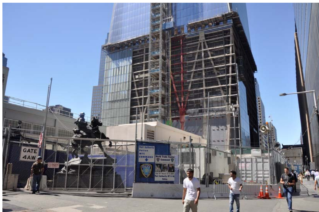
Ryc. 2. Podstawa wieży WTC 1 – „zwykły biurowiec nasadzony na bunkier” – fot. autor.

Tragedia 11 września najmocniej dotknęła mieszkańców Nowego Jorku. „Miasto i jego sylweta zmieniły się na zawsze. Kiedy gruzy zostaną uprzątnięte i ofiary policzone pozostanie wielka wyrwa – nie tylko w sercu Manhattanu – ale i w sercu każdego Nowojorczyka” – napisała kilka dni po zamachu Ada Louise Huxtable, felietonistka gazety Wall Street Journal [Huxtable 2008, s. 378]. Skala zniszczeń była przerażająca: w gruzach, których wysokość sięgała szóstego piętra leżał cały wielkomiejski superblok, o powierzchni ponad 6 hektarów. W dwanaście lat po tym tragicznym wydarzeniu gruzy zostały uprzątnięte i ofiary policzone, ale nie dokończono jeszcze odbudowy zniszczonego kwartału miasta: nie został otwarty budynek muzeum 9/11, nadal trwa budowa tzw. Freedom Tower , z czasem prozaicznie przemianowanej na WTC One.