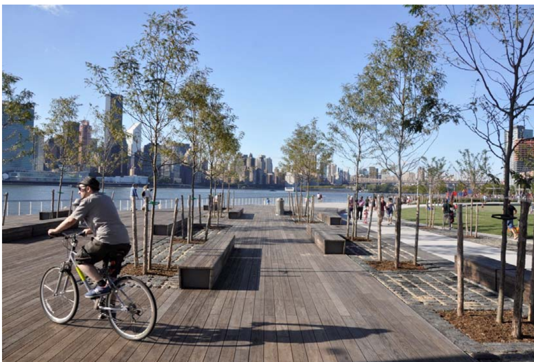
Ryc. 7. Nowy park wzdłuż nadbrzeży East River, pomiędzy Brookinem i Queens, fot. autor.

Jednak wbrew często podnoszonym obawom ani atak terrorystyczny dokonany 11 września 2001, ani światowy kryzys finansowy i upadek banku Lehman Brothers w 2008 roku, ani uderzenie huraganu Sandy, który zniszczył nowojorskie nadbrzeża jesienią 2012 roku, nie zatrzymały rozwoju centralnego obszaru Nowego Jorku. Dolny Manhattan stał się obecnie modnym i atrakcyjnym miejscem do mieszkania. Ponad 1000 istniejących tu sklepów i restauracji oraz miliony przybywających tu corocznie turystów powodują, że dzielnica żyje 24 godziny na dobę przez siedem dni w tygodniu. Rozwija się cały Nowy Jork: rośnie jego liczba mieszkańców, która przekroczyła rekordową wartość 8 milionów, maleje stopa przestępczości, podnosi się jakość życia. Nowy Jork ma ambicje by stać się najbardziej „zielonym” miastem Stanów Zjednoczonych: silnie zurbanizowanym, przyjaznym ludziom i zrównoważonym eko-systemem, „modelem dla miast XXI wieku” [Bloomberg 2007, s. 11]. Paradoksalnie sprzyja temu jego intensywna zabudowa i rozbudowany system masowej komunikacji publicznej. W USA uzmysłowiono sobie że najbardziej proekologiczną i energooszczędną formą zabudowy jest wysoka i bardzo intensywna zabudowa śródmiejska, zaś najbardziej zabójczą dla środowiska są pożerające naturalne zasoby i energię rozległe suburbia [Chakrabarti 2013, s. 74-124].