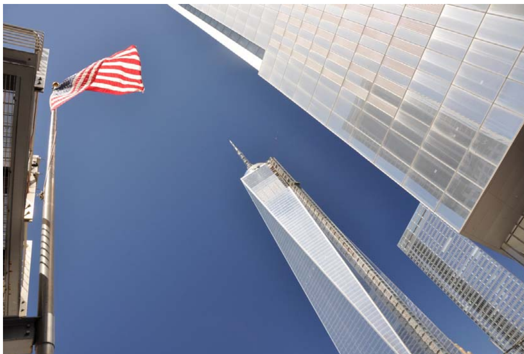
Ryc. 1. Nowa wieża WTC 1, zwana dawniej Freedom Tower