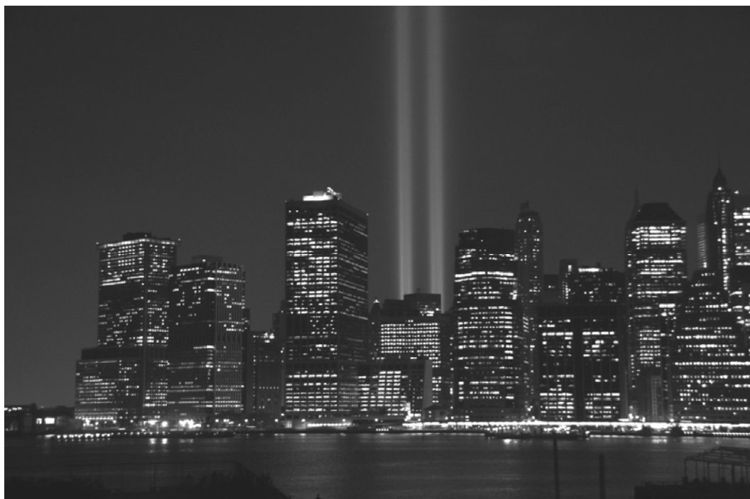
Ryc. 4. Rocznicowa instalacja świetlna Tribute in Light upamiętniająca wydarzenia 11 września 2001 roku.

czasu była coraz bardziej zniekształcana, a sam architekt został odsunięty od prac projektowych, co tłumaczono brakiem doświadczeń w realizacji obiektów komercyjnych. Jego obowiązki przejął David Childs, należący do elity amerykańskich architektów szef międzynarodowego koncernu architektonicznego Skidmore, Owings and Merrill. Ostatni cios projektowi Liebeskinda został zadany wiosną 2005 roku, kiedy prace projektowe zostały wstrzymane przez nowojorską policję, odpowiedzialną za bezpieczeństwo obiektu. W rezultacie wniesionych zaleceń projekty Wieży Wolności, jak i innych obiektów wchodzących w skład kompleksu WTC, poddane zostały gruntownej rewizji polegającej na wzmocnieniu konstrukcji, utwardzeniu elewacji i budowie wokół nich stref bezpieczeństwa. Nowojorski krytyk architektoniczny Paul Goldberger określił nowy projekt WTC One jako „zwykły biurowiec nasadzony na bunkier” [Goldberger 2005, s. 266].