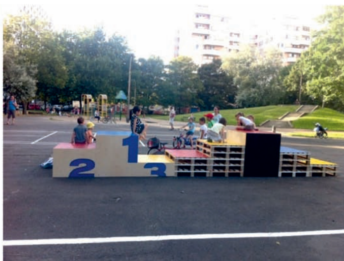
Il. 7. Realizacja Placu Górka – gry plenerowe i meble miejskie; / Realization of Górka Square – outdoor games and street furniture