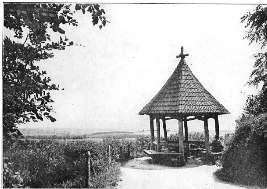
Aussichtslaube unterhalb der Königshöhe.