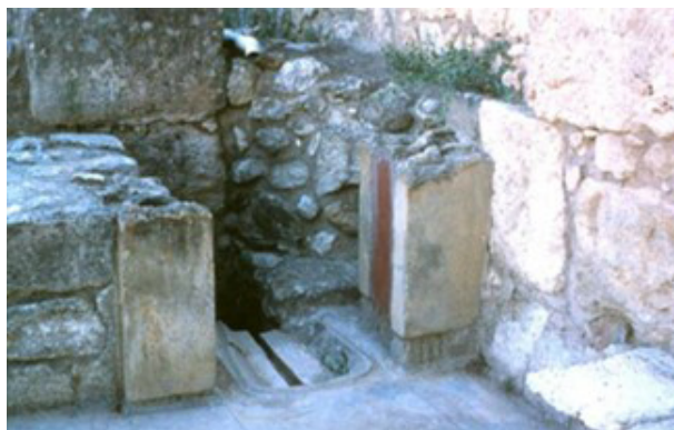
Rys. 2 widok pozostałości „Toalety Królowej” w pałacu Knossos na Krecie; fotografia B. Uherek – Bradecka, 2015