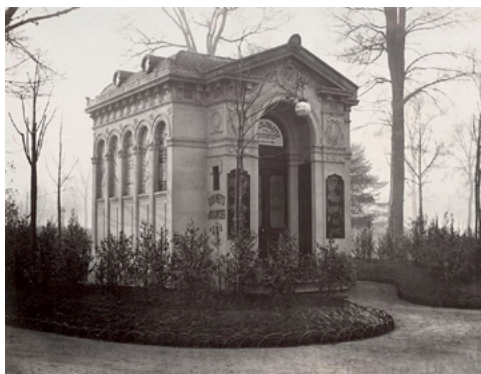
Rys. 10. Toalety publiczne Dorion (Pałac Petit Pipi), Pola Elizejskie; ok. 1874