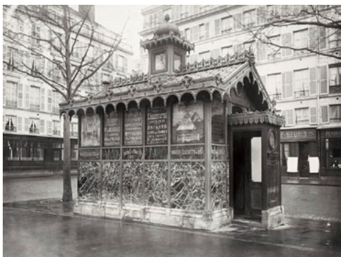
Rys. 9. Châlet de nécessité du marché de la Place de la Madeleine (Domek z konieczności na rynku Place de la Madeleine)