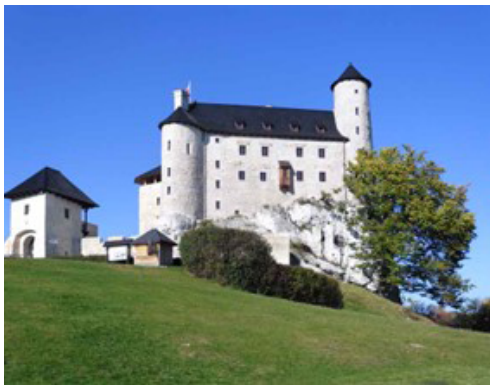
Rys. 5. wykusz latrynowy na ścianie zamku w Bobolicach; fotografia B. Uherek – Bradecka, 2022