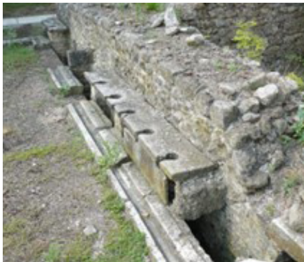
Rys. 3 pozostałości publicznych toalet w Efezie; fotografia B. Uherek – Bradecka, 2015

Wiadomo także, iż publiczne toalety w Starożytnym Rzymie powstawały nawet wcześniej niż publiczne łaźnie. Cesarz Wespazjan (I w.n.e.) był pierwszym władcą, który docenił znaczenie publicznych toalet, co więcej, opodatkowując je i zalecając wykorzystywanie moczu jako środka wybielającego, uczynił z nich źródło zasilające cesarską kiesę. 1 Wspominając kwestię toalet w Starożytnym Rzymie należy jednak zwrócić uwagę nie tylko na aspekt finansowy toalet publicznych. Niezmiernie ciekawy jest także aspekt socjologiczny, o którym będzie mowa w dalszej części artykułu, oraz aspekt wtedy stosowanych przestrzennych rozwiązań. A ten, był zgoła odmienny od dzisiejszych standardów! Układ przestrzenny „ latrini ” polegał na lokalizowaniu dużej liczby „oczek” 2 w kamiennej ławie obok siebie, liniowo, w układach zlokalizowanych vis a vis , w kształcie litery ‘L’ lub ‘U’. Przede wszystkim toalety publiczne były jednak koedukacyjne – jednocześnie korzystały z nich zarówno kobiety jak i mężczyźni, a rolę obecnego papieru toaletowego spełniało tesorium 3 , które płukano w kanale umieszczonym w podłodze przed ławami z toaletami, w którym płynęła bieżąca woda. Kanały takie widoczne są zarówno w publicznych toaletach Efezu (rys.3), jak i innych miejsc, będących przedmiotem badań archeologicznych – Forum Romanum, czy Kartaginy w obecnej Tunezji (rys.4).