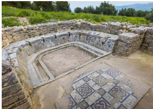
Rys. 4 zachowane toalety publiczne – termy Antoniusza, Tunis, Tunezja B. Uherek – Bradecka, 2000

W okresie post rzymskim na formowanie toalet bez wątpienia miała wpływ, zaczynająca dominować religia chrześcijańska, promująca prywatność. Wtedy to toalety zbiorowe zaczynają być wypierane przez toalety jednomiejscowe lokalizowane w domach, co ciekawe, w wielu wypadkach przy kuchniach. [14] Upadek cesarstwa wiązał się także ze znacznymubożeniem miast. Zaniechano budowy nowych sieci sanitarnych (wodociągowych i kanalizacyjnych), a istniejące, nieremontowane, z czasem zarastały, a ceramiczne kształtki z których były wykonywane murszały i kruszyły się. Przystały więc funkcjonować także publiczne latryny. Ogólnie stwierdzić można, iż w czasach średniowiecza, publiczne toalety (latryny) przestają w ogóle funkcjonować. Choć od tej reguły także można znaleźć wyjątki.