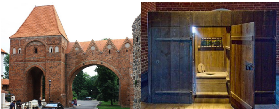
Rys. 7 Gdanisko (dankster) w Toruniu – jedyna zachowana obecnie część zamku

Jednak wykusze latrynowe to nie jedyny sposób rozwiązywania kwestii toalet publicznych w średniowiecznych zamkach. Często pojawiają się także wieże kloaczne, zwane danksterami lub gdaniskami 6 (rys.7) [16]. Prawdopodobnie pierwsze wieże kloaczne powstały w zamkach krzyżackich w Malborku (gdzie ulokowano rząd zamykanych kabin (rys.8), Grudziądzu czy Królewcu, jednak z czasem zaczęto je stosować w budownictwie nie związanym tylko z zakonem krzyżackim, ale także w zamkach biskupich, czy siedzibach kapituły. Należy także pamiętać, że wieże kloaczne, oddalone od zasadniczej części zamku, połączone z nim najczęściej krytym gankiem, pełniły oprócz funkcji sanitarnej także funkcję obronną, były bowiem strzelnicami, wysuniętymi poza linie murów obronnych. Niezmiernie ciekawym rodzajem toalet publicznych były także średniowieczne toalety klasztorne. Klasztory, zwłaszcza cysterskie, bardzo często lokowano w bliskości rzek lub strumieni, dlatego w wielu z nich istniały kanały z bieżącą wodą, które odprowadzały nieczystości z obrębu clastrum. To w klasztorach, już w średniowieczu, pojawiają się pierwsze publiczne toalety z wydzielonymi kabinami [18]. Ma to miejsce zarówno w klasztorach męskich jak i żeńskich. Bez wątpienia wpływ na ich kształtowanie ma sposób życia zakonnego i dbałość o zachowanie odosobnienia, a wręcz intymności. Jednak klasztory i zamki, to miejsca po tym względem wyjątkowe. W miastach toalety publiczne niemal nie występowały.