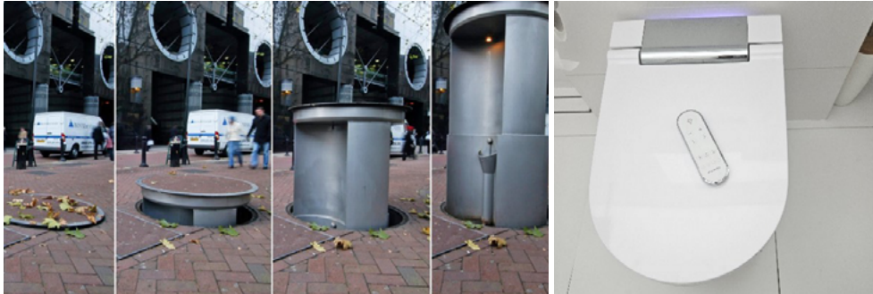
Rys. 11. Toalety publiczne „Urilift” firmy pop-up toilet w Londynie

Dowodzi to niezbicie, iż budynki i przestrzenie publicznych toalet stają się tematem ważnym i chętnie podejmowanym przez architektów. Warto także zwrócić uwagę na fakt, iż w przypadku tych obiektów, mimo historycznego kontekstu króluje minimalizm, wspierany technologią i elektroniką. A ta z kolei wkracza zarówno do samych misek, jak i do rozwiązań całych bloków toaletowych.