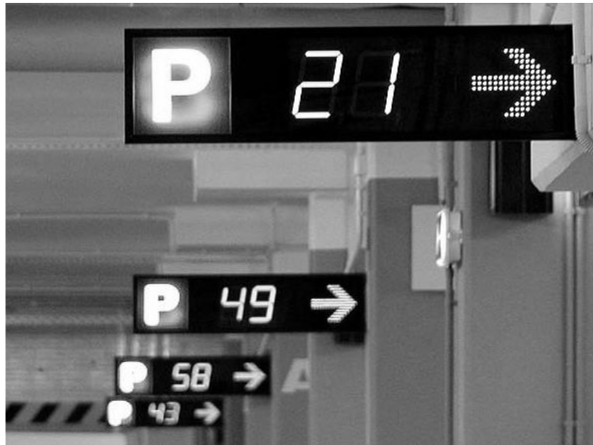
Rys. 3. Informacja o zajętości miejsc na parkingu przy centrum handlowym

W XXI wieku rozwiązania telematyczne pozwalają na tworzenie tanich, stabilnych i dokładnych systemów usprawniających mobilność miejską. Jednym z usprawnień jest system informacji o zajętości miejsc parkingowych. Najczęściej stosowane są systemy detekcji optycznej opartej o system kamer wizyjnych oraz czujników wmontowanych w powierzchnię płyty parkingowej. Rozwiązania często występujące na parkingach wielopoziomowych na próżno szukać w polskich miastach oraz otwartych przestrzeniach parkingowych.