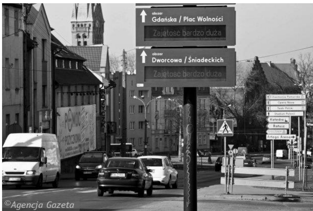
Rys. 4. Tablice informujące o zajętości miejsc parkingowych w Bydgoszczy