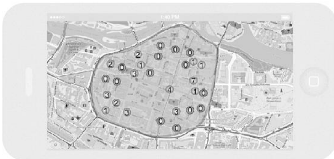
Rys. 7. Wizualizacja systemu informacji parkingowej na telefonie komórkowym

Wprowadzenie takiego rozwiązania do miast borykających się z problemem parkowania, przyczyni się bezpośrednio do zwiększenia wykorzystania współczynnika zajętości konkretnych miejsc parkingowych i skrócenia czasu ich poszukiwania