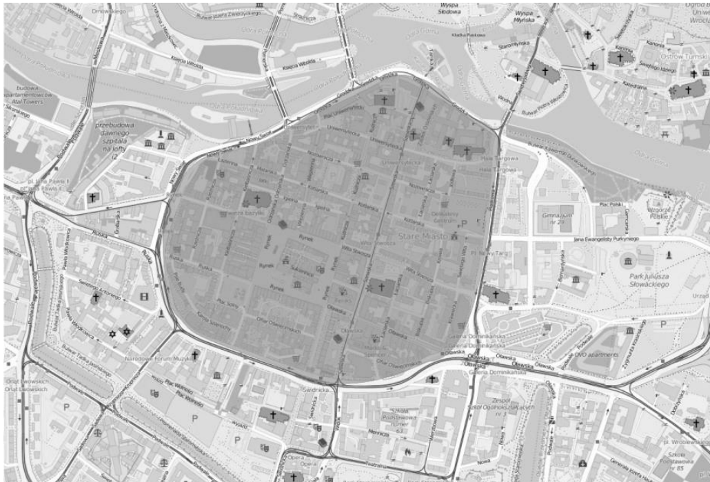
Rys. 2. Proponowana strefa monitoringu zajętości miejsc parkingowych

Dla lepszego zobrazowania sytuacji posłużymy się przykładem miasta Wrocławia, gdzie ścisłe centrum ograniczone jest ulicami Kazimierza Wielkiego, Nowy Świat, Grodzką i św. Katarzyny. Teren pomiędzy tymi arteriami stanowi strefę uspokojonego ruchu, w której większość obszaru oznaczona jest znakiem D-40, jako strefa zamieszkania.