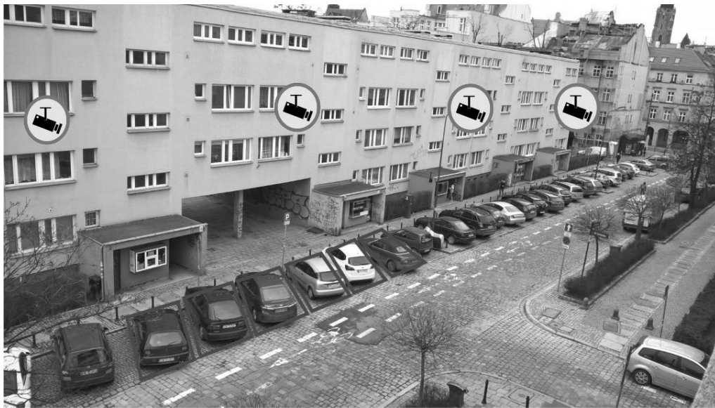
Rys. 6. Wizualizacja systemu wideo detekcji dostępności miejsc

Każda z metod ma swoje wady i zalety, a wybór konkretnego rozwiązania technicznego jest rzeczą drugorzędną. Najważniejszym aspektem jest system informacji, który otrzymają kierowcy w postaci np. portalu internetowego czy aplikacji mobilnej. Będzie można na niej sprawdzić bieżące zapelnienie parkingów i zdecydować o sensie wjazdu w strefę uspokojonego ruchu.