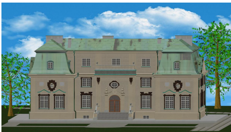
Rys. 1. Wizualizacja iluminowanego obiektu, fasada zachodnia [3]

Letni Pałac Lubomirskich w Rzeszowie powstał w latach 90 XVII w. na terenie dawnej winnicy Mikołaja Spytka Ligęzy jako część dużego kompleksu ogrodowego wokół rezydencji na zamku [1]. Jest to późnobarokowa rezydencja z elementami stylu rokoko, posiadająca trzy kondygnacje, zbudowana na planie litery H. W środkowej części fasady (rys. 1) widoczne są trzy kolumny okien na trzech kondygnacjach. W skrzydłach wysuniętych względem centralnej części znajdują się po dwie pary okien w pierwszej kondygnacji, natomiast na piętrze zamiast okien umieszczone są nisze z popiersiami członków rodziny Lubomirskich. Wszystkie narożniki ścian posiadają pilastry, natomiast każda elewacja jest zdobiona pojedynczym centralnie umieszczonym ryzalitem. Zwieńczeniem każdej ściany jest trójdzielny gzyms biegnący dookoła budynku.