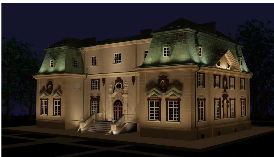
Rys. 6. Wizualizacja iluminowanego obiektu, wariant 1 oświetlenia [3]

Efekt końcowy obrazuje wizualizacja pokazana na rysunku 6. Uzyskano względnie równomierne rozświetlenie ścian z zaakcentowaniem dachu oraz tympanonu na ścianie bocznej, a także centralnego ryzalitu na fasadzie.