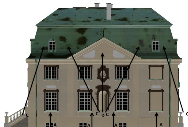
Rys. 8. Rozmieszczenie opraw, fasada południowa [3]

Fig. 7. Location of luminaires, west facade [3]