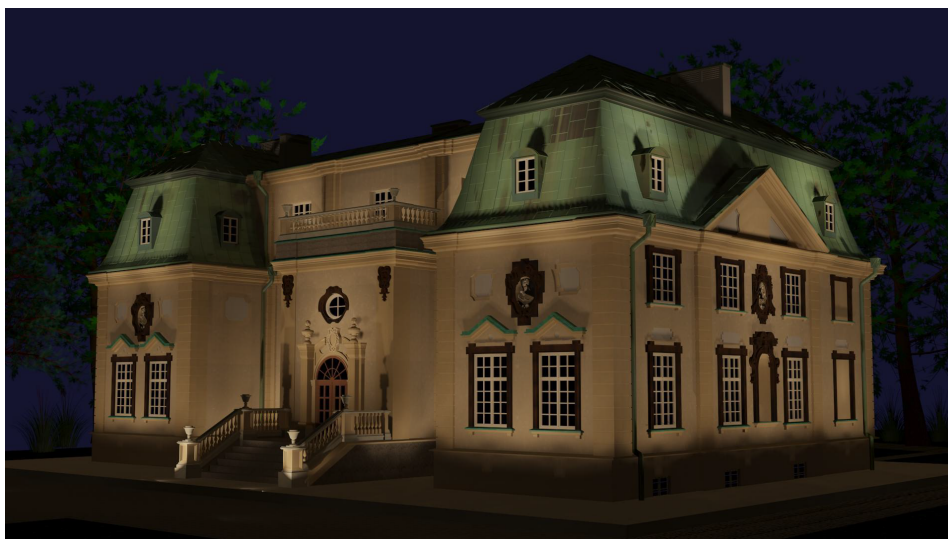
Rys. 9. Wizualizacja iluminowanego obiektu, wariant 2 oświetlenia [3]

Wizualizację efektu końcowego pokazano na rysunku 9. Uzyskano bardziej równomierne rozświetlenie ścian oraz dachu budynku. Wariant ten nie wykorzystuje opraw montowanych na budynku, jednak może brakować w pewnym stopniu wyraźnych akcentów świetlnych na niektórych elementach.