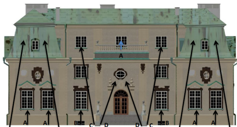
Rys. 7. Rozmieszczenie opraw, fasada zachodnia [3]

Wariant drugi został zrealizowany z wykorzystaniem punktowych opraw o obrotowo symetrycznym rozsyśle światłości [6], zlokalizowanych częściowo w nieco większej odległości od elewacji niż w wariantcie 1, ale nie na tyle dużej, jak w metodzie zalewowej oraz opraw doziemnych montowanych blisko elewacji. Rozmieszczenie opraw na poszczególnych elewacjach pokazano na rysunkach 7 i 8.