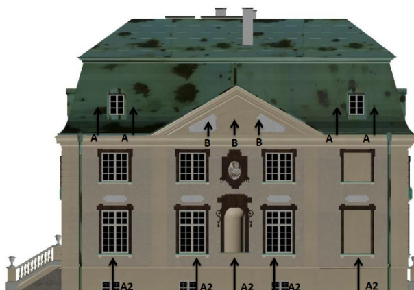
Rys. 5. Rozmieszczenie opraw, fasada południowa [3]