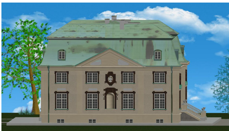
Rys. 2. Wizualizacja iluminowanego obiektu, fasada północna [3]

Ściany boczne (rys. 2) zostały ozdobione centralnym ryzalitem, który w odróżnieniu od elewacji głównej i tylnej posiada zwieńczenie w postaci trójkątnego tympanonu. W jego centralnej części znajduje się pusta podłużna nisza na parterze oraz owalna z popiersiem na piętrze. Po bokach nisz znajdują się po dwie kolumny okien analogicznych, jak na głównej ścianie. Wszystkie te elementy są istotne z punktu widzenia projektowanej iluminacji, w kontekście wyróżnienia charakterystycznych elementów budynku oraz ewentualnego rozmieszczenia sprzętu oświetleniowego.