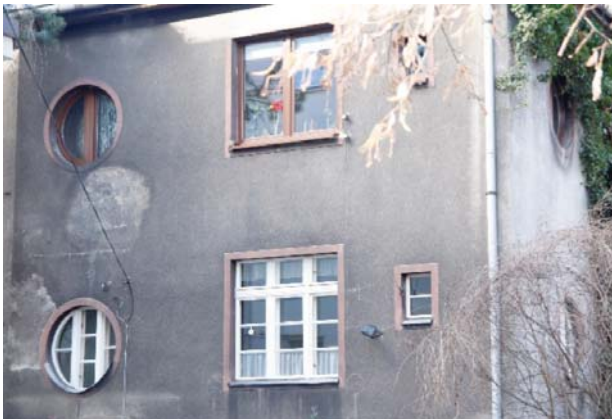
Il. 7. Willa przy ulicy Poleskiej 8, na parterze widoczna zachowana oryginalna stolarka.

Ill. 6. Villa at 17 Mazowiecka Street with original pergolas.