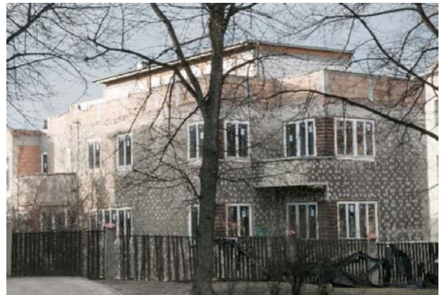
Il. 8. Willa przy ulicy Kościuszki 65, po przerwanych pracach modernizacyjnych.

Ill. 7. Villa at 8 Poleska Street, on the ground floor original window woodwork.