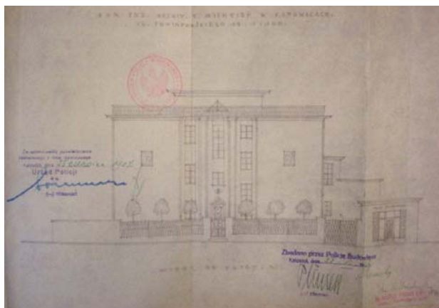
II. 3. Pierwszy projekt willi własnej Tadeusza Michejdy.