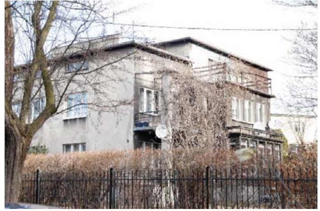
Il. 6. Willa przy ulicy Mazowieckiej 17 z oryginalnymi pergolami. Fot. K. Łakomy, 2019.

Ill. 5. Villa at 16 Poleska Street, in the foreground the old hawthorn. Photo: K. Łakomy, 2019.