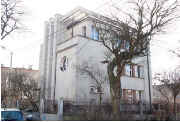
Il. 5. Willa przy ulicy Poleskiej 16, na pierwszym planie okaz starego głogu.

Ill. 5. Villa at 16 Poleska Street, in the foreground the old hawthorn.