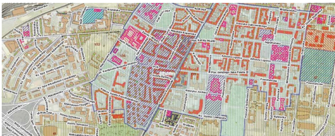
II. 2 a. Współczesny stan zagospodarowania dzielnicy południowej, strefy ochrony konserwatorskiej (granatowy szraf), obiekty w rejestrze zabytków (kolor różowy), wpisane do ewidencji (zielona kropka) http://emapa.katowice.eu/jarc-gui/views/main.xhtml