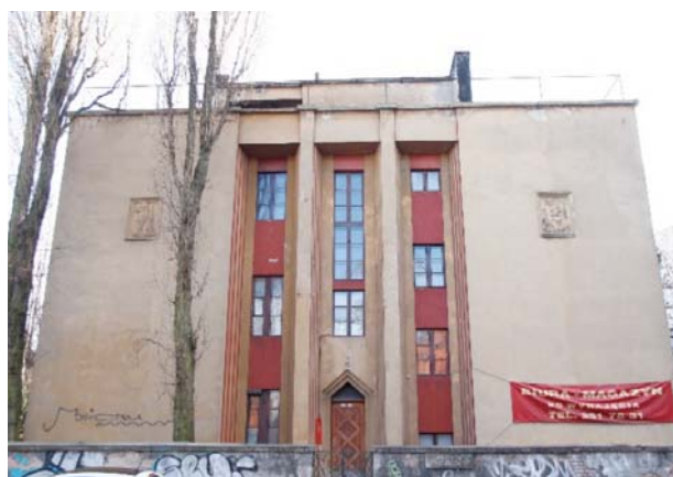
II. 4. Willa Tadeusza Michejdy przy ulicy Poniatowskiego 19. Fot. K. Łakomy, 2019.