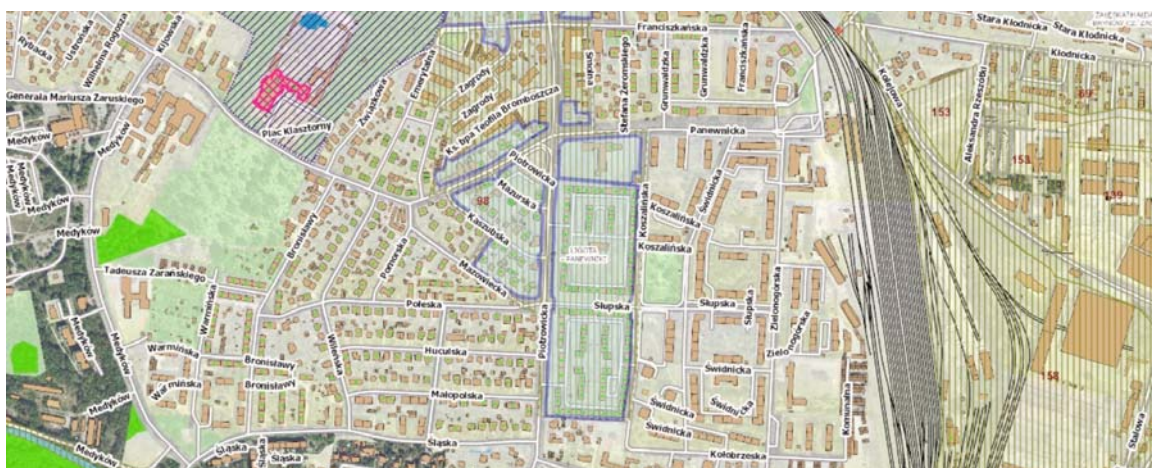
II. 2 b. Współczesny stan kolonii urzędniczej Ligota, legenda jw., http://emapa.katowice.eu/jarc-gui/views/main.xhtml