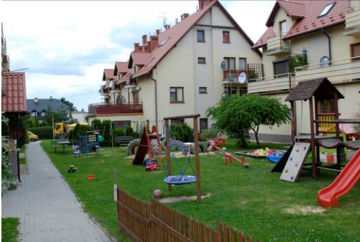
Fig. 9. Common green space between blocks of flats, Zimowit district.

Ryc. 9. Zielen zabudowy śródmiejskiej na osiedlu Zimowit.