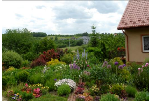
Fig. 10. An example of decorative house garden, Zalesie district.

Ryc. 9. Zielen zabudowy śródmiejskiej na osiedlu Zimowit.