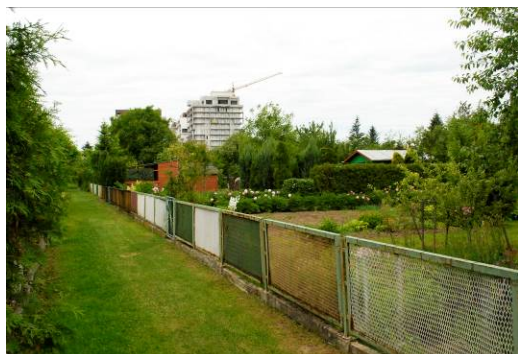
Fig. 3. Allotment gardens in the south-eastern part of Rzeszów.

Ryc. 3. Ogródki działkowe w południowo-wschodniej części Rzeszowa.