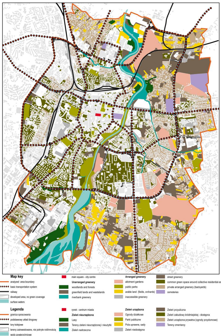
Fig. 1. Structure of greenery in downtown of Rzeszów. Ryc. 1. Struktura zieleni w obszarze śródmieścia Rzeszowa.