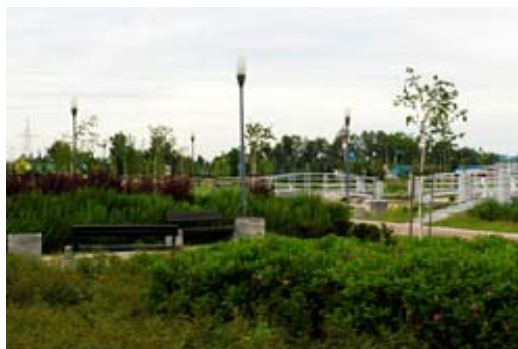
Fig. 5. Park Papieski (Papal Park) - municipal park established at the beginning of XXI century.

Ryc. 4. Park Jedności Polonii z Macierzą - park miejski powstały w okresie powojennym w centrum miasta.