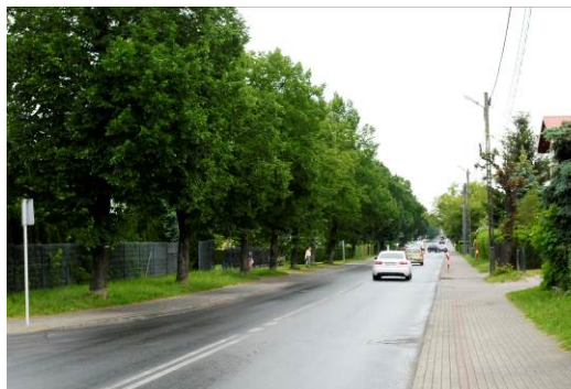
Fig. 7. Street green - classical alley arrangement, Łukasiewicz St.

Ryc. 6. Tereny użytkowane rolniczo na osiedlu mieszkalnym.