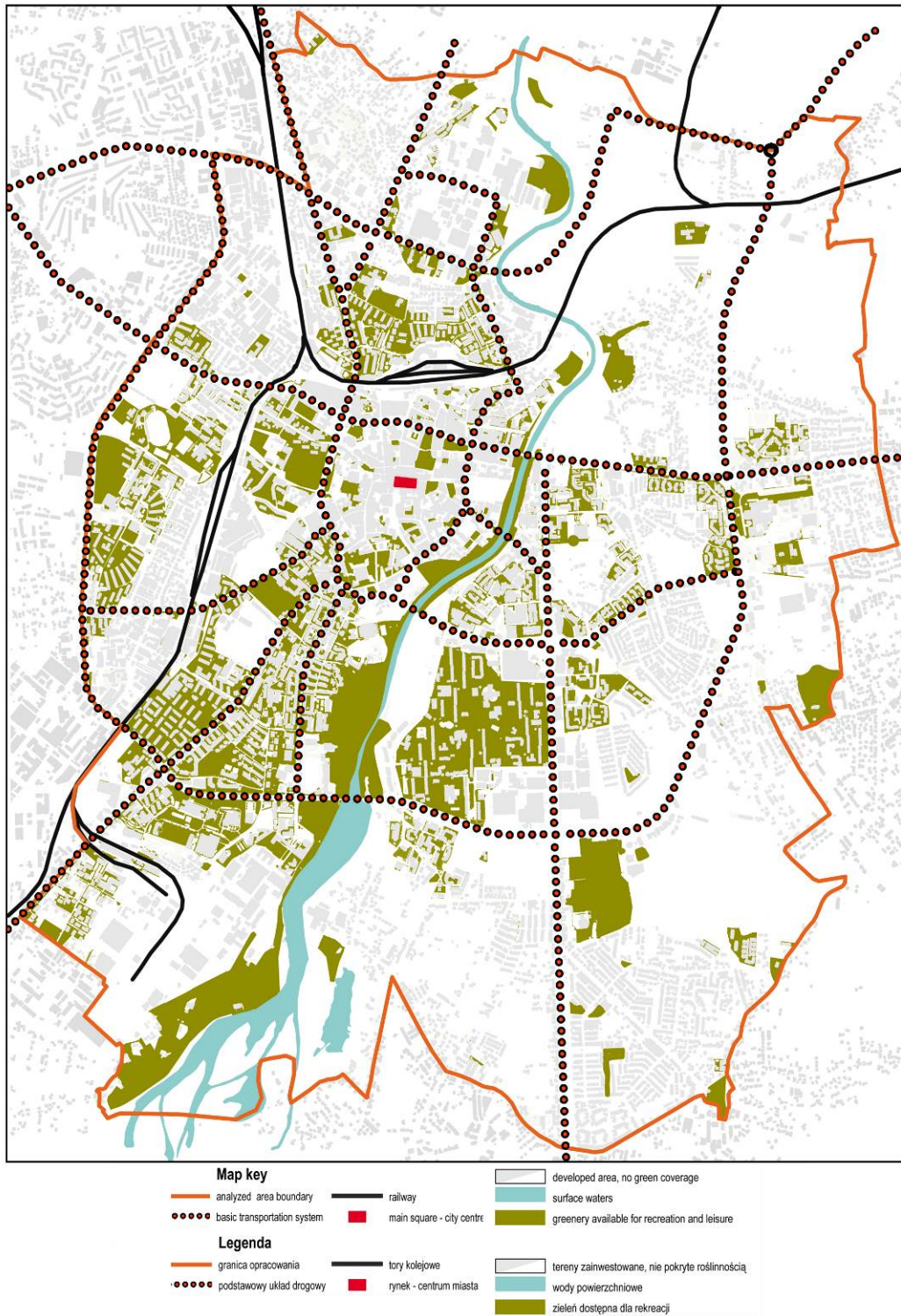
Fig. 2. Analysis of a public arranged greenery. It shows the area available to meet the needs of leisure and recreation of inhabitants.

Ryc. 2 Analiza zasobu zieleni ogólnodostępnej urządzonej. Przedstawia ilość zieleni dostępną dla zaspokajania potrzeb wypoczynku i rekreacji mieszkańców miasta.