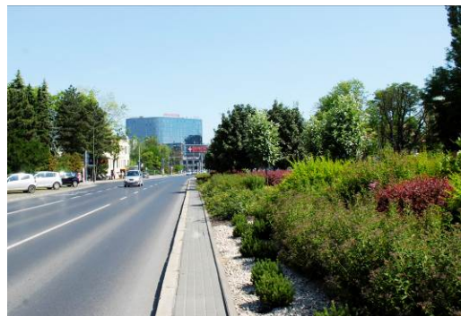
Fig. 8. Street greenery - modern composition of perennials, shrubs and trees, Ciepliński Alley. Source: photo by A. Gajdek, 2017

Ryc. 7. Zieleń przyuliczna – klasyczne założenie alejowe, ul. Łukasiewicza. Źródło: fot. A. Gajdek, 2017