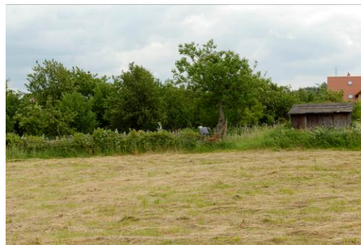
Fig. 6. Arable land use within residential area.

Ryc. 5. Park Papieski - park miejski powstały na początku XXI w.