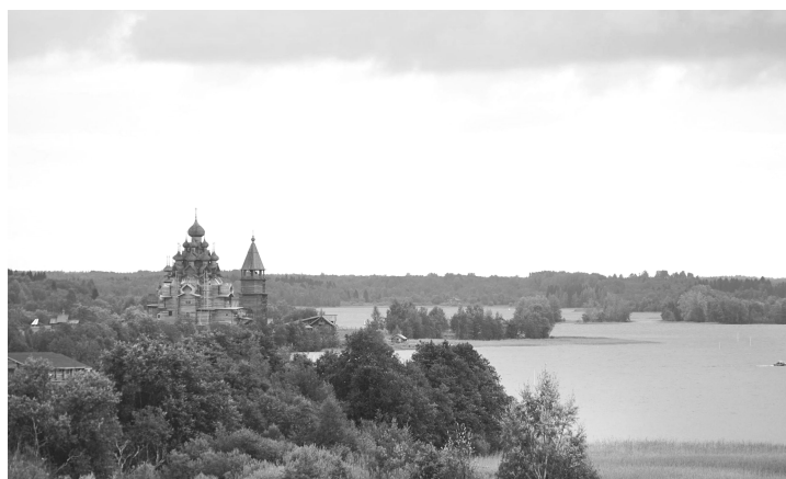
Ryc. 7. Widok zespołu cerkiewnego Kiży w krajobrazie wyspy i jeziora, (fot. J. Kurek, 2016) Fig. 7. Kizhi Orthodox church assembly view in a landscape of the island and the lake, (photo by J. Kurek, 2016)