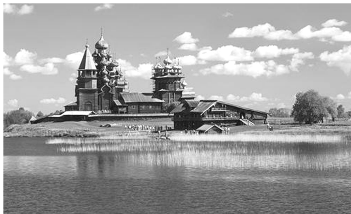
Ryc. 6. Widok zespołu cerkiewnego Kiży Pogost (źródło: http://whc.unesco.org/en/list/544 ) Fig. 6. View of the assembly orthodox church assembly Kizhy Pogost , (source: http://whc.unesco.org/en/list/544 )

Głównym zabytkiem zespołu architektonicznego – skansenu Kiży jest cerkiew Przemienienia Pańskiego. Zbudowano ją w 1714 roku na miejscu wcześniejszej, która spłonęła od uderzenia pioruna. Uważa się, że wzorem dla jej konstrukcji i form była cerkiew Opieki Najświętszej Bogarodzicy z 1708 roku ze wsi Anchimowo w obwodzie wołogodzkiem. Cerkiew Przemienienia Pańskiego ma wys. 37 m – jest częścią zespołu cerkiewnego Kiży Pogost 7 . Kolejnymi integralnymi elementami tego zespołu są: Cerkiew Opieki Matki Bożej (1694-1764) oraz dzwonnica – zbudowana na miejscu poprzedniej w 1862 r. (Ryc. 6-10).