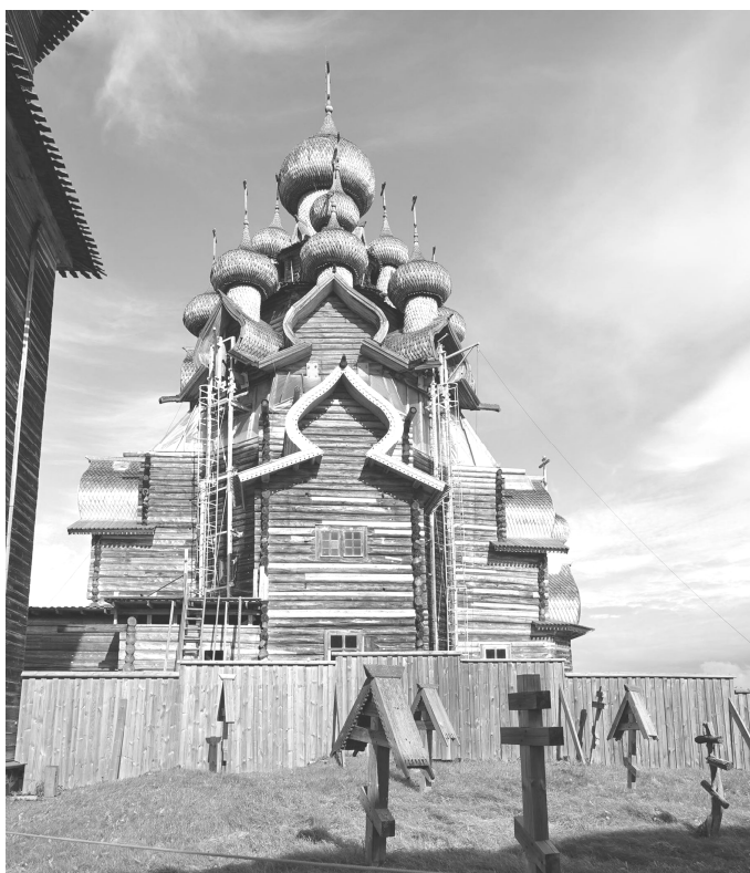
Ryc. 8. Kiży, cerkiew Przemienienia Pańskiego, (fot. J. Kurek, 2016) Fig. 8. Kizhy, The Church of the Trans- figuration, (photo by J. Kurek, 2016)

Zespół cerkiewny Kiży został w 1990 roku wpisany na Listę Światowego Dziedzictwa UNESCO za niezwykłość konstrukcji, w której cieśle zrealizowali śmiałą wizję architektury, nawiązującą do historycznego modelu przestrzeni zespołu parafialnego – w harmonii z otaczającym krajobrazem. Jak podano w uzasadnieniu tego wpisu 8 : obecnie jest to jedyny zachowany w Rosji zespół wielokopułowych cerkwi drewnianych – używany jedynie latem. Zespół ten nie ma swego odpowiednika na świecie i jest przykładem wysokich umiejętności rosyjskich cieśli. Datę budowy (1714 rok) potwierdzają badania dendrochronologiczne. Jest to swoiste wielopoziomowe i wielokopułowe arcydzieło sztuki ciesielskiej skonstruowane na bazie tzw. krzyża greckiego, zaś całość tworzy jednolitą strukturę budowlano-konstrukcyjną. Przekrycie centralnej części cerkwi stanowi tzw. niebo – bogato polichromowana struktura w kształcie ściętej piramidy. Wyposażenie stanowi barwny, złożony ikonostas ze 102 ikonami z XVII i XVIII wieku. Zespół cerkiewny Kiży cechuje harmonia wymiarów i form oraz jednolitość, powstałych w różnym czasie, artystycznych struktur. Piękno tego zespołu architektonicznego podkreśla ekspresyjny krajobraz – uznawany tu za narodowy.