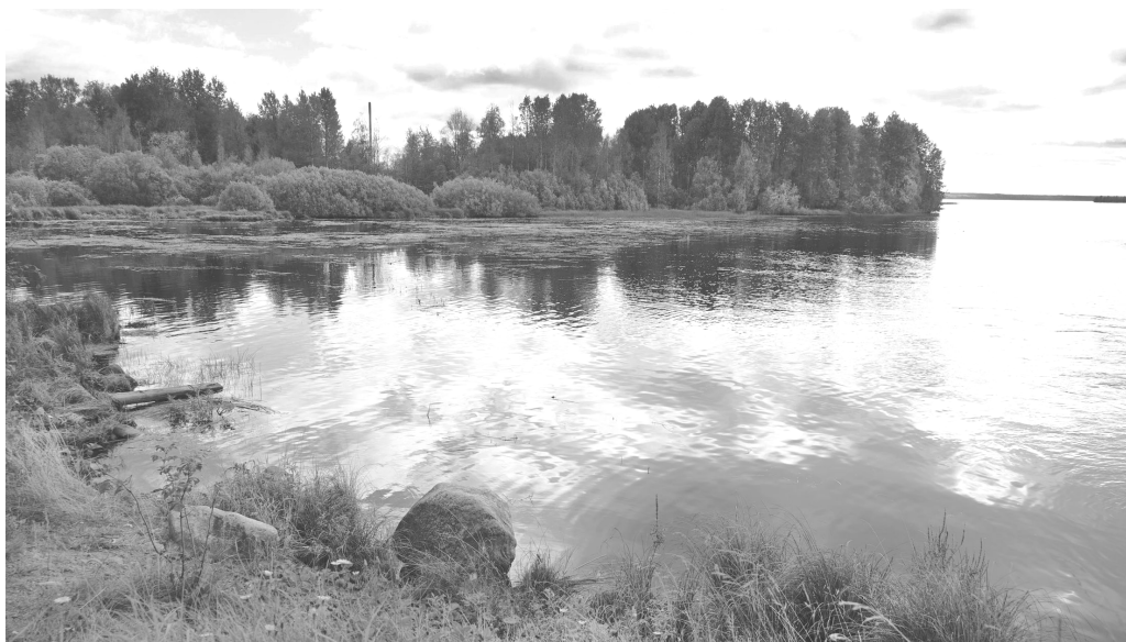
Ryc. 3. Krajobraz brzegów jeziora Onega, (fot. J. Kurek, 2016) Fig. 3. The landscape of the Onega lake, (photo by J. Kurek, 2016)