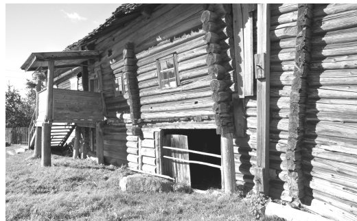
Ryc. 14. Kinerma, tradycyjny budynek mieszkalno-gospodarczy, (fot. J. Kurek, 2016) Fig. 14. Kinerma, traditional old farm-house, (photo by J. Kurek, 2016)