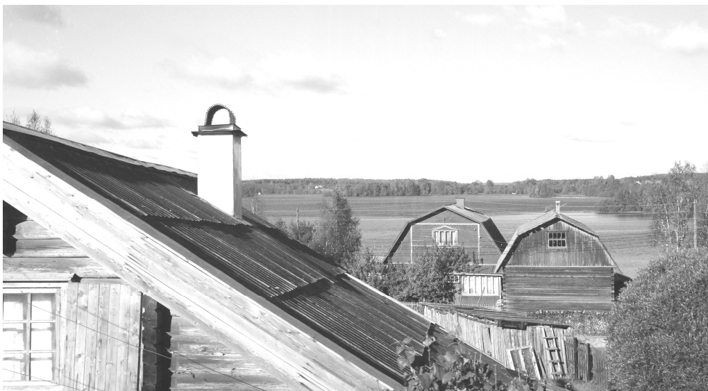
Ryc. 15. Okolice wsi Vedlozero, odmienne od tradycyjnych formy współczesnych budynków letniskowych i pensjonatowych, (fot. J. Kurek, 2016) Fig. 15. Around the village Vedlozero, different from traditional forms modern buildings cottages and guesthouses, (photo by J. Kurek, 2016)