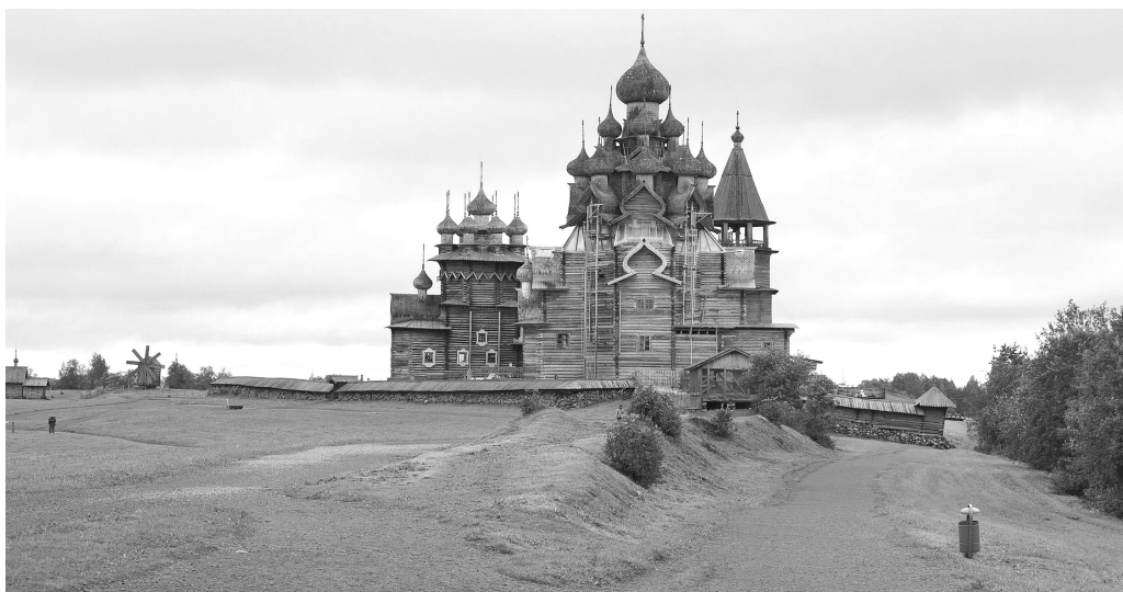
Ryc. 9. Kiży, zabytkowy zespół cerkiewny Kiży Pogost , (fot. J. Kurek, 2016)

Kiży są przykładem regionalnego centrum życia duchowego i symbolem więzów rodzinnych, społecznych i gospodarczych dla lokalnej społeczności wiejskiej, przy czym cenne jest to, że struktura nieodległej wsi i otaczającego krajobrazu, odzwierciedla tradycyjny układ gospodarki gruntami i rolnictwa.