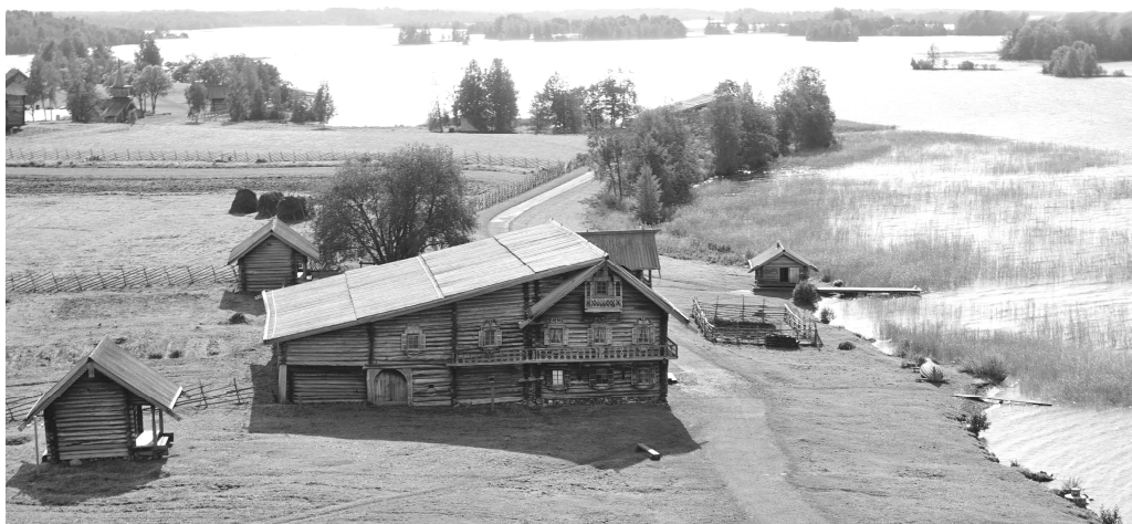
Ryc. 10. Kiży, zagroda z 1876 r. przeniesiona ze wsi Oszewniewo w 1951 r. (fot. J. Kurek, 2016)

Fig. 9. Kizhy, historic orthodox church ensemble Kizhi Pogost , (photo by J. Kurek, 2016)