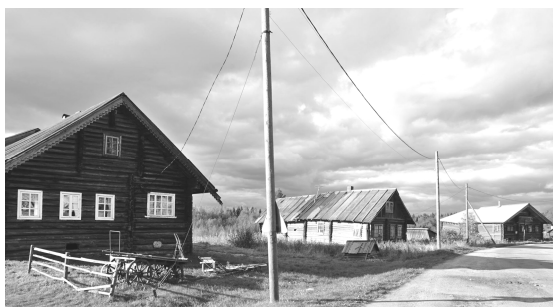
Ryc. 11. Kinerma, zabudowa etnicznej wsi karelskiej z budynkami sprzed 260 lat, (fot. J. Kurek, 2016) Fig. 11. Village Kinerma, Karelian ethnic village buildings before 260 years, (photo by J. Kurek, 2016)

Jak to ukazują prezentowane wyżej mapy, wyspa Kiży mieści jeszcze wiele innych cennych historycznych budowli drewnianych – reprezentujących regiony Rosyjskiej Północy. Znajdujemy tu: kaplice, domy mieszkalne, spichlerze, banie (przydomowe łaźnie), młyny wietrzne (wiatraki), kuźnię i krzyże pokutne (Ryc. 5).