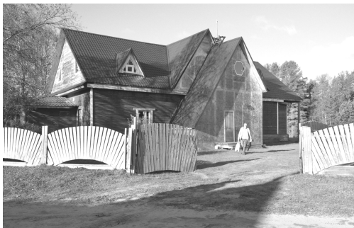
Ryc. 13. Manga, współczesny w formie i konstrukcji budynek pensjonatowy, (fot. J. Kurek, 2016) Fig. 13. Manga, contemporary in form and design of the guesthouse building, (photo by J. Kurek, 2016)

go dziedzictwa UNESCO 9 . Oprócz tego na terenie Karelii znajduje się przyrodniczo-historyczny obszar Walaam . Walory przyrodnicze i kulturowe Karelii są dziś głównymi atrakcjami przyrodniczymi tej rosyjskiej republiki. Ważnym elementem, są również wspólne działania Karelów, Finów i Wepsów mające na celu ochronę i promocję własnego dziedzictwa kulturalno-historycznego. Staraniom tym nie sprzyja jednak niski przyrost naturalny i stosunkowo duża emigracja mniejszości narodowych – głównie do Finlandii.