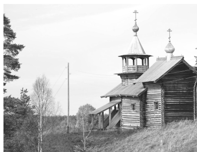
Ryc. 12. Manga, odrestaurowana kaplica wiejska (XVII w.), (fot. J. Kurek, 2016) Fig. 12. Village Manga, restored rural chapel (XVII century), (photo by J. Kurek, 2016)

Obszary chronione w Karelii zajmują ponad 5% jej powierzchni. Łącznie z terenami chronionymi częściowo jest to już blisko 13% powierzchni terenu tej krainy. Znajdują się tu dwa parki narodowe, dwa rezerваты przyrody, 46 obszarów krajobrazu chronionego i 108 pomników przyrody. Park Narodowy Paanajarwi został wpisany na listę światowe-