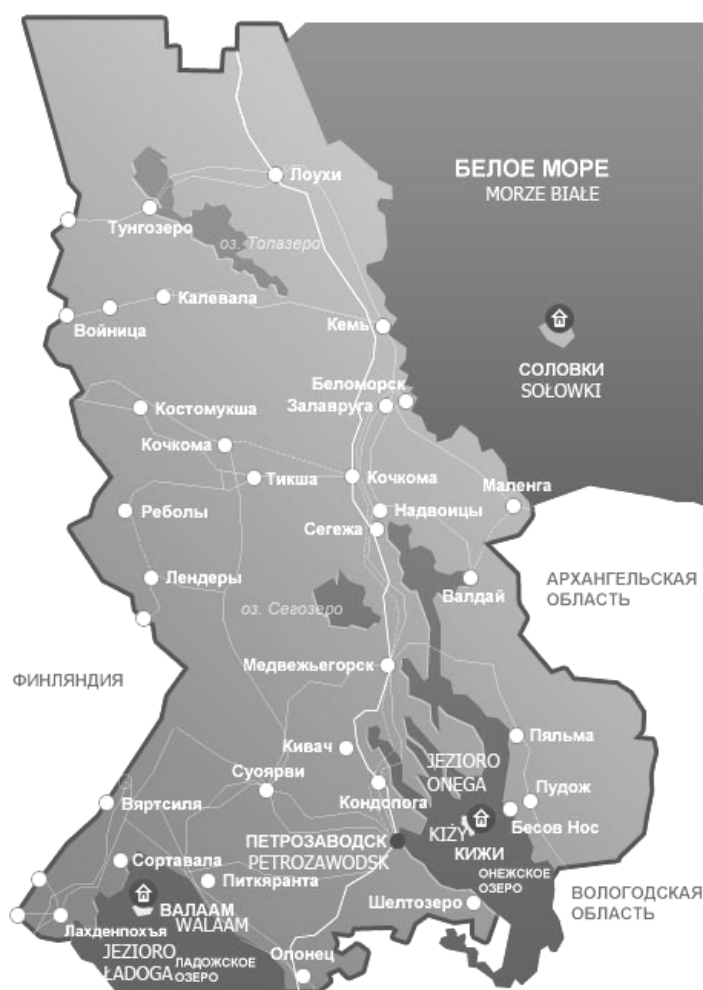
Ryc. 2. Główne atrakcje turystyczne Karelii: Kiży, Walaam, Sołowki, (źródło: wikipedia) Fig. 2. Karelia, main tourist attractions: Kizhy, Walaam, Solowki Island, (source: wikipedia)

Szansę wydobycia się z ekonomicznej zapaści władze Karelii widzą dziś w intensyfikacji ruchu turystycznego: nie tylko z Rosji, ale i z zagranicy – głównie z Finlandii. Dla turystów z Europy Zachodniej niewątpliwą atrakcją winna być nieskażona wpływem cywilizacji przyroda oraz zabytki architektury. Największym, najcenniejszym i najpiękniejszym zabytkiem jest z pewnością zespół drewnianych cerkwi, kaplic i domów mieszkalnych na wyspie Kiży (na jeziorze Onega) oraz ważny dla pielgrzymek religijnych monastyr na wyspie Walaam (Ryc. 2).