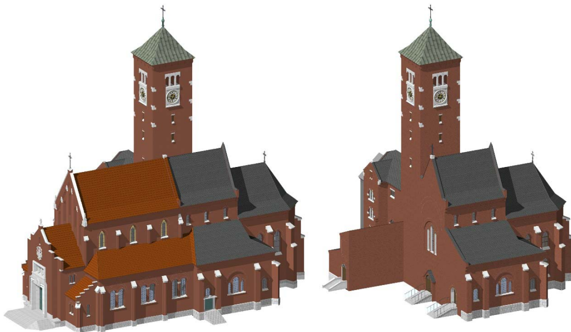
Il. 4. Kraków, kościół Niepokalanego Poczęcia NMP. Z prawej: faza I, 1908-1910, z lewej: faza II, 1929-1933