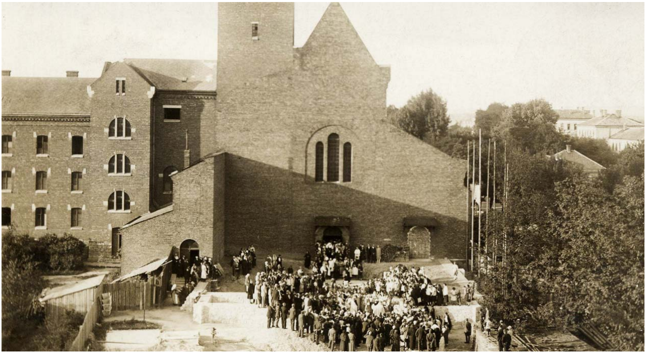
Il. 2. Zdjęcie z uroczystości wmurowania i poświęcenia kamienia węgielnego, 15.08.1929