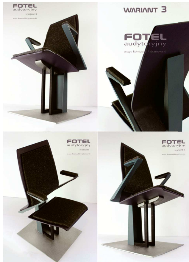
Rys. 1. Model imitacyjny wybranego do realizacji wariantu fotela audytorijnego Fig. 1. Imitative model chosen for the implementation variant seat auditorium

W swym wstępnym projekcie, projektant zaproponował odejście od tradycyjnego „grawitacyjnego” sposobu składania siedzenia do pionu za pomocą ciężkiej metalowej sztaby, która umocowana do tylnej krawędzi siedzenia powoduje, że siedzisko pod jej ciężarem ustawia się w pionie. Jest to bardzo prosty sposób składania siedzenia. Jednak jego wielkim mankamentem jest spory ciężar, który w przypadku użycia na widowni czy w audytorium kilkuset foteli, znacznie zwiększa obciążenie stropu, a w konsekwencji nie we wszystkich salach możemy zastosować krzesła z takim typem odchylania siedzenia (rys. 1).