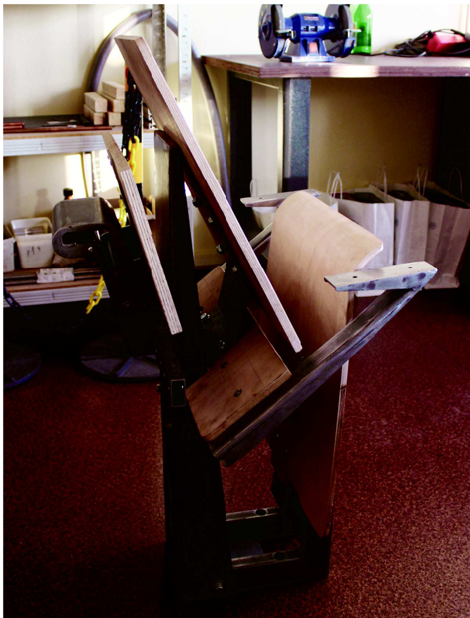
Rys. 5. Prototyp wykonany do badań Fig. 5. The prototype made test

Udało się w tym projekcie te wszystkie szczegółowe uwarunkowania spełnić, uwzględniając także wszystkie założenia producenta. Powstał wyrób funkcjonalny, ciekawy stylistycznie i spełniający oczekiwania tak inwestora jak i jego klientów (rys. 5).