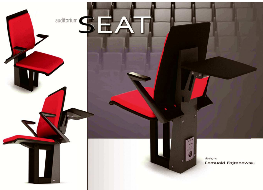
Rys. 3. Wizualizacja opracowanego fotela audytoryjnego – wersja z półką i gniazdem Fig. 3. Visualization developed seat auditorium – version with a shelf and into an electrical outlet