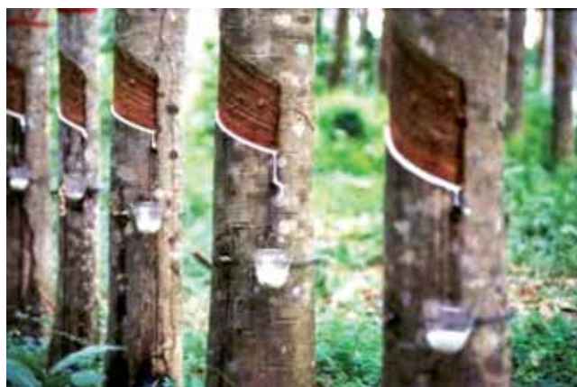
Rys. 1 Plantacja Hevea brasiliensis [10]

się w porze porannej, co 2-3 dni, uzyskując z hektara upraw do 2500 kg tego produktu rocznie [5].