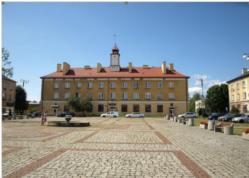
Fig. 3. View of the square at the Krasicki Street in Wierzbica.

A square, built on a square plan at the Krasicki Street, is the central place of the estate. There local public administration buildings are currently located (police, cultural centre, social welfare centre). Green area, i.e. a park, touches the central square. On three sides of the square there are residential and service buildings, whereas the western side remains open giving a view on a town hall located on the other side of the building axis.