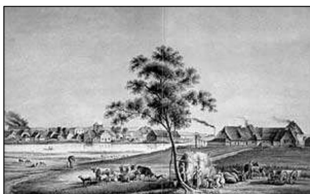
Ryc.1. Litografia Katowic (E.W. Knippel) Fig. 1. Lithography of Katowice area (E.W. Knippel)

Region kształtował się na terenie, w którym przecinały się dwa ważne dla całej Europy historyczne korytarze komunikacyjne. Był to średniowieczny pruski szlak handlowy (prowadzący z Berlina na wschód doliną Odry wzdłuż Sudetów i Pogórza Karpat do Lwowa) oraz starożytny bursztynowy szlak handlowy (z Europy Południowej do Środkowej i Północnej przez Bramę Morawską). Górny Śląsk był więc miejscem powiązań komunikacyjnych i wymiany kulturowo-handlowej (Konopka, 2002). W XIII i XIV w. na Śląsk przyjeżdżało wielu kolonistów zainteresowanych tanią ziemią, dogodnymi warunkami naturalnymi oraz mniejszą konkurencją w rzemiośle i handlu.