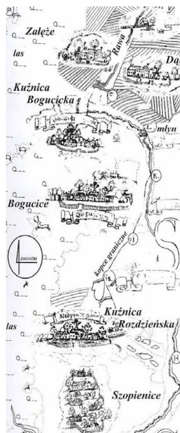
Ryc. 2. Osadnictwo nad rzeką Rawą Fig.2 Settlement by the Rava river