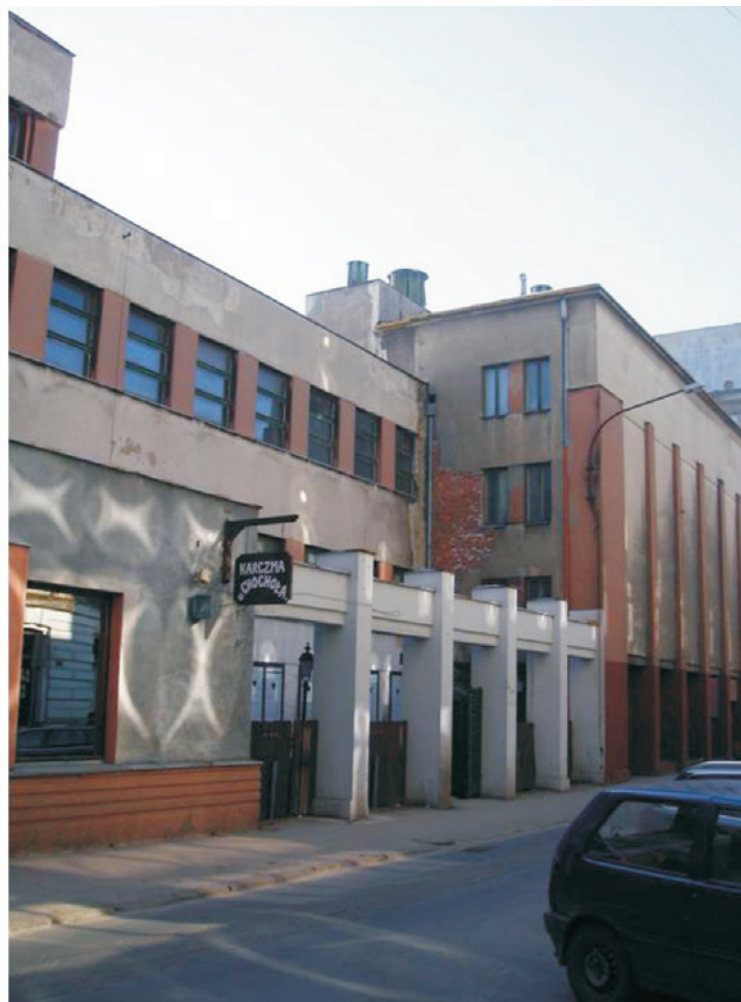
Ryc. 5. Gmach Polska Y.M.C.A. przy ulicy S. Moniuszki 4a w Łodzi; autor projektu: Wiesław Lisowski, 1931 rok; fot. autorka Fig. 5. Poland Y.M.C.A. at 4a S. Moniuszko Street in Łódź; author of the project: Wiesław Lisowski, 1931; photo by the author