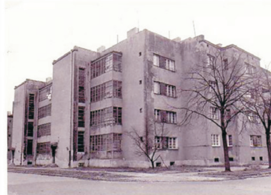
Ryc. 11. Kolonia mieszkalna na Polesiu Konstancyńskim w rejonie ulic Srebrzyńskiej, Jarzynowej, alei Unii w Łodzi; autorzy projektu: Jerzy Berliner, Jan Łukasik, Miruta Słońska, Witold Szereszewski, widok założenia; rys. autorka