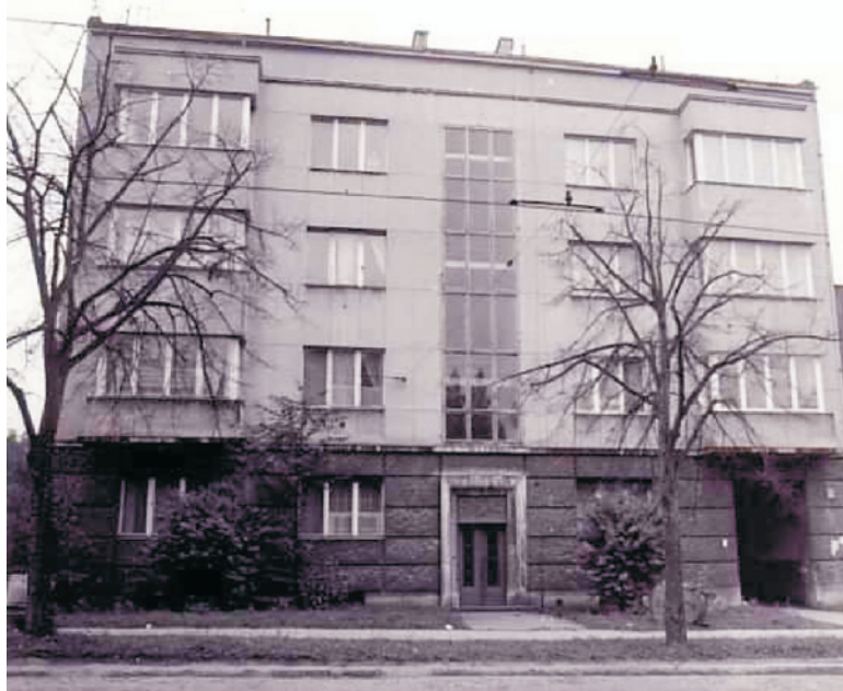
Ryc. 13. Kamienica przy ulicy G. Narutowicza 93a w Łodzi; autor projektu: Paweł Lewy, 1937 rok; fot. autorka