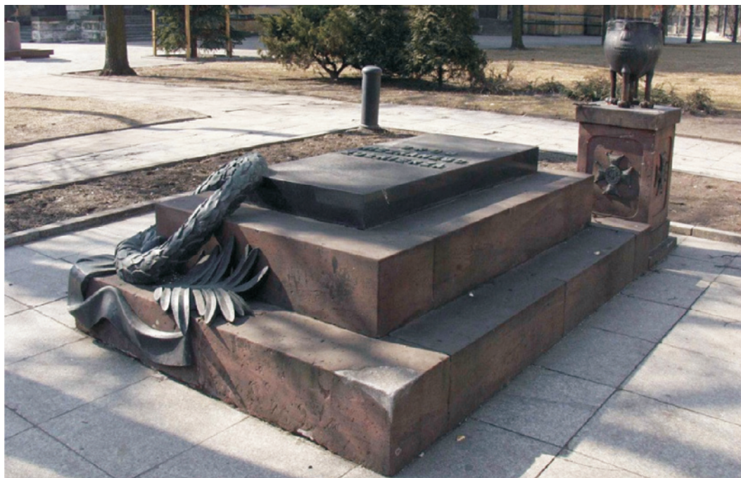
Fig. 9. Tomb of the unknown soldier on the Cathedral Square John Paul II in Łódź; author of the project: Stanisław Ostrowski 1924; photo by the author