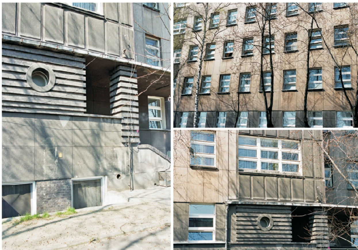
Ryc. 7. Okręgowy Szpital Wojskowy im. gen. Felicjana Sławoja Składkowskiego przy ulicy S. Żeromskiego 113 / alei A. Mickiewicza w Łodzi; autorzy projektu: Stanisław Odyniec-Dobrowolski, Julian Lisiecki, Janusz Krauss, 1935 rok, widok od strony skrzyżowania