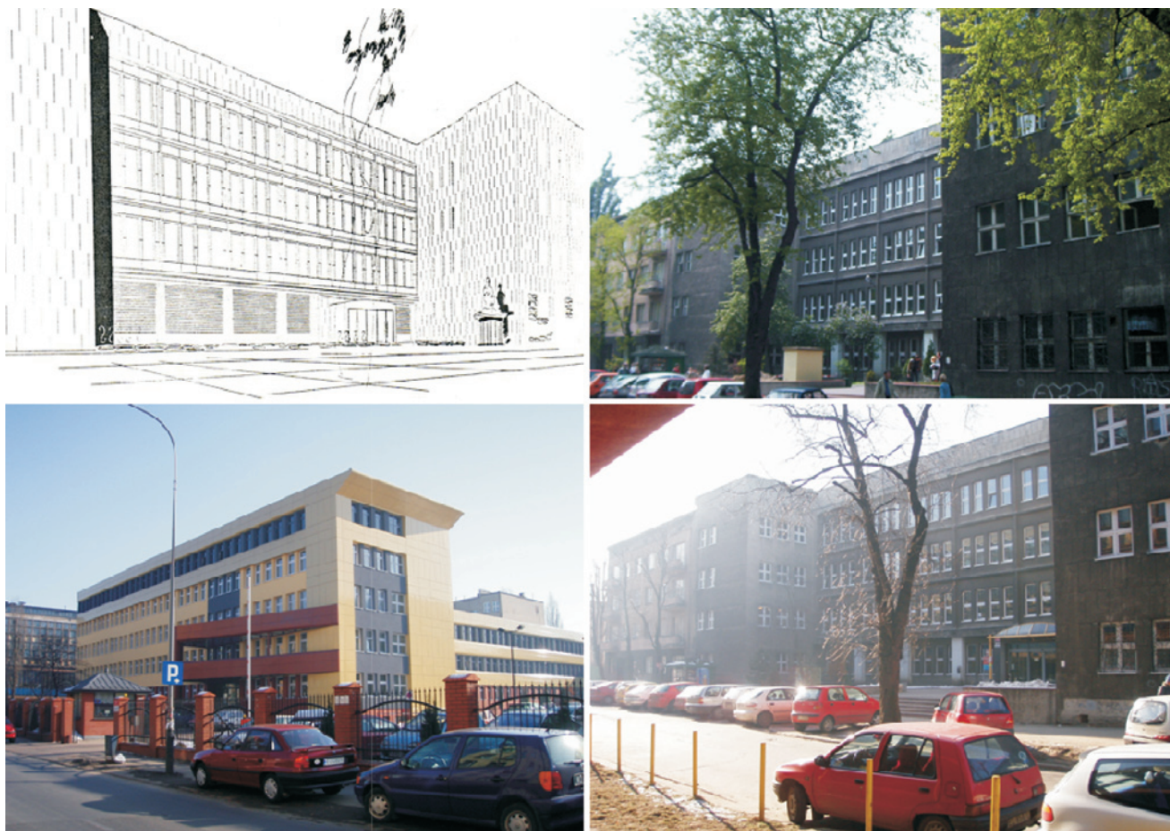
Ryc. 4. Gmach Wolnej Wszechnicy Polskiej przy ulicy Polskiej Organizacji Wojskowej / ulicy Rewolucji 1905 roku w Łodzi; autorzy projektu: Waław Kłyszewski, Jerzy Mokrzyński, Eugeniusz Wierzbicki, 1937 rok, widok perspektywiczny od ulicy P.O.W. według projektu (za „AiB” 1937, nr 8, s. 309), widok od ulicy P.O.W, fot. autorka