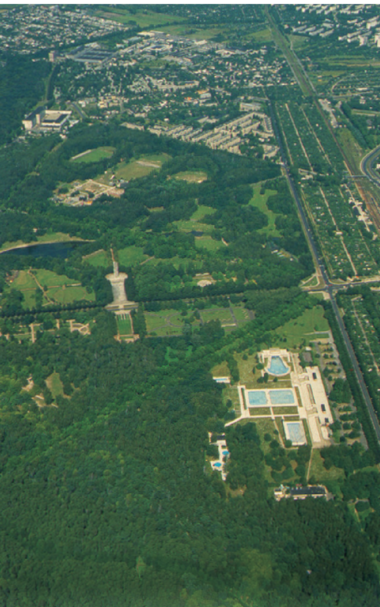
Ryc. 8. Park Ludowy im. Marszałka Józefa Piłsudskiego na Zdrowiu w rejonie ulic Konstantynowskiej 3/5, Srebrzyńskiej, Krzemienieckiej, Krakowskiej, alei Zdrowie, alei Unii w Łodzi; autorzy projektu: Edward Ciszewicz 1922 rok, Stefan Rogowicz 1930/31 rok, widok założenia; fot. Wiesław Stępień