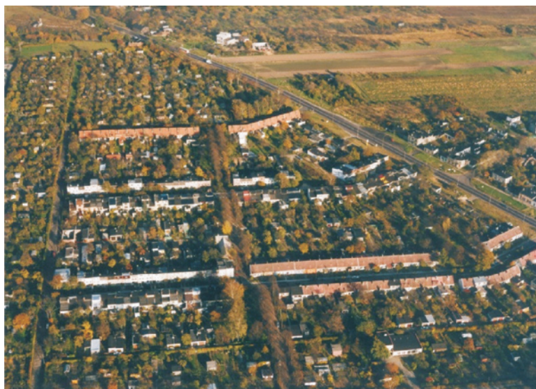
Ryc. 12. Osiedle Mieszkaniowe TOR na Marysinie III w rejonie ulic Ołowianej, Kwarcowej, P. Strzeleckiego w Łodzi; autorzy projektu: Brabara i Stanisław Brukalscy, Helena i Szymon Syrkusowie, Biuro Planu Regionalnego w Łodzi, 1934 rok, domki według projektu Heleny i Szymona Syrkusów