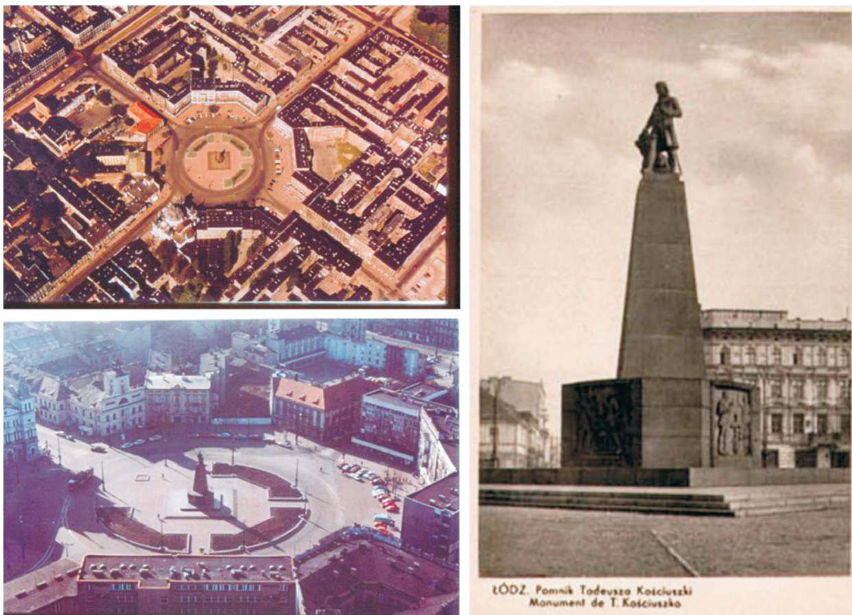
Ryc. 10. Pomnik Tadeusza Kościuszki na Placu Wolności w Łodzi; autor projektu: Mieczysław Lubelski, 1925 rok, widok założenia