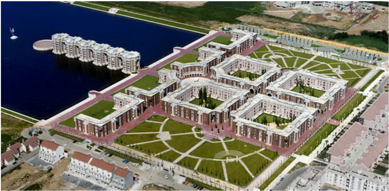
3. Les Arcades Du Lac, Le Viaduc.