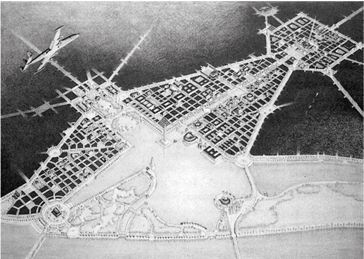
5. Waszyngton 2000, perspektywa lotnicza.