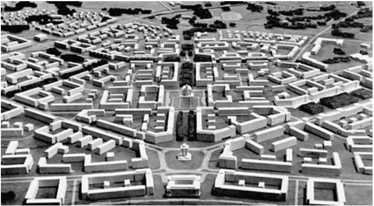
1. Plan ogólny Nowej Huty (jedna z wersji alternatywnych). Źródło: Nowa Huta – architektura i twórcy miasta idealnego, Niezrealizowane projekty , red. A. Biedrzycka, Muzeum Historyczne Miasta Krakowa, Kraków 2007

1. The plan of Nowa Huta (one of alternative versions)