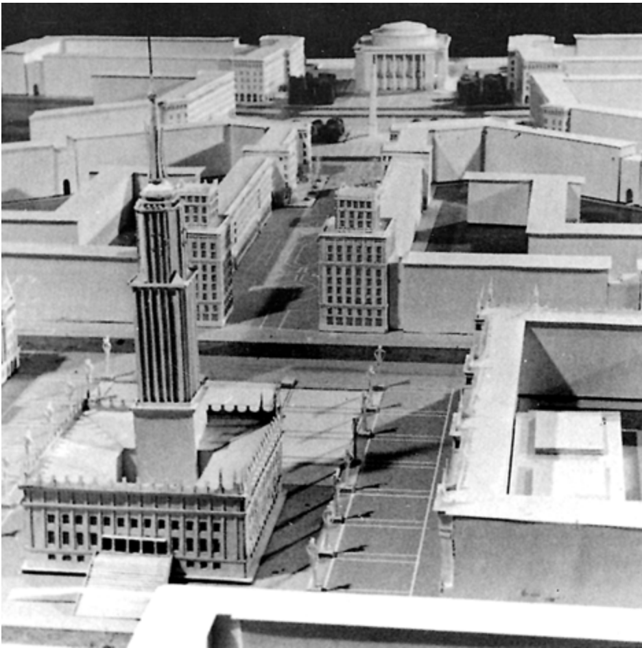
2. Zabudowa Placu Ratuszowego i Placu Centralnego (jedna z wersji alternatywnych). Źródło: Nowa Huta – architektura i twórcy miasta idealnego, Niezrealizowane projekty , red. A. Biedrzycka, Muzeum Historyczne Miasta Krakowa, Kraków 2007