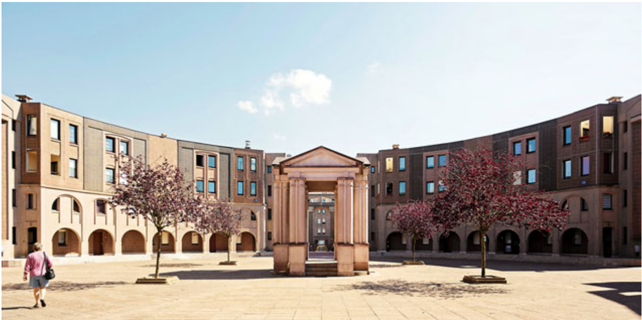
4. Les Arcades Du Lac. Le Viaduc.