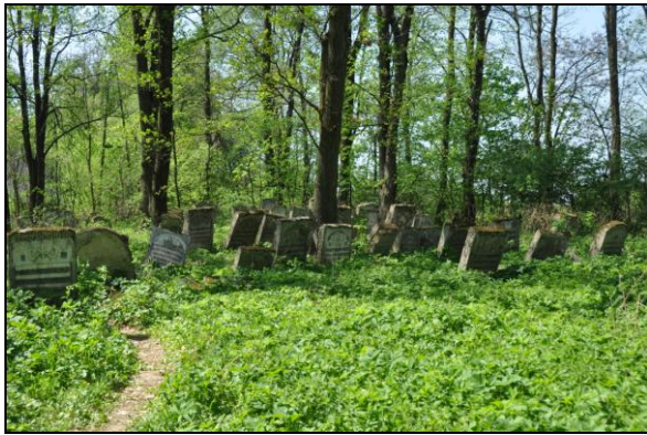
Fot. 7. XVI-wieczny kirkut w Szczepieszynie – jeden z najstarszych w Polsce zachowanych cmentarzy żydowskich.

Photo 6. The 19 th century Orthodox church of St. John The Theologian in Chełm.