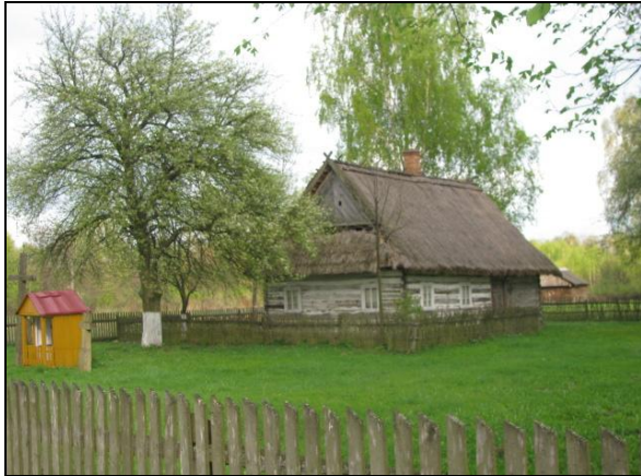
Fot. 1. Zabudowania prawosławnej wsi Hola w powiecie włodawskim.

Photo 1. Buildings in the Orthodox village Hola in Włodawa County.