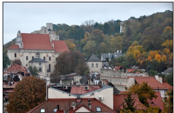
Fot. 4. Malowniczy krajobraz Kazimierza Dolnego, będący inspiracją dla kolejnych pokoleń artystów.

Photo 3. Untypical, fan layout of The Old Town in Lublin – it is a result of adaptation of the streets and buildings to irregular relief.