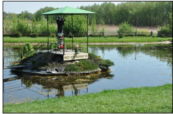
Fot. 8. Kapliczka św. Antoniego na niewielkim zbiorniku wodnym w Radeczniczy.

Photo 7. The 16 th century Jewish cemetery in Szczepieszyn – one of the oldest well-preserved Jewish graveyards in Poland.