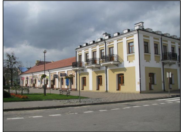
Fot. 2. „Czworobok” na rynku we Włodawie – XVIII-wieczny, unikatowy w skali Polski budynek kramów miejskich i jatek, należących do włodawskich Żydów. Do dziś pełni funkcje handlowe i usługowe.

Photo 1. Buildings in the Orthodox village Hola in Włodawa County.