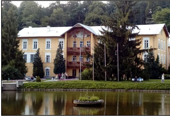
Fot. 5. Nałęczów – park zdrojowy z zabytkową architekturą sanatoryjną.

Photo 5. Nałęczów – park in the health-resort with historic spa architecture.