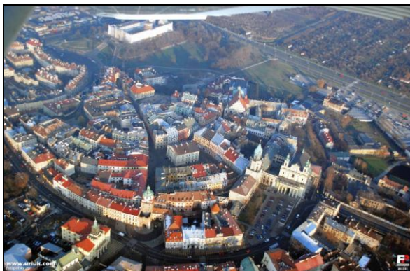
Fot. 3. Nietypowy, wachlarzowy układ starówki w Lublinie powstał w wyniku dostosowania zabudowy do nieregularnej rzeźby terenu

Photo 2. „Quadrilateral” in the marketplace in Włodawa – the 18 th century, unique in Poland, building of town stands and butcher’s stalls which belonged do the Jews. It has been operating as object of trade and service functions.