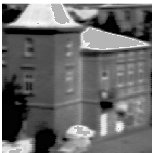
Termogram tego samego budynku zarejestrowany w lecie tą samą kamerą