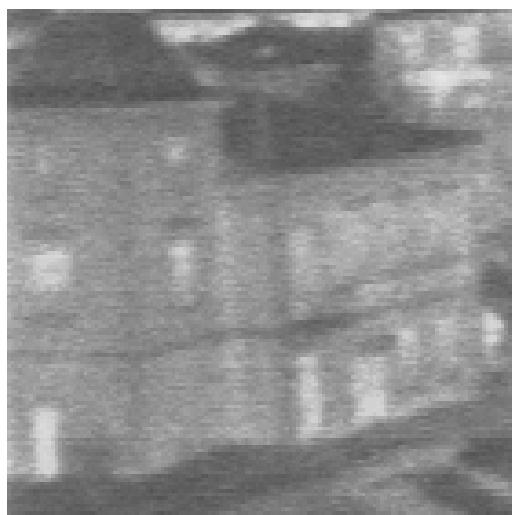
Termogram budynku zarejestrowany w zimie