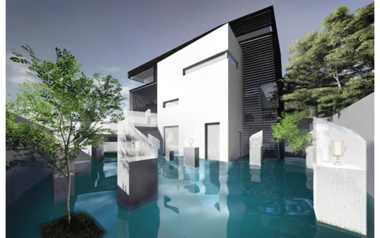
Il. 7. Budynek recepcyjny, 2017, proj. Mariusz Twardowski i Miłosz Jakubowski, wiz. Agnieszka Żabicka / Reception building, 2017, design by Mariusz Twardowski and Miłosz Jakubowski, vis. Agnieszka Żabicka

Kolejnym zabiegiem funkcjonalnym było doświetlenie kondygnacji -1. Znajdują się tam biura. Obniżona powierzchnia przed budynkiem to kolejny, niewielki akwen, który stał się przestrzenią reprezentacyjną: „Ogrodem Trofeów”. W przeszklonych gablotach na betonowych postumentach znajdują się puchary i zdobycze sportowe Inwestora. Wraz z budynkiem odbijają się na tle nieba w otaczającej wodzie.