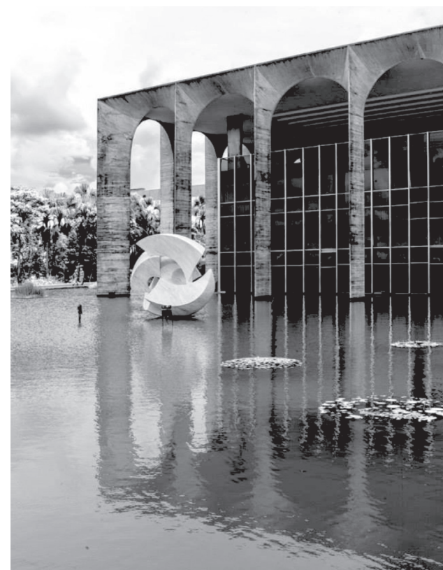
Il. 4. Palácio Do Itamaraty, 1970, proj. Oscar Niemeyer, / Palácio Do Itamaraty, 1970, design by Oscar Niemeyer

The work of Niemeyer in Brasilia after winning a competition along with Lucio Costa in 1957 for a new capital of Brazil has made its mark on world modernist architecture. One of the works that he had created there went beyond his previous utopian vision of the world that surrounded him 14 . This excellent example of Bra-