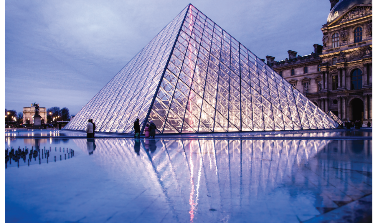
Il. 5. Piramida Luwru, 1989, proj. Ieoh Ming Pei / Louvre Pyramid 1989, designed by Ieoh Ming Pei

wych jest Palácio do Itamaraty. Obiekt mieści w sobie siedzibę Ministerstwa Spraw Zagranicznych. Nowoczesny pałac został otwarty w 1970 roku i po dziś dzień uznawany jest za jedno z najznakomitszych dzieł architekta 15 . Jego symetria, rytm i niezwykła lekkość wynoszą obiekt na wyższy poziom. Przed Pałacem Łuków zaprojektowany został basen refleksyjny, który okala budynek. Lustro wody podkreśla i umacnia wagę budynku. Piętnaście ostrych jak brzytwa kolumn każdej elewacji zdaje się przecinać lustrzaną tafel z której wyrastają. Niemal abstrakcyjny obraz który kształtuje architektura i jej odbicie staje się symbolem Brasiliu, zaskakuje i wzrusza, skłania do refleksji, podkreśla powagę miejsca 16 .