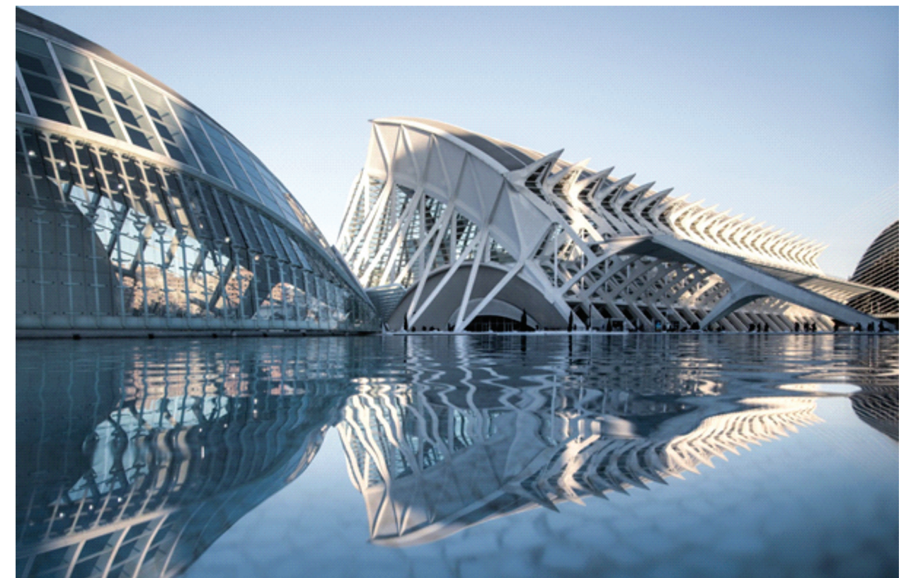
Il. 3. Miasteczko Sztuki i Nauki, 2009, proj. Santiago Calatrava / The City of Arts and Sciences, 2009, designed by Santiago Calatrava

The Spanish City of Arts and Sciences (Ciudad de las Artes y de las Ciencias) was designed by Santiago Calatrava. The architect has been familiarising himself with Valencia ever since he was a child, as it is his hometown 10 . His observations and love of light produced a design of a complex built in the years 2005–2009 on thirty five hectares of land 11 . It impresses with its scale and avant-garde architecture. Dynamism, geometry, rhythm, symmetry and a sculptural character are its main characteristics. The complex is located half-way between the historical old town and the Balearic Sea coast and appears to be a link between them. It is composed of an Opera House—Palau de les Arts, which replaced a telecommunications tower planned at the site, a Planetarium/cinemas—L'Hemisfèric, the largest European oceanarium—L'Oceanogràfic, a Science Museum—Museu de les Ciències Príncipe Felip, L'Umbracle, as well as Agoras. The City was built at the site of the River Turia's dried up riverbed 12 . The architect decided to reintroduce