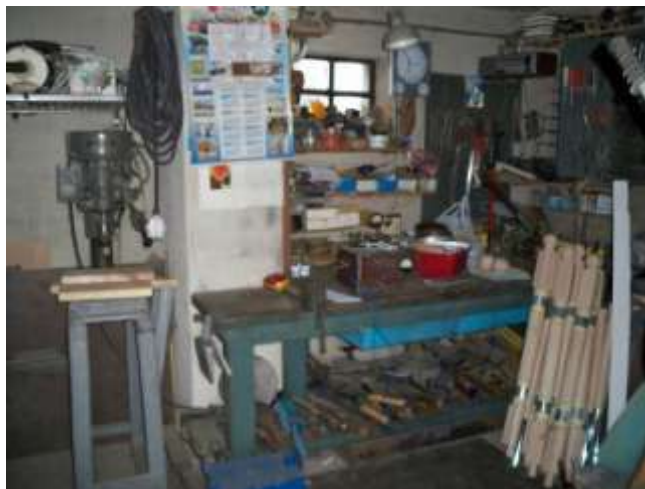
Rys. 2. Umieszczenie wiertarki stołowej

Na podstawie obserwacji i doświadczenia można założyć, że od pracownika pracującego na stanowisku obsługi wiertarki stołowej wymaga się szczególnej zdolności w zakresie: szybkiego reagowania na sytuacje bodźcowe, koordynacji wzrokowo-ruchowej, koncentracji i odporności na stres, a także sprawności ruchowej.