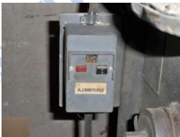
Rys. 4. Wylłącznik awaryjny „stop”

Zagrożenie 1 – nieuwzględnienie w konstrukcji maszyny rozwiązań umożliwiających osobom trzecim łatwy dostęp do wyłącznika awaryjnego „stop” (rys. 4).