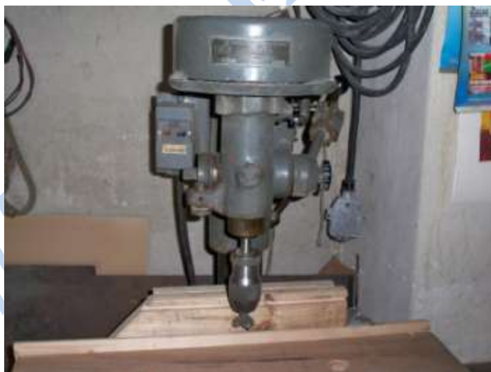
Rys. 1. Wiertarka stołowa

Części, oprzyrządowanie, narzędzia i wyposażenie pomocnicze są rozmieszczone w stałych miejscach, jednak w pewnej odległości od stanowiska pracy. W pomieszczeniu, w którym znajduje się wiertarka stołowa, nie ma miejsca na stworzenie odpowiednich i wygodnych warunków pracy.