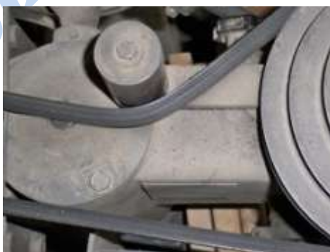
Rys. 5. Wiertarka stołowa – brak osłony na górnej części maszyny